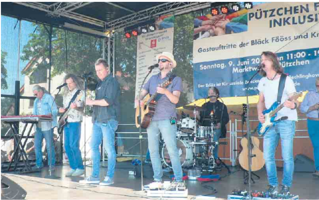
Die Bläck Fööss hatten auch in Pützchen ihr Publikum, das begeistert mitsang.

Pützchen. Gute Planung und Organisation, herrliches Wetter sowie sehr viele Besucher bei der dritten Auflage des Ortsfestes „Pützchen feiert inklusiv“, da konnte nichts mehr schiefgehen. Genau so war es! Der trotz mehrerer Tausend Besuchern sehr familiäre Rahmen ergab ein Fest voller Spaß, Freude und Ausgelassenheit bei Jung und Alt. Die bisherigen zwei großen inklusiven Ortsfeste in Pützchen haben viele Menschen zusammengeführt. Das war auch diesmal der Fall, gab es doch gleich drei Geburtstage zu feiern: 35 Jahre Therapiezentrum - 38 Jahre Nommensen Kirche - 60 Jahre Ortsvereine Pützchen-Bechlinghoven. Die Arbeitsgruppe G7, bestehend aus sieben Frauen, hatte nach 2014 und 2019 auch 2024 alles perfekt geplant und organisiert. Bevor gefeiert wurde fanden in den örtlichen Kirchen inklusive Gottesdienste statt. Die Marktwiesen boten dann ein Bild wie ein kleiner Pützchens Markt. Viele Stände der Vereine, Institutionen und Gruppierungen sorgten auf dem Gelände gegenüber der Marktschule für Speisen und Getränke. Zudem hatte der Eine-Welt-Laden einen Stand mit Produkten aus aller Welt aufgebaut, ein Künstler aus Köln bot seine Bilder an und Glückslose für eine