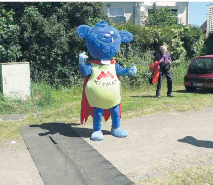
„Mitmän“, der NRW-Inklusions-Botschafter feierte auch in Pützchen.

Mitsingen animierten. Den Abschluss machte die Brassband Knallblech mit Partyrhythmen und Disco Beat. Alle an dieser Veranstaltung Beteiligten arbeiteten ehrenamtlich. Der Erlös des Festes ist für soziale Zwecke in Pützchen-Bechlinghoven bestimmt, soll aber besonders den schwerstbehinderten Bewohnern und Bewohnerinnen des Therapiezentrums zugutekommen. wm