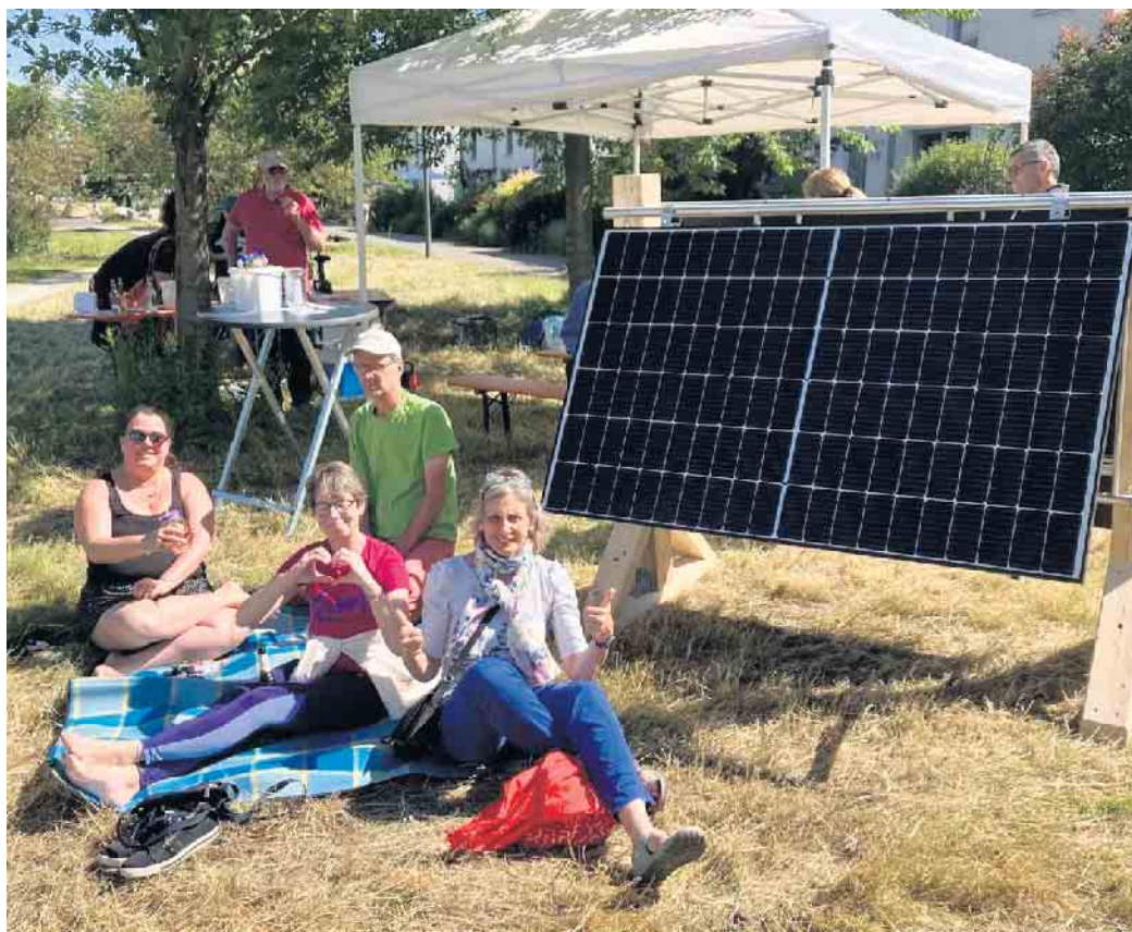
Gemütlicher Solartag in Vilich-Müldorf. Das Kraftwerk wartet noch auf die neuen Besitzer.

Nachmittags startete dann die erste Solarparty auf den Vilich-Müldorfer Angerwiesen. Bei Sonnenschein, Kaltgetränken und Verpflegung blieb genügend Zeit