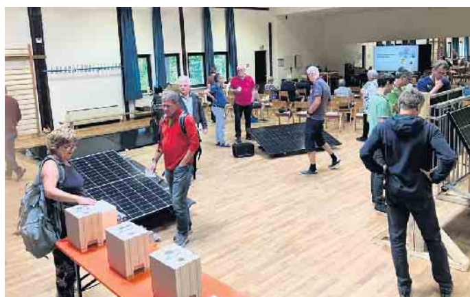
Gut besuchter Workshop in der Mühlenbachhalle mit Infos über Balkonkraftwerke.

Wer mehr über Balkonkraftwerke wissen möchte, sollte die Website des BV ( bv-vilich-mueeldorf.de/balkonkraftwerk ) besuchen. Hier werden für Interessierte auch kostenlose Beratungen vor Ort angeboten. wm