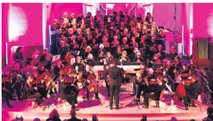
20 verschiedene Nationalitäten sind im International Voices Choir vertreten, der sein aktuelles Programm „Bonn goes Broadway“ präsentiert.

„Bonn goes Broadway“ heißt das aktuelle Konzertprogramm des International Voices Choir am 23. Juni, Die Sänger und Sängerinnen des in Bonn beheimateten Chors kommen aus 20 verschiedenen Nationen und zelebrieren ihre