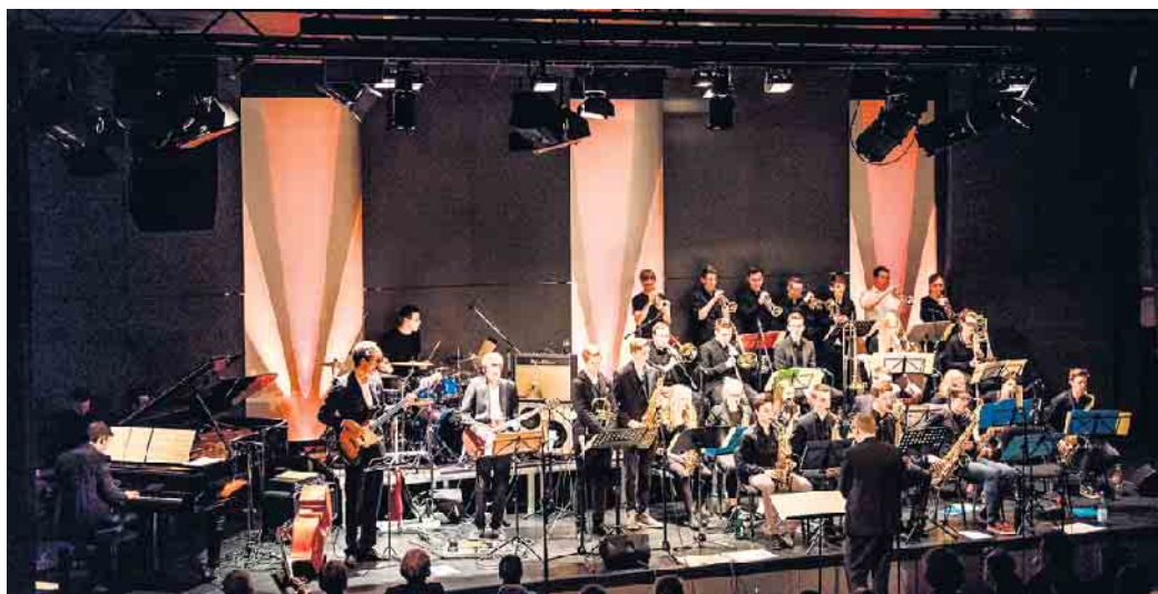
Das Jugend Jazz Orchester Bonn erhielt den Nachwuchspreis des WDR.

Das Pantheon bietet dann am 18., 19. und 21. Juni, beim Spotlights-Schultheaterfestival Schülerinnen und Schülern die Möglichkeit, mit den Theaterinszenierungen ihrer Schulen einmal richtige Theater-