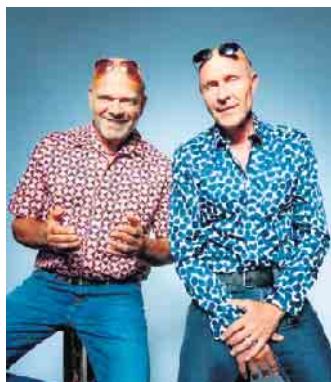
Nach dem Auftritt des Acapella-Comedy-Duo „Die Feisten“ geht es in die Sommerpause.

Weitere Infos und Tickets unter www.pantheon.de . wm