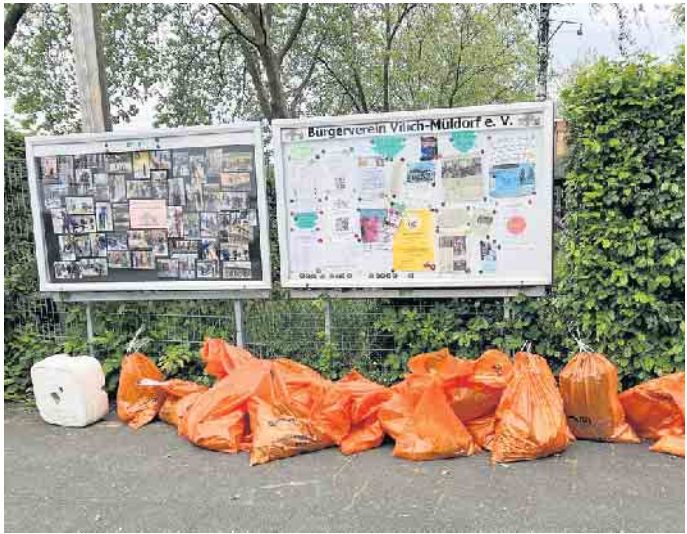
Das Ergebnis der Müllsammlung wartet auf Abholung durch bonnorange.