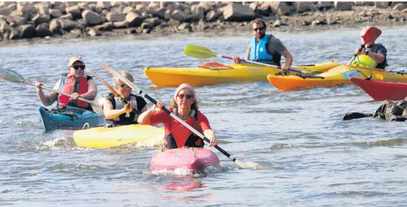
Gemütlich und ohne Stress macht es auch Spaß.

Oberkassel. Ein Sammelbecken für Vereine und ihre Mitglieder ist im Stadtbezirk Beuel eindeutig der Ortsteil Oberkassel. Das Eldorado für Vereine bietet allen, die einem Hobby nachgehen, die Möglichkeit, sich zu engagieren. Der Verband der Ortsvereine (VdO) ist die seit 95 Jahren bestehende örtliche „Dachorganisation“ von 30 Vereinen. Aus Anlass des VdO-Jubiläums stellt sich 2023 im Rahmen der Kampagne „Wir für Euch“ jeden Monat ein Mitgliedsverein in einem der Oberkasseler Geschäfte vor. Im Juni ist das der Oberkasseler Wassersport-Verein (OWV), der sich in der Kronen-Apotheke, Königswinterer Str. 622 präsentiert. Der OWV ist noch etwas älter als der VdO. Er besteht seit 1923 und kann auf ein langes erfolgreiches Vereinsleben zurückblicken. Weil in dem beliebten Oberkasseler Strandbad am Rhein immer wieder Menschen ertranken, wurde der Verein vor 100 Jahren als Schwimmverein gegründet, mit dem erklärten Ziel, als Lebensrettungsschwimmer die Badegäste zu schützen und Schwimmunterricht zu geben. Erst 1929 kam zum Wassersport der Kanusport hinzu. Heute sieht sich der OWV eher als