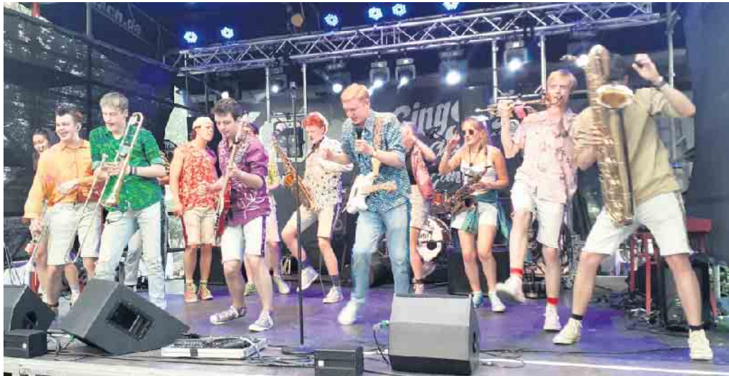
Die Gruppe „Knallblech“ war im letzten Jahr das Highlight des Dorffestes in Vilich-Müldorf.

Buntes Treiben rund um die Mühlenbachhalle