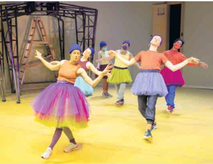
Die Inszenierung „Das Leben macht mir keine Angst“ ist der Festivalbeitrag des JSH Düsseldorf.

Das Theatertreffen WESTWIND ist in Beuel zu Gast