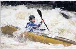
Der Kampf mit den Tücken des Wildwasserkanals ist ein echter sportlicher Kraftakt.

Kanu-Sportverein, da sich die Mehrheit der Mitglieder dem Bootssport im Kajak und Canadier verschrieben hat. Im Wildwasser-Rennsport standen über die Jahre auch OWV-Kanuten immer wieder auf den Siegereckeln bei deutschen und internationalen Meisterschaften. Auch der Kanu-Olympiasieger Max Rendschmidt hat hier das Paddeln gelernt und ist bis heute noch Mitglied des Vereins. Er hat in seiner unglaublichen Karriere mehr als 60 Medaillen gewonnen, darunter 12 goldene. Bei der Mehrzahl der OWV-Mitglieder stehen die Kanu-Wanderfahrten im Vordergrund. In der wärmeren Hälfte des Jahres geht es wöchentlich aufs Wasser, um gemeinsam auf dem Rhein zu paddeln. Danach bietet der Bootshausbalkon beim gemütlichen Beisammensein einen herrlichen Blick auf den Sonnenuntergang über Bonn und dem Rheintal. An Wochenenden wird auch auf Flüssen der Region gepaddelt.