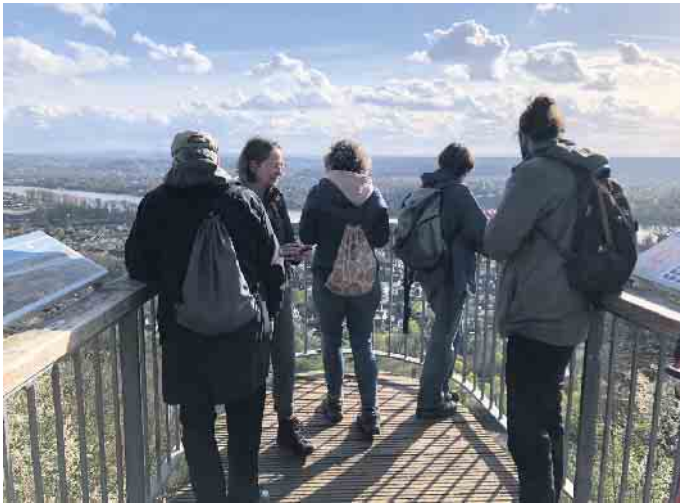
Erneuerte Tafeln am Skywalk.

Aufwertung des Nücker Felsenwegs im Ennert