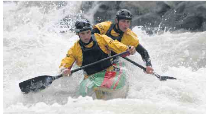
Kanuten des Oberkasseler Wassersportvereins kämpfen im Wildwasser um eine gute Platzierung.

tigte Kenterrolle. Der Oberkasseler Wassersportverein feiert sein Jubiläum am 17. Juni mit einem großen Fest am und im Bootshaus, zu dem alle Oberkasseler und natürlich auch alle Sportinteressierten von außerhalb herzlich eingeladen sind. Es gibt ein buntes Programm aus Kinderspielen, Schnupper-Paddeln, Kanu-Wettkampf, Vorführungen und Live-Musik. Für das leibliche Wohl zu zivilen Preisen ist ebenfalls gesorgt; Infos zum OWV finden Sie unter www.owv-oberkassel.de . wm