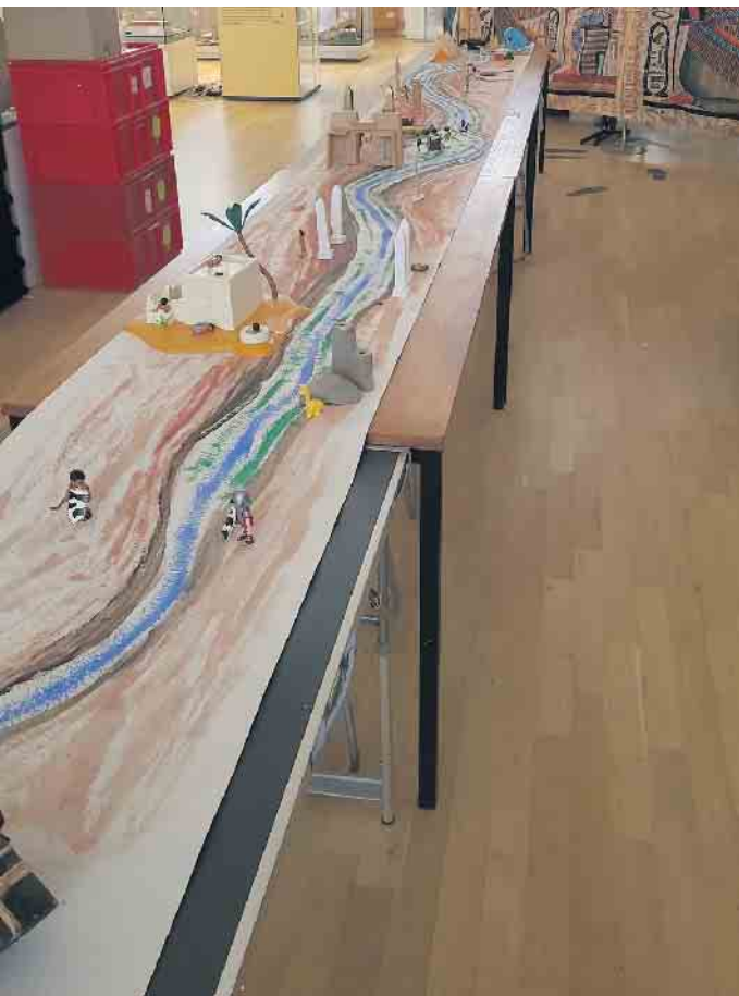
So kann ein Diorama selbst gebastelt aussehen.

Es werden Grabräume erstellt, die Wände werden bemalt, Objekte für das Grab werden gebastelt oder man nutzt fertige Objekte und stattet damit das Grab aus. Zwischendurch startet auch eine geheime Zeichensuche an den Wänden im Museum. Termin: 25. Mai, von 13 bis 17 Uhr