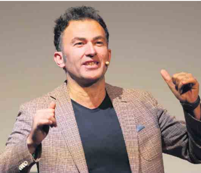
Makabre Geschichten einer Gesellschaft erzählt Fatih Çevikkollu.