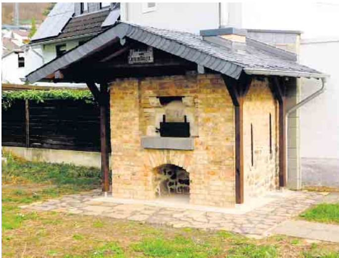
Aus uralt mach neu! Der alte Backofen am neuen Standort.