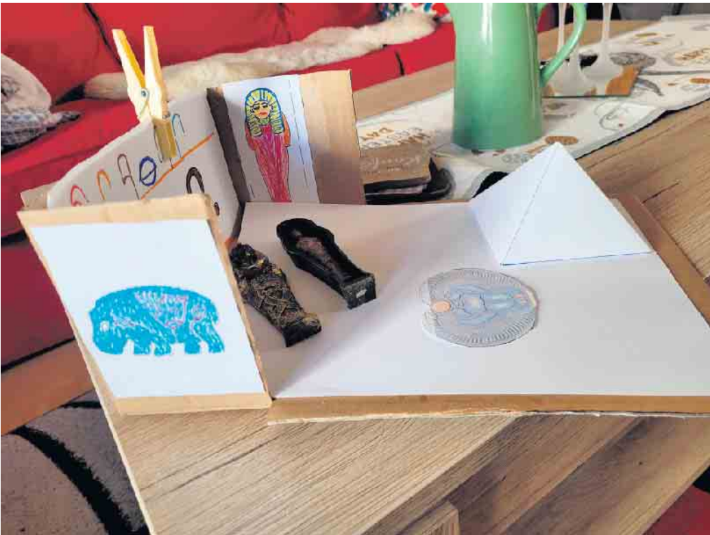
Der Nil von Assuan bis Kairo im Modell