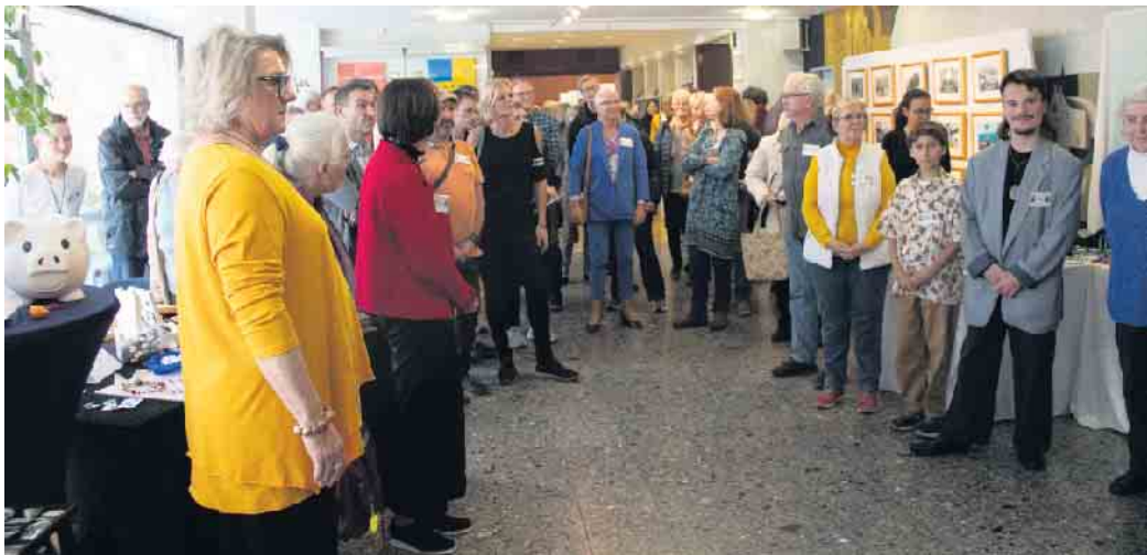
Künstler bei der Scheckübergabe