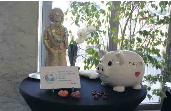
Sparschein für Spenden an den Hospizverein

sem Jahr bei Kaffee und selbst gebackenen Kuchen, der von den Ausstellerinnen und Ausstellern gespendet wurde, in der Cafeteria stärken. Auch in diesem Jahr haben einige Künstlerinnen und Künstler diverse Kunstwerke gegen eine Spende gestiftet. Mit so mancher Münze oder Schein wurde das große Sparschwein auch von den Besucherinnen und Besuchern „gefüttert“. Der Erlös der Cafeteria und des Sparschweins von insgesamt 1.057,37 Euro wurde am Sonntag kurz vor Ausstellungsende an den Beueler Hospizverein übergeben.