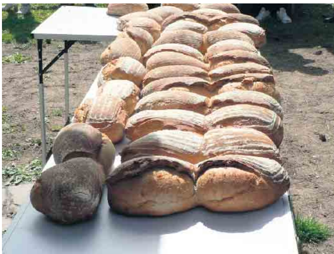
Leckeres frisches Brot für die Helfer.