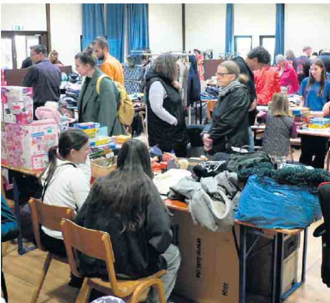
Ein großes Angebot verlockte die Besucher zum Stöbern und Kaufen.

Von außen weithin sichtbar gehört die Doppelkirche von Schwarzhofendörf zu den berühmten zweigeschossigen Kirchen des Mittelalters. Aus der eindrucksvollen Vereinigung von Architektur, Malerei und Skulptur stechen die Wandmalereien in den Gewölben hervor, die rätselhaft erscheinende Szenen aus dem alten und dem neuen Testament zeigen. Die achteckige Öffnung in der Zwischendecke verschafft einen einzigartigen Raumeindruck. Sonntag, 26. Mai, 15.30 Uhr 5 Euro / 2,50 Euro (ermäßigt) Martin Vollberg Katholisches Bildungswerk Bonn