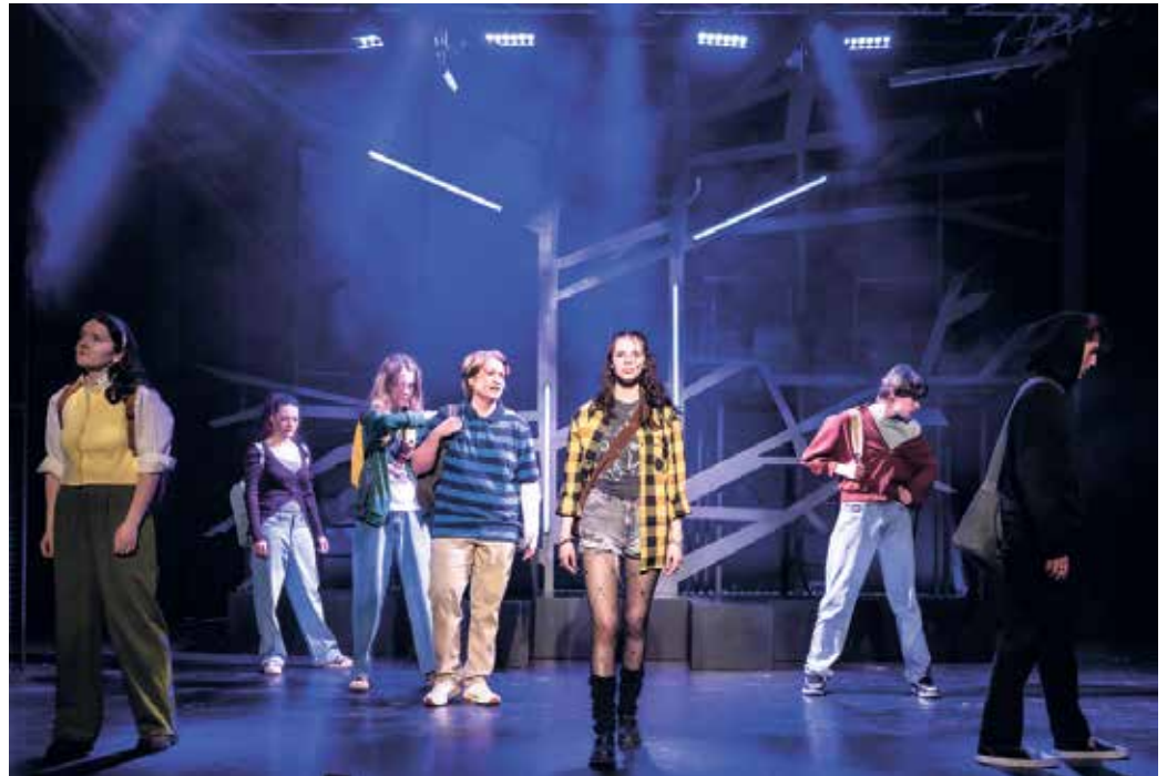
‚Dear Evan Hansen‘ im Jungen Theater Bonn.

Der Teenager Evan Hansen ist einsam und fühlt sich sein Leben lang unsichtbar. Im Rahmen seiner Therapie soll Evan Briefe an sich selbst schreiben, doch einer dieser Briefe gerät in die Hände seines Mitschülers Connor, der Evan regelmäßig mobbt. Doch als Connor sich kurz darauf das Leben nimmt, finden seine Eltern den Brief bei ihrem Sohn. Sie denken, dass Evan der beste Freund ihres Sohnes gewesen sei. Und Evan ist darüber so glücklich, dass er das Missverständnis erstmal nicht aufklärt, sondern es sogar noch weiterspinnt. Dabei wird Evan zur Hauptfigur der Aktivitäten an der Schule, mit denen die Trauer um Connor und sein Andenken gefeiert werden. Doch dann verstrickt Evan sich immer tiefer in dem Geflecht seiner Lügen, aus dem es bald kein Entrinnen mehr für ihn gibt, außer