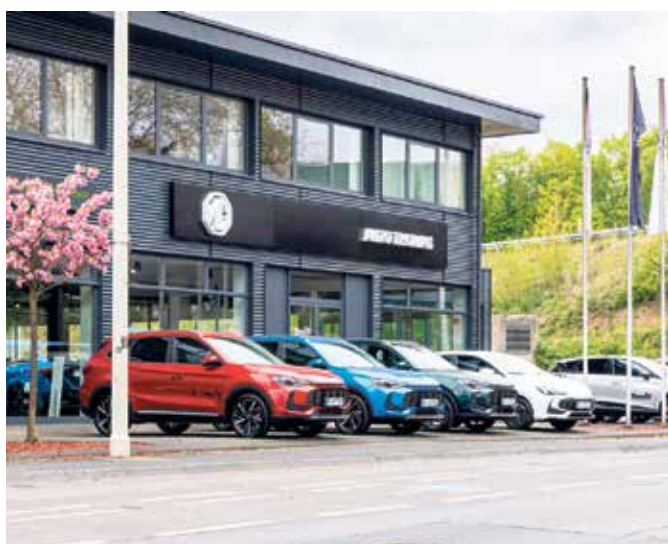
Dein MG-Partner in Bonn: Auto Thomas an der Königswinterer Straße 444 in Bonn-Ramersdorf.

Besuche uns und entdecke, wie unkompliziert, modern und begeisternd Mobilität sein kann. Auto Thomas - Mobilität, die zu Dir passt.