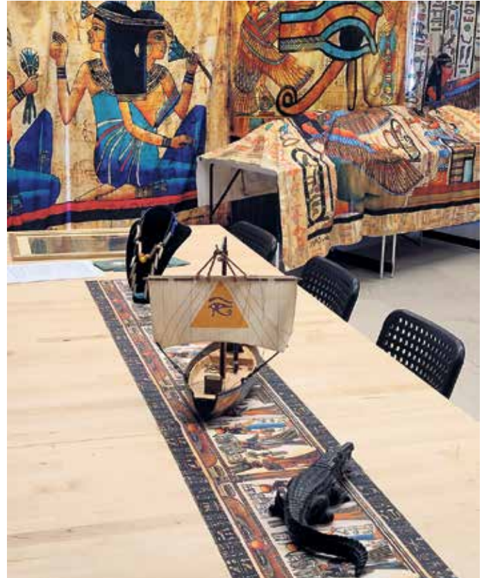
So sieht unser Workshopraum im Museum aus.