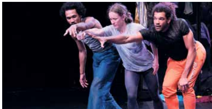
„Mitmachen!“ Tänzerin und Tänzer laden das Publikum in „Silent calling“ ein, aktiv zu werden.

Festival Spielarten NRW ausgewählt. Auch die Tanztheater Produktion „Silent Calling“ steht im Mai in Bonn auf dem Spielplan (28. Mai um 18 Uhr und 29. Mai um 10 & 18 Uhr). In „Silent calling“ (ab 12 J.) schaffen drei Tänzer*innen mit Tanzstilen der Hip-Hop-Kultur und Contact Improvisation Momente, die ganz widersprüchliche Gefühle hervorrufen. Momenten des Verbundenseins folgen Momente der Trennung und Vereinzelung. Das Publikum ist eingeladen, sich aktiv zu beteiligen, sich zu begegnen und wahrzunehmen. Die Musiktheater-Produktion „Der Bär, der nicht da war“ wird am 10. Mai um 15 Uhr sowie am 11. & 12. Mai jeweils um 10 Uhr aufgeführt (ab 4 J.). Es war einmal ein Juckreiz. Der kratzt sich und ist plötzlich: