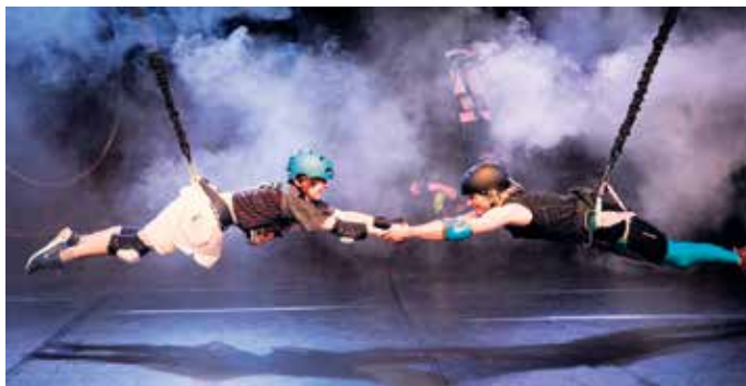
Eine Zerreißprobe ist der Kampf gegen Hass und Gewalt: „Come a little closer!“

Weitere attraktive Aufführungen für junge Menschen