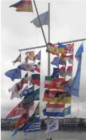
Ideales Wetter für die Beflagung, die sofort fröhlich im kräftigen Wind flatterte.

Der Schifferverein Beuel beflaggte seinen Fahnenmast