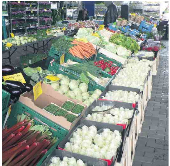
Regionales Gemüse fand seine Abnehmer.