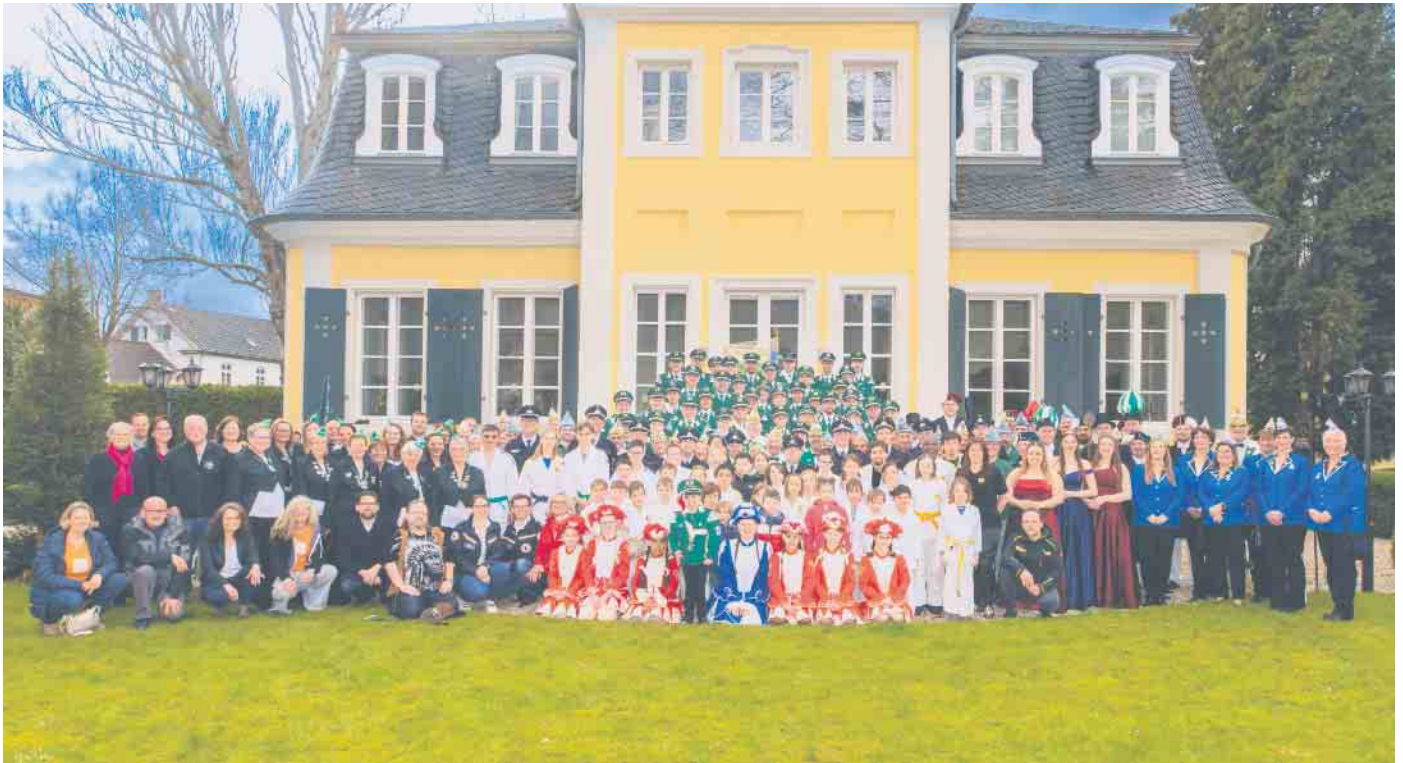
Vertreter und Vertreterinnen der 30 VdO-Mitglieder erstmals gemeinsam vor der Kamera.

Ein ganzes Jahr Vereinspräsentationen in Schaufenstern