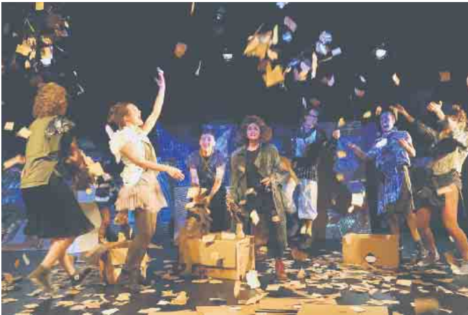
Die Marabu-Inszenierung „Konferenz der Vögel“ wird zur Eröffnung des Festivals aufgeführt.

chester Bonn, Junges Theater Bonn, Theater im Ballsaal, Bühne in der Brotfabrik und Kulturzentrum Brotfabrik. Schon 2013 fand das Festival in Kooperation mit mehreren Bonner Einrichtungen statt. In 2023 wird diese Vernetzung noch weiterentwickelt. Hintergrund ist die im Jahr 2021 entstandene „Bonner Initiative Theater und Musik für Junges Publikum“, in