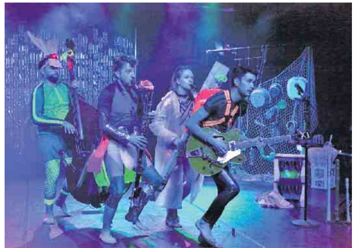
„Splash“, bei viel Musik dreht sich alles ums Wasser.

eine generationsübergreifende Tanz-Theater-Performance. Drei Leben. Drei Alter. Drei Körper. Ein 13-Jähriger, ein 31-Jähriger und ein 64-Jähriger teilen ihre Erfahrungen vom Leben. In ihren Geschichten und Gedanken verhandeln sie Vergangenheit, Gegen-