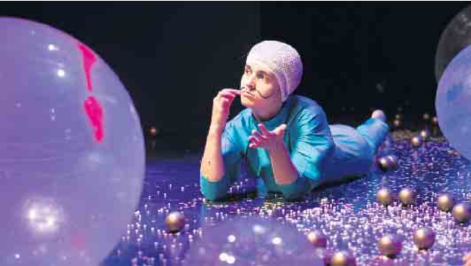
„Der Katze ist es ganz egal“ ist ein Wettbewerbsbeitrag des Theater Münster.

39. Theatertreffen für junges Publikum NRW