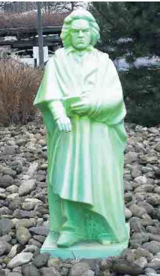
Er ist überall im Stadtbild zu finden: Bonns größter Sohn, Ludwig van Beethoven.

„Einmal mehr hat sich gezeigt, wie populär der Bonner Komponist ist. Das birgt auch Chancen für seine Heimatstadt Bonn, die es noch viel besser zu nutzen gilt.“ wm