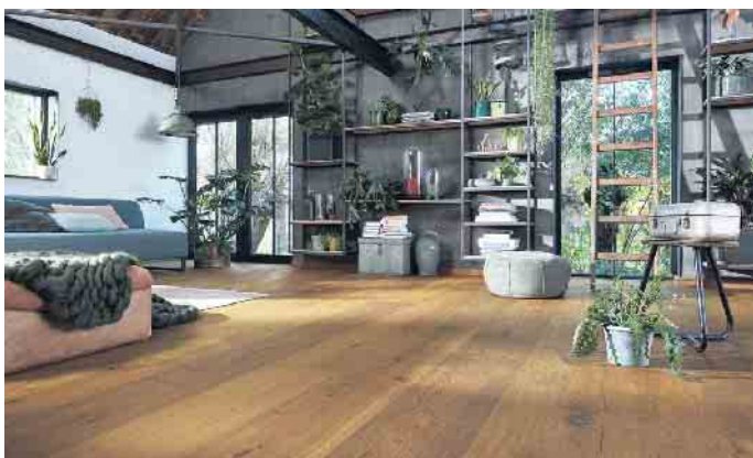
Kleine Kerben oder Dellen können mit speziellen Hartwachsen ausgebessert werden.

wieder zum Einsatz kommt, da Öl nicht auf Lack hält und umgekehrt“, so Schmid. Geölte Oberflächen bieten hier den Vorteil, dass sich diese direkt nach der Reinigung einfach mit einem neuen Ölauftrag wieder auffrischen lassen. Bei lackierten Oberflächen ist die Erneuerung oft deutlich aufwendiger. Bei noch un-