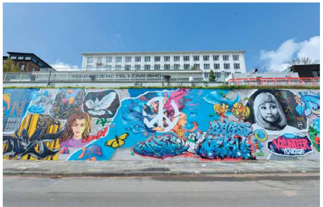
Graffitiwand am Brassertufer 2026 zum Thema 30 Jahre UN-Stadt Bonn.

Der erste Wettbewerb für ein Sommerbild setzte sich 2023 mit dem Thema „Grenze - Rhein - Limes“ auseinander. 2024 nahm der Wettbewerb das Thema „Starke Frauen - Tradition, Vielfalt und Gleichberechtigung in Bonn“ in den Blick. 2025 zeigte das Sommerbild Graffiti zum Thema „Bonn - Stadt - Heimat. Gestern - heute - morgen“.