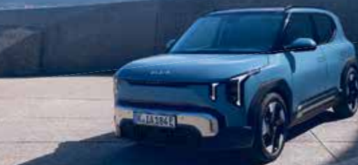
Abbildung zeigt kostenpflichtige Sonderausstattung.

Am 18.4. laden wir Sie herzlich zum Kia EV Day in Siegburg und Königswinter ein. Erleben Sie, wie einfach Elektromobilität heute sein kann. Mit dem neuen Kia EV2 machen wir Elektromobilität für alle erlebbar - kompakt und alltagstauglich. Der Kia EV2 macht Ihnen den Einstieg einfach. Effizient und mit durchdachtem Raumkonzept bietet er alles, was Sie brauchen - bis zu 453 km Reichweite 1 , ein Kofferraumvolumen von bis zu 403 Liter und intuitive Konnektivität. Steig ein. Machen Sie Ihre erste Probefahrt. Wir freuen uns auf Sie.