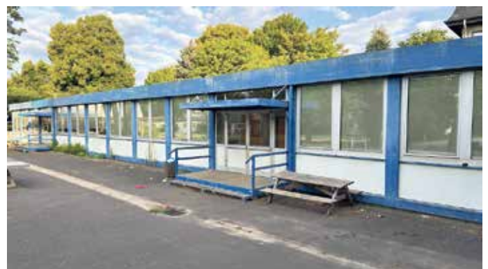
Die Container an der Rölsdorfstraße werden abgerissen.

werdenden Übergangcontainer der Verwaltung. Darüber hinaus wird die Paul-Gerhardt-Schule zur Erfüllung des OGS-Rechtsanspruchs ausgebaut. Die Schule soll daher einen zweigeschossigen Erweiterungsbau (Bruttogrundfläche 960 Quadratmeter) mit zusätzlichen Tages-, Differenzierungs- und Verwaltungsräumen sowie einem ausreichend großen Mensabereich bekommen, der die gesamte Schülerschaft in maximal drei Schichten ermöglicht. Ab Sommer beginnt die Planung des Neubaus. Ein verbindlicher Zeitplan wird im Rahmen der Planung erstellt.