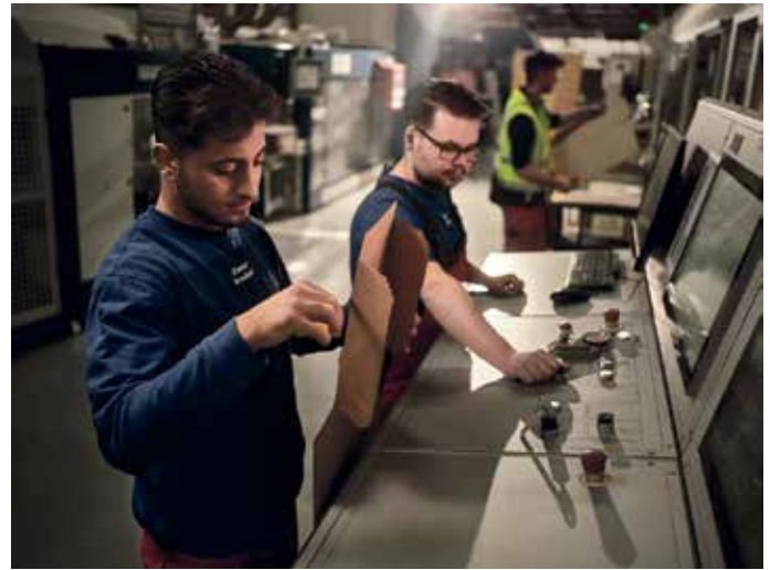
Packmitteltechnolog*innen produzieren innovative Verpackungslösungen.

Ob technisches Know-how, handwerkliches Geschick oder gestalterisches Denken - die Wellpappenindustrie bietet Ausbildungswege für verschiedene Talente und Vorlieben. Packmitteltechnolog*innen produzieren innovative Verpackungslösungen, Industriemechaniker*innen und Elektroniker*innen sorgen für einen reibungslosen Betrieb der Maschinen und Industriekaufleute handhaben die kaufmännischen Prozesse im Hintergrund. Ein Einstieg in die Wellpappenindustrie kann darüber hinaus dank vielfältiger Weiterbildungs- und Spezialisierungsmöglichkeiten langfristig noch andere spannende