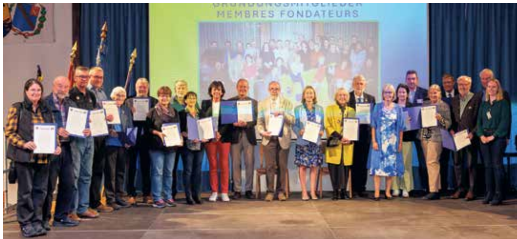
Die Gründungsmitglieder des Beueler Partnerschaftskomitees wurden beim Festakt 2025 ausgezeichnet.

Vor den genannten Beschlüssen erfolgte in Anwesenheit des Bezirksbürgermeisters Marco Rudolph der Bericht über die zahlreichen