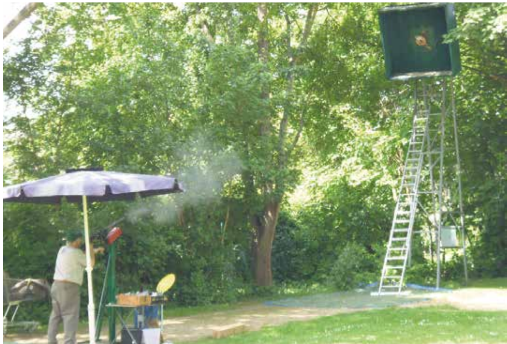
Mit einer uralten Schwerkaliberbüchse wird in Küdinghoven um den Sieg geschossen.

An Christi Himmelfahrt, Donnerstag, 14. Mai, lädt die Bruderschaft alle über 18-Jährigen ab 11 Uhr zum Preisvogelschießen auf den Küdinghovener Dorfplatz an der Kirchstraße ein. Es folgt am Samstag, 16. Mai, an gleicher Stelle das Biwak und Schützenfest. Ab 11 Uhr wird um die Königswürde geschossen, um 13 Uhr startet der Wettbewerb um den Manövermeister. Zu letzterem sind alle Interessierte ab 18 Jahren eingeladen. Der Musikzug der