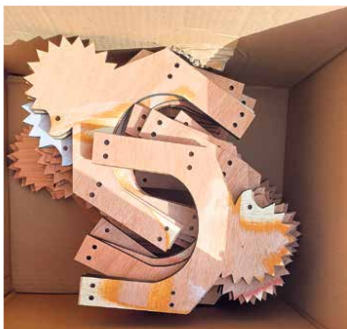
50 derartige Igelorte spendete die Fachhochschule Bonn-Rhein-Sieg der Beueler Igelhilfe.