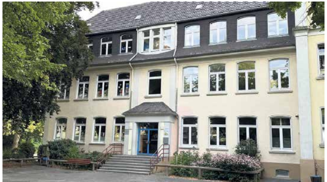
An der Paul-Gerhardt-Schule in Beuel-Zentrum schreiten die Sanierungsarbeiten und die geplanten Ausbauvorhaben voran.

An der Paul-Gerhardt-Schule in Beuel-Mitte schreiten sowohl die Sanierungsarbeiten im bestehenden Gebäude als auch die geplanten Ausbauvorhaben zur Erfüllung des OGS-Rechtsanspruchs voran. Die nach einem Wasserschaden erforderlichen Sanierungsarbeiten im Bestandsgebäude der städtischen Grundschule sind weitestgehend abgeschlossen. Nach den Osterferien kann die Schulgemeinschaft in die wieder hergerichteten Räume zurückkehren. Das Städtische Gebäudemanagement (SGB) wird den Umzug von Verwaltung und Schule während der Osterferien organisieren. Der Umzug der OGS innerhalb der Schule erfolgt in Eigenregie des OGS-Trägers, der Diakonie Bonn. Anschließend können die Container, in der vorübergehend die Verwaltung