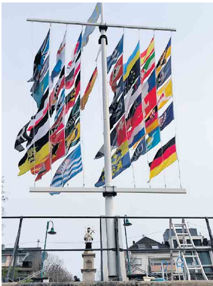
Der Heilige Nepomuk, Schutzpatron der Schiffer, hat die Fahnen und Wimpel stets im Blick.

in Rom auf, um erst in der Osternacht wieder vor Ort zu läuten. Für uns haben die Glocken einen Schleichweg über die Alpen genommen, um ein paar Stunden früher als üblich beim traditionellen Anhissen „bebeiert zu werden.“ Mit einem donnernden „Mit Gott voraus“, dem traditionellen Gruß der Beueler Schiffer, ließ Burgunder mehr als 50 Wimpel, Flaggen und Fahnen zum zwölf Meter hohen Schiffermast hochziehen, darunter auch wieder die Regenbogenfahne sowie die Fahnen Tibets und der Ukraine. Auch in diesem Jahr gab es Neuigkeiten am Mast. Auf Bitte einer niederländischen Mitbürgerin flattern jetzt auch die Königsfahne und die Flagge ihrer brabantischen Heimat im Wind. Zudem grüßen etliche Fahnen großer Rheinanliegerstädte die vorbeifahrenden Schiffe und Spaziergänger. Die ganze Aktion stand zeitweise kurz vor dem Abbruch, denn Sturm und Windböen verhinderten zunächst eine Fortsetzung. Die Besucher nahmen es gelassen hin und kümmerten sich derweil um Speisen und Getränke, die vom Schiffer-Verein kostenlos angeboten wurden. wm