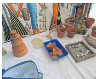
Töpfe in unterschiedlichen Zuständen

Auf einer riesigen Landkarte von Ägypten bereisen wir die wichtigsten Stellen. Die Fahrt geht von Alexandria bis Assuan. Unterwegs erkunden wir die wichtigsten Stationen und basteln an den Stellen schöne Objekte oder suchen interessante Objekte im Sand. Bei unserer Reise lernen wir viel über das antike Ägypten. Ob Pyramiden, römische Kastelle oder den großen Tempel im Theben und erst recht das Tal der Könige werden wir besprechen. Natürlich erkunden wir auch die Hieroglyphen Schrift, erstellen auf originalen Papyrusstreifen ein Leseseichen, bauen ein Königsgrab aus, suchen geheime Zeichen zur Findung eines kleinen Geschenkes und erkunden einen geheimen Gang. Dies ist nur ein kleiner Ausschnitt aus unserem Programm. Termine: 14. April und 28. April, von 14 bis 17 Uhr Mehr dazu: museumziehtum@web.de