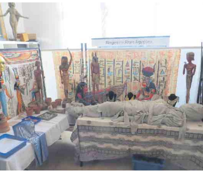
Das fertige Grab der Königin Nofretete aus einem früheren Workshop

Ein ganzes Museum, das Ägyptische Museum der Uni Bonn, zieht um. Es sind nun neun Monate seit der Schließung des Ägyptischen Museums vergangen. Die Sichtung, Inventarisierung und teilweise Restaurierung geht