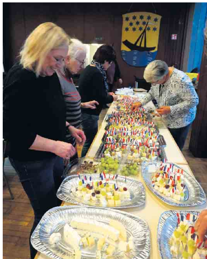
Fleißige Helferinnen bereiten das Buffet vor. Dazu gab es wie immer Rotwein.

bunt und intensiv gelebt wird. Weitere Informationen: www.beuel-mirecourt.eu . wm