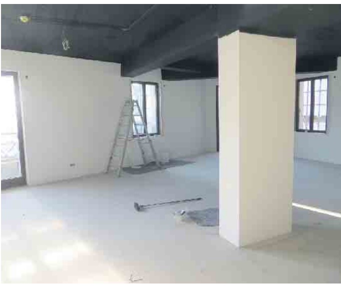
So sieht es auf der Baustelle Poststraße aus

langsam Richtung Zielgerade. Das neue Domizil in der Poststraße (ehemals A&P) sieht schon ganz gut aus. Derzeit ist eine Eröffnung für das 4. Quartal 2024 geplant. Noch können wir vom Förderverein des Museums Workshops am