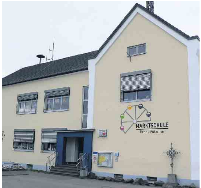
Die Marktschule in Pützchen wird im September zeitweise zur „Kirmesschule“.

Unterrichtszeiten sind am 8. und vom 11. bis 13. September jeweils von 9 bis 12 Uhr. Zusätzlich am 11. und 12. September von 14 bis 16 Uhr. Wenn