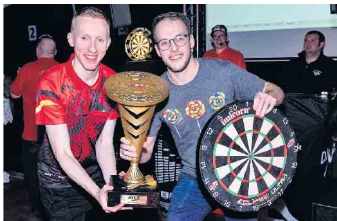
„Die Lutscher“ nehmen den Wanderpokal für ein Jahr mit nach Hause.