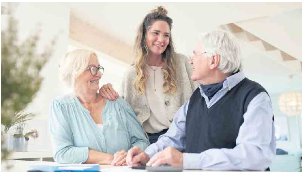
Mit Unterstützung der Eltern ins eigene Traumhaus: Um Kindern die Finanzierung einer Immobilie zu erleichtern, gibt es verschiedene Möglichkeiten.