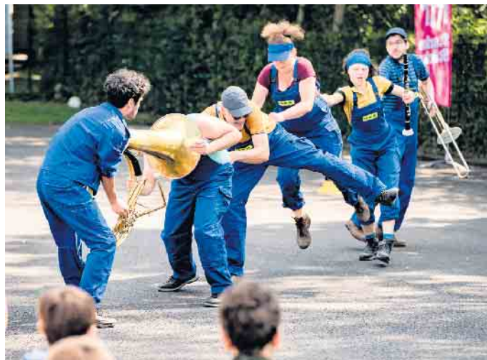
In der Open-Air Produktion „Master of Disaster“ vertreiben absurder Humor und Blechmusik Sorgen und Ängste.

legten Wert darauf, dass die zehn Inszenierungen in ihrer Gesamtheit ein breites Spektrum unterschiedlichster ästhetischer Zugänge abbilden. Das Auswahlgremium begründete sein Votum für das Theater Marabu wie folgt: „Mit der Open-Air Produktion erweisen sich die Spielenden des Marabu Ensembles als „Masters of Disaster“, in dem sie selbiges gekonnt heraufbeschwören und gleichzeitig mit Hilfe des jungen Publikums, die damit verbundenen Ängste und Sorgen angstfrei und gefahrlos, aber trotzdem sehr auf- und anregend sichtbar machen und bei ihrer Bewältigung helfen. Ein „Straßenunterhaltungsdienst“ der allerbesten Sorte, der den Weg bzw. den Blick frei macht auf Verwerfungen der Corona-Krise gerade auch für Kinder und Jugendliche, der auch durchaus kritisch Maßnahmen und Verhältnismäßigkeiten hinter-