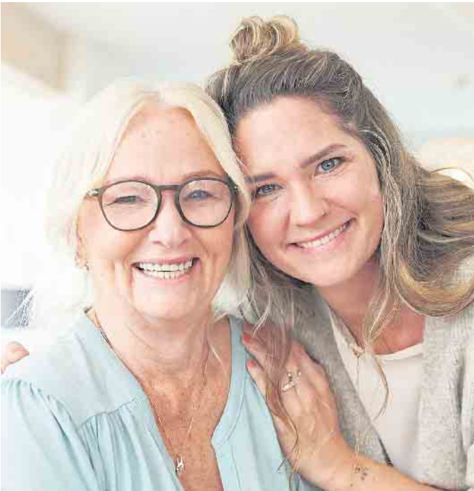
Das Elternhaus als Sicherheit kann eine Immobilienfinanzierung erheblich vereinfachen.