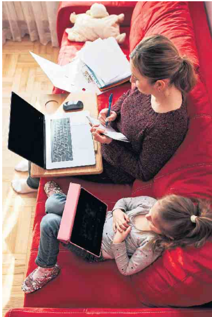
Mobiles Arbeiten kann bequem, aber gleichzeitig auch belastend sein.