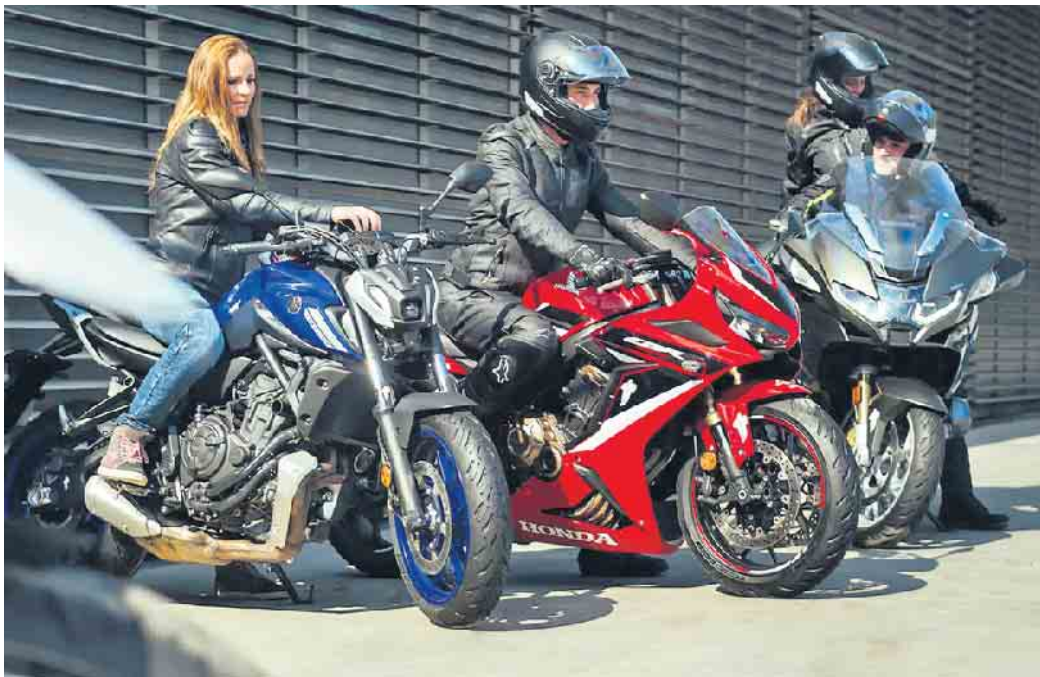
Die Freiheit auf zwei Rädern genießen - hochwertige und gut gepflegte Reifen sorgen dabei für ein sicheres Vergnügen.

Für Biker gibt es kaum Schöneres als eine Tagestour mit Freunden, bei der man besondere Augenblicke teilt. Gute Reifen verbinden dabei Fahrspaß mit Sicherheit und Komfort. Allgemein dürfen Reifen