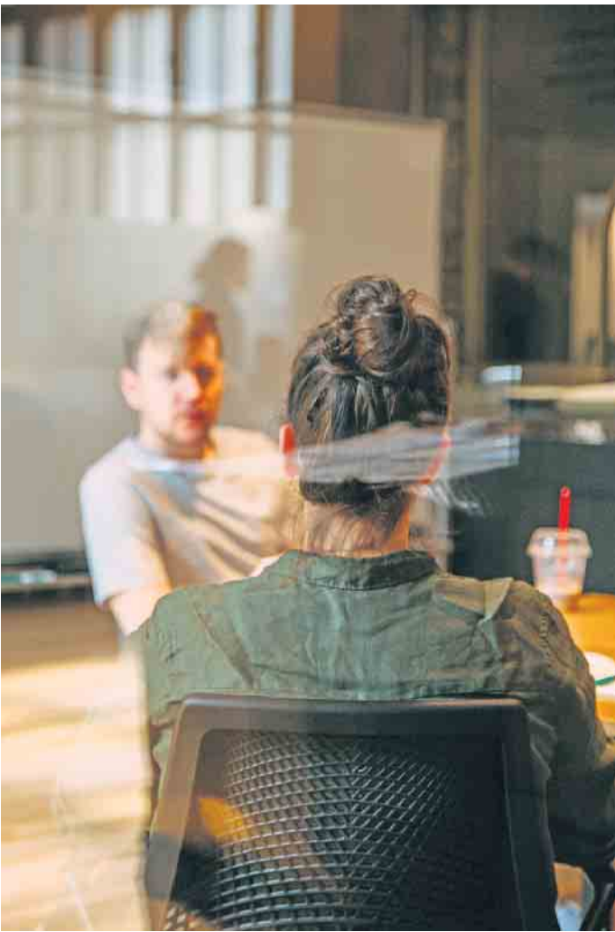
Dialog statt Monolog: Bei Vorstellungsgesprächen sollten auch Bewerber aktiv Fragen stellen.

So können Bewerber im Vorstellungsgespräch punkten