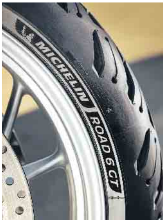
Hochwertige Motorradreifen verbinden eine hohe Laufleistung, Komfort, Handling sowie einen sehr guten Nassgrip miteinander.

Darauf sollten Motorradfahrer bei der Pflege der Bikebereifung achten