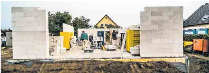
Auf dem Weg ins Wohneigentum stoßen immobilieninteressierte Verbraucher auf hohe Hürden, wie ein aktuelles „Bauherren-Barometer“ zeigt.

für Familien mit durchschnittlichem Einkommen erreichbar bleibt. Bauherren, die auf der Suche nach einem gangbaren Weg ins Wohneigentum sind, finden auf der Website des Vereins unter www.bsb-ev.de eine Vielzahl von Hintergrundinfos zum Bauen und Kaufen. Sie können sich zudem unabhängig bei der Planung und Umsetzung ihrer Immobilienpläne beraten lassen. (djd)