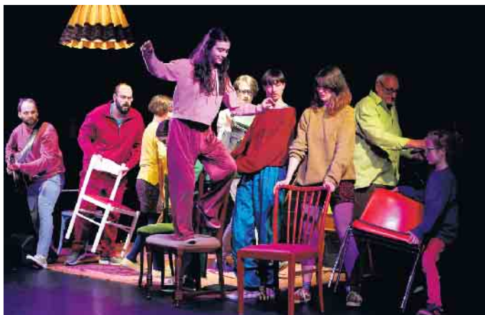
„ZusammenRaufen“, gelingt das? Die Antwort gibt es im Theater Marabu.