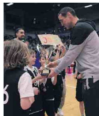
Der Siegerpokal für die Josefschule.