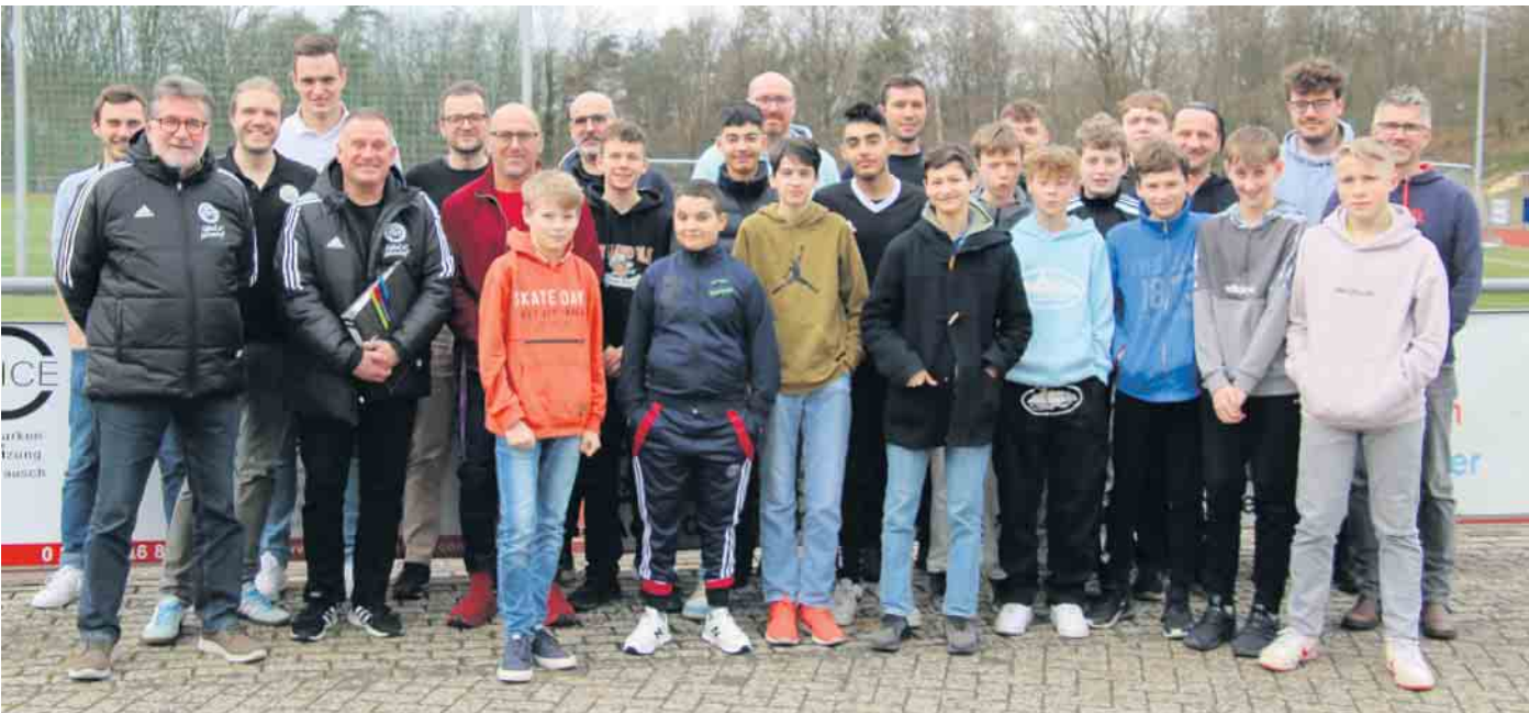
Die 24 neuen Schiedsrichter bei ihrer Prüfung auf dem Platz der SF Ägidienberg.