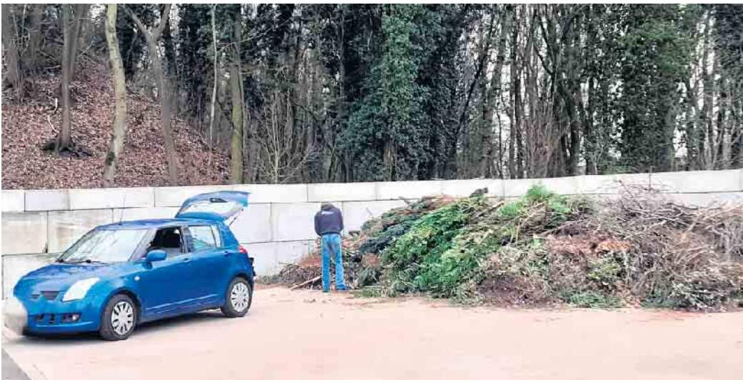
Ein moderne Abgabestelle für Grüngut, Glas, Papier und kleine Elektrogeräte entstand an der Broichstraße.

Seit dem 1. März können die Bonner*innen die erste rechtsrheinisch errichtete qualifizierte Grünannahmestelle (GAS) nutzen. In Beuel wurde an der Broichstraße eine befestigte Fläche geschaffen, die den Bürger*innen nun die bequeme Entsorgung ihres Grünguts ermöglicht. Diese GAS ersetzt die stationäre Sammelstelle auf dem Friedhof Pützchen. Nach dem bewährten System, das bereits in Mehlem und Ückesdorf erfolgreich Anwendung findet, öffnet nun die dritte qualifizierte Grünannahmestelle (GAS) Bonns ihre Tore im Gewerbegebiet Beuel in der Broichstraße 113. Auf dem Gelände wurde mit Hilfe von sogenannten Legiosteinen eine Schüttbox errichtet sowie moderne Unterflurbehälter für Altpapier und Altglas an der Seite des eingezäunten Geländes installiert. Bürger*innen können in der Schüttbox ihr loses oder mit verrottbaren Schnüren gebündeltes Grüngut einfach und barrierearm ablegen. Auch die Abgabe von kleinen Elektrogeräten ist möglich. Mit der Eröffnung der neuen