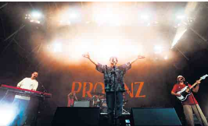
„Provinz“ ist der Headliner beim Green Juice Festival 2024.

Hohe Erwartungen bei Veranstaltern und Fans