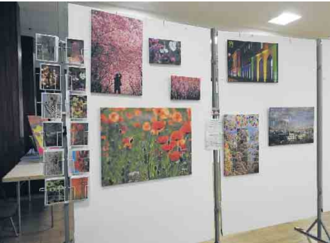
Ausstellung Rathaus Beuel 2018

Hobby Künstlerinnen und Künstler können sich anmelden