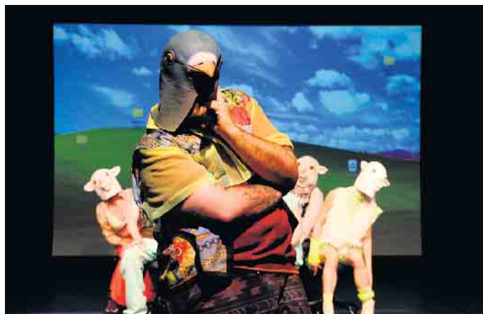
Auf der Suche nach dem Ich ist das Junge Ensemble.

In den nächsten Tagen bringt das Theater Marabu aktuelle Inszenierungen auf die Bühne in der Beueler Kreuzstraße 16. Zudem findet das Theaterlabor statt, eine