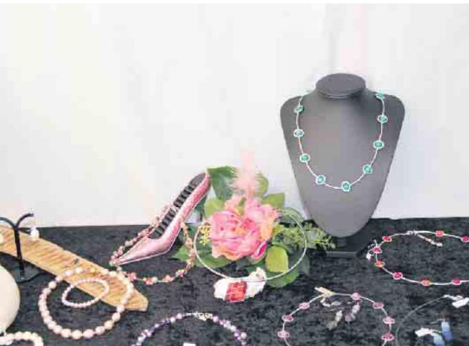
Ausstellung Rathaus Beuel 2018

Nach langer Zeit, findet vom 19. bis 21. April, eine Ausstellung im Rathaus Beuel statt. Die Ausstellung gibt Kunstschaffenden aus Beuel und der Partnerstadt Mirecourt die Möglichkeit, Ihre Werke gemeinsam einem größeren Publikum vorzustellen. Interessierte Hobby-Künstlerinnen und Künstler die an der Ausstellung teilnehmen möchten, können sich bei der Bezirksverwaltungsstelle Beuel unter der Rufnummer: 0228-77 49 02 oder unter Bezvst.Beuel@bonn.de , bis spätestens 19. März anmelden. Voraussetzung für die Teilnahme ist ein Wohnsitz in Beuel. Weitere Informationen werden nach Anmeldung mitgeteilt.