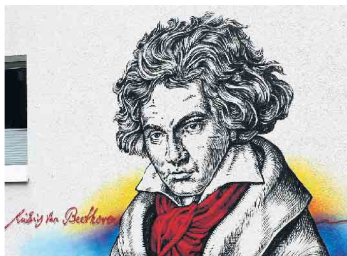
In Bonn findet man Beethoven überall! Hier am Wohnhaus der Familie Pütz.

Der Vereinsvorsitzende Stephan Eisel teilte mit: „Nach dem großen Erfolg im letzten Jahr laden wir auch 2024 zu einer großen Feier für Beethoven ein. Das ist unser bürger-schaftlicher Beitrag dazu, dass sich Bonn nachhaltig zur Beethovenstadt weiterentwickelt und das Beethoven-Jubiläum 2020 kein einmaliges Feuerwerk bleibt.“ wm