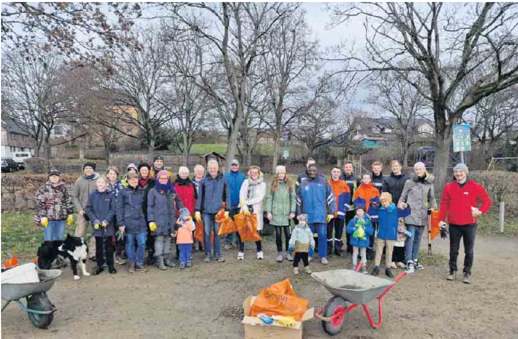
Gruppenfoto der Helfer 2023

Traditionell am Samstag nach Rosenmontag lädt der Bürgerverein Geislar e.V. wieder zum Frühjahrsputz ein. Alle Geislarer, ob groß oder klein, sind dazu aufgerufen, sich am Geislarer Frühjahrsputz am Samstag, den 17. Februar von 10 bis 12 Uhr zu beteiligen. Treffpunkt ist auf dem Dorfplatz. Anschließend werden sich kleinere Gruppen im Ort verteilen um „Schmutzecken“ von Müll und Unrat zu befreien. Müllsäcke und Handschuhe werden von BonnOrange über die Aktion picobello bereitgestellt. Wer mag, kann zusätzlich gerne Schubkarre und andere Gerätschaften von zu Hause mitbringen. Nach der Sammelaktion werden sich alle fleißigen Helfer wieder zu einem kleinen Imbiss auf dem Dorfplatz treffen um die Aktion gemütlich ausklingen zu lassen. Der Bürgerverein freut sich auf einen schönen Aktionstag und eine rege Teilnahme! Bei Fragen oder Anregungen kann man sich im Vorfeld per Mail an info@buergerverein-geislar.de wenden. Weitere Infos finden Sie zudem auf der Webseite vom Bürgerverein: https://buergerverein-geislar.de/