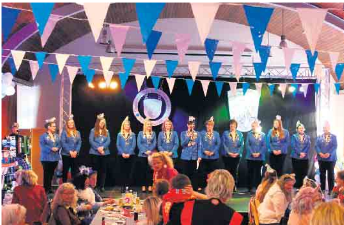
Die aktiven Mitglieder des DK Nixen vom Märchensee 1946 e.V