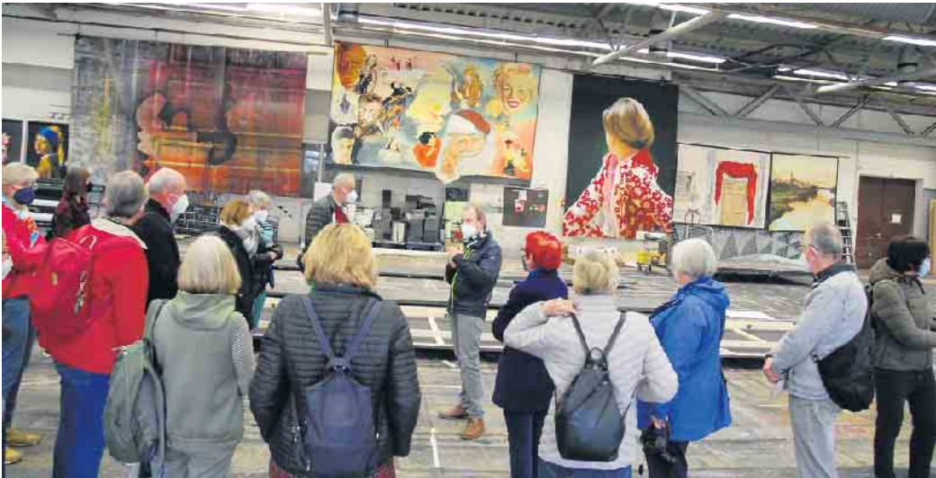
Impressionen des Theaterspaziergangs 2022

Er ist schon etwas ganz Besonderes, der Theaterspaziergang der Theatergemeinde BONN - in diesem Jahr zwei Tage vor dem Welttheatertag am Montag, dem 25. März: Wir besuchen an diesem Tag mehr als ein Dutzend Spielstätten, blicken hinter die Kulissen und Vorhänge von großen und kleinen Bühnen, erleben Treffen mit Verantwortlichen der Bonner Theater und mindestens zwölf Stunden lang beste Unterhaltung und Information. Das gibt es wirklich nur einmal pro Jahr und nur bei der Theatergemeinde. Auch wenn es - trotz Sonderbus - ein wenig anstrengend ist: Kaffeepausen und Mittagsimbiss in verschiedenen Theatern sowie die vielen Eindrücke lassen den Tag im Fluge vergehen. Und bei Ihren nächsten Theaterbesuchen werden Sie manches mit anderen Augen sehen.... In diesem Jahr ist eine Station neu mit dabei: wir besuchen erstmals die „Zentrifuge“, Konzertsaal und neue Heimat des „Bon(n)Raum Theaters“. Bitte beachten Sie: Es gibt unterwegs mehrere steile Treppen. Für Personen mit eingeschränkter Bewegungsfähigkeit ist die Veranstaltung nicht geeignet. Termin: Montag, 25. März von 9 bis ca. 21.30 Uhr. Der Unkostenbeitrag beträgt für Mitglieder 79 Euro, für Gäste 85 Euro (inkl. Busfahrt, Führungen, Mittagsimbiss,