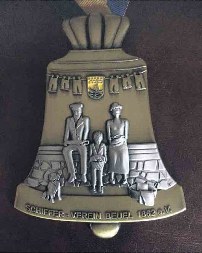
Die „Botze“ flattern über der Beueler Familie, die beruflich für Beuel wichtigen Gewerben nachging.