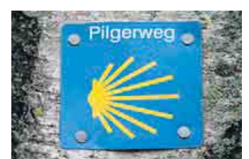
Jakobswege im Rheinland

reff“ mit Austausch und spirituellen Anregungen. Die heimischen Wege an Rhein, Lahn und Mosel eignen sich hervorragend, um das „Wandern mit Beten“ zu erproben. Immer der Muschel nach. Donnerstag, 22. Februar, 19.30 Uhr, Evangelisches Gemeindehaus, Neustr. 4, 53225 Bonn