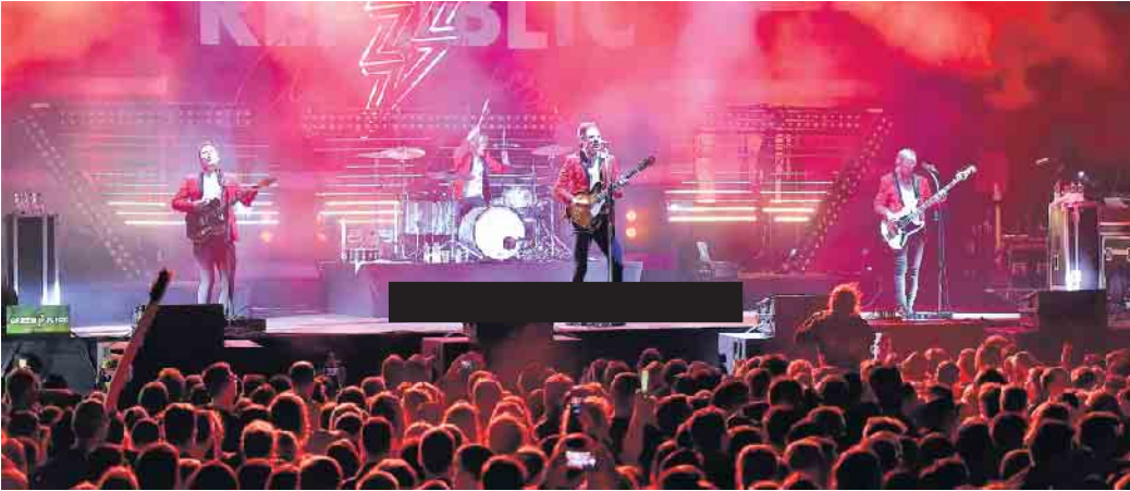
Das Festival im Neu-Vilicher Park begeistert jedes Jahr viele junge Menschen.

Das gilt auch für die Jungs von „Kaffkiez“ - ein Indiemärchen aus dem Süden Deutschlands. Aktuell begeistert die Band Besucher*innen mit der unpolierten Ehrlichkeit ihrer Texte und der unmittelbar spürbaren Energie ihres Songwritings. Das verspricht auch für ihren Auftritt beim Green Juice im kommenden Festivalsommer: Treibende Rhythmen, ver-