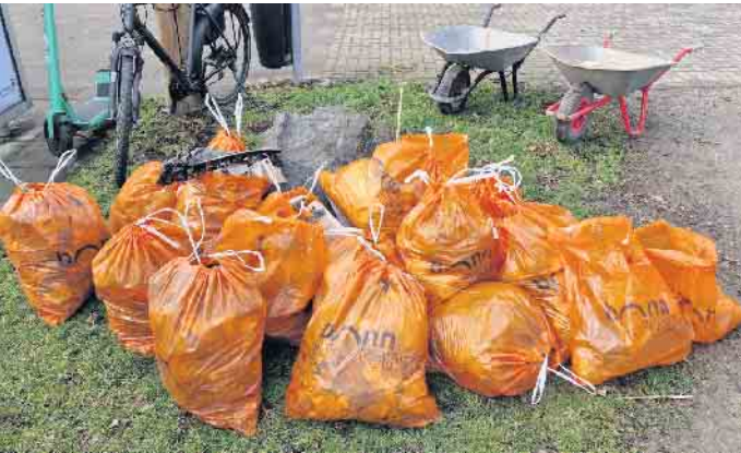
Ein kleiner Teil der „Ausbeute“ 2023