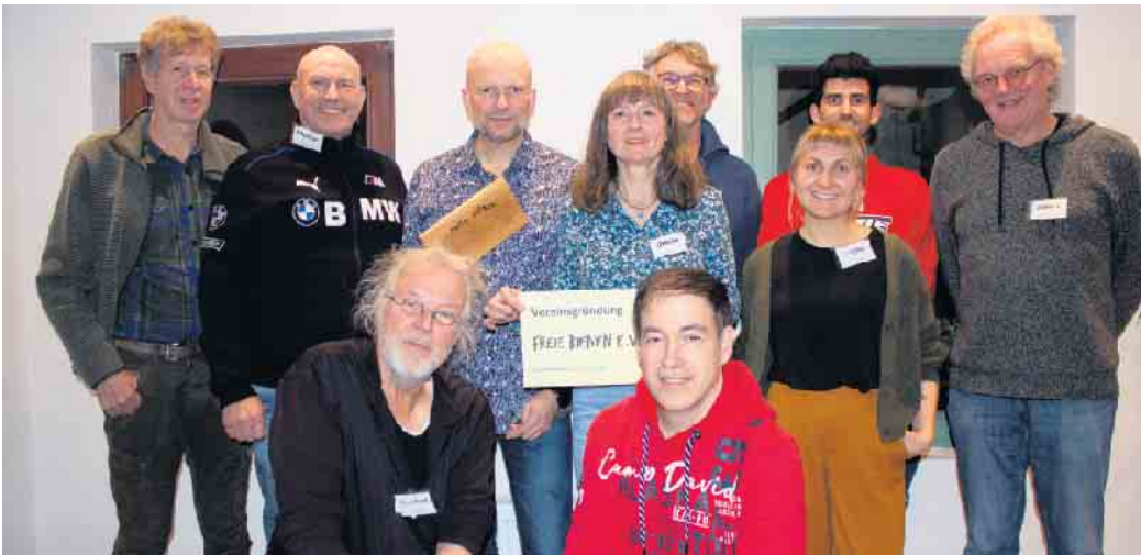
Gründungsmittglieder des Vereins „Freie Bienen e.V.“

Hier setzt die Arbeit des Vereins an, der sich für eine nachhaltig behandlungsfreie Imkerei einsetzt, in der die Honigbienen „ler-