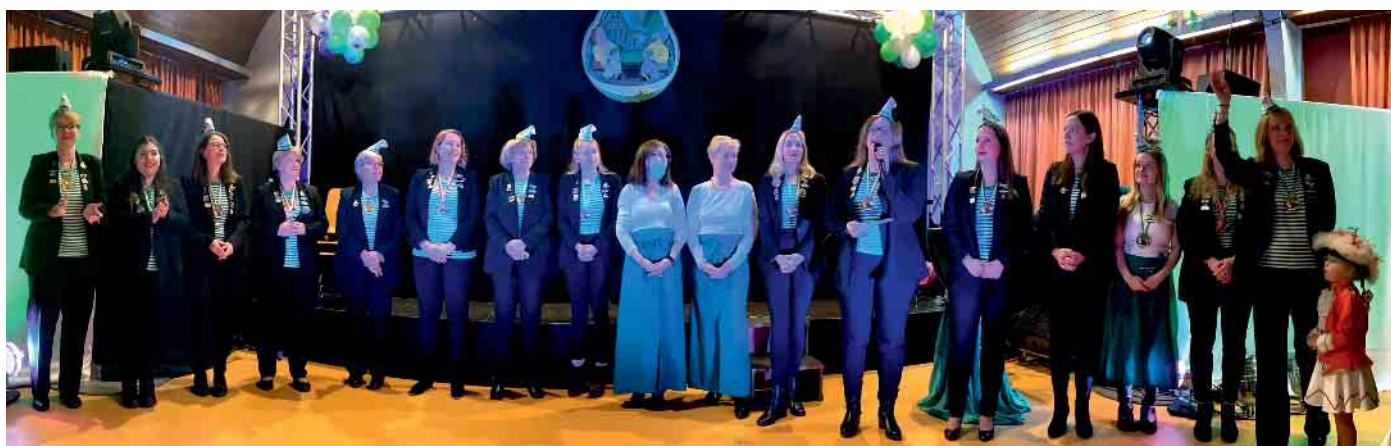
Das Damenkomitee Grün-Weiß Ramersdorf stellte sich im Oberkasseler Pfarrheim vor.

In den Beueler Ortsteilen feierten die Frauen