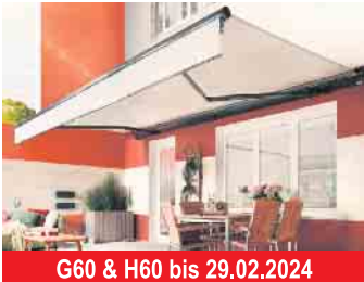
G60 & H60 bis 29.02.2024