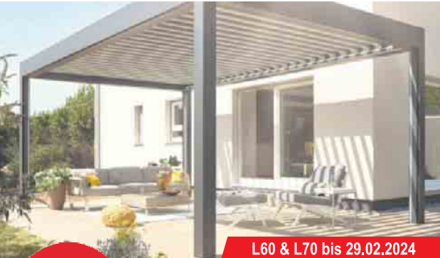
L60 & L70 bis 29.02.2024

E.U.R.E. Markisen-und Rollladen Center e. K. Im Mühlenbruch 10 53639 Königswinter Tel. 0 22 23 / 70 08 74 info@eure-center.de www.eure-center.de