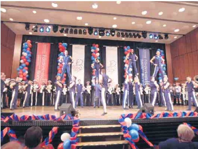
Die StadtGarde Colonia Ahoj war bereits mehrfach beim „Hätz“ zu Gast.

für krebskranke Kinder und Jugendliche Bonn e. V. erneut einen fünfstelligen Betrag übergeben: 22.000 Euro für den guten Zweck. Reiner Fritz sagt dazu: „Mit dieser Spendensumme können wir weiterhin Familien und Kinder, die vom Krebs betroffen sind, im Familienhaus und der Uni-Kinderklinik auf dem Bonner Venusberg unterstützen und ihre Lebensqualität verbessern!“ Damit stieg die Gesamtspendensumme der zehn Veranstaltungen auf 169.000 Euro. Die elfte Auflage von „Dat Bönnsche Hätz“ findet am 11. Januar 2025 wieder im Beueler Brückenforum statt. wm