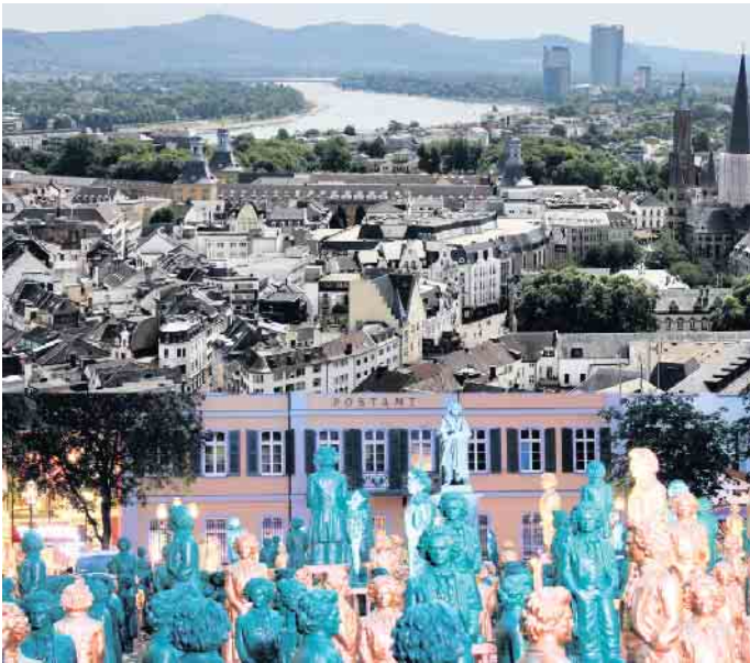
Viele Infos und Fotos über Beethovens Geburtsstadt finden Sie in der Broschüre, hier Rhein, Innenstadt und Münsterplatz.

brand 1777. Behandelt werden auch Beethovens Lehrer und Freunde in Bonn. Dazu kommt ein eigenes Kapitel, das dem Beethoven-Rundgang in Bonn und dem Rhein-Sieg-Kreis gewidmet ist und dessen Stationen beschreibt. Die kurzweilig geschriebenen Texte werden um zahlreiche, vor allem historische Bilder ergänzt. Das Heft bieten die Bürger für Beethoven auch Bonner Hoteliers und Tourismus-Institutionen an. Interessierte Bürger können zwei Exemplare der Publikation kostenfrei anfordern, an Institutionen und Betriebe werden bis zu 50 Exemplare kostenfrei abgegeben. Angefordert werden kann das Heft unter Angabe der Postadresse mit einer Mail an webmaster@buerger-fuer-beethoven.de . wm