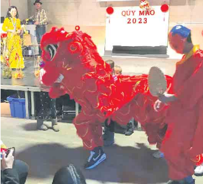
Bühne frei! Der Löwe wird zum Tanz erwartet.

Januar das Jahr der Katze. Bereits zum vierten Mal lud der Bürgerverein Vilich-Müldorf zum Tet-Fest in die Mühlenbachhalle ein. Nach Corona und der rechtzeitigen Freigabe der sanierten Halle, konnten die in Bonn lebenden vietnamesischen Bürger*innen endlich wieder in größerem Rahmen ihr Fest feiern. Auch dieses Jahr stand der Löwentanz (múa lân) im Mittelpunkt des Jahresbeginns, denn der Löwe verspricht allen Menschen Glück für das neue Jahr. Zudem wurden die