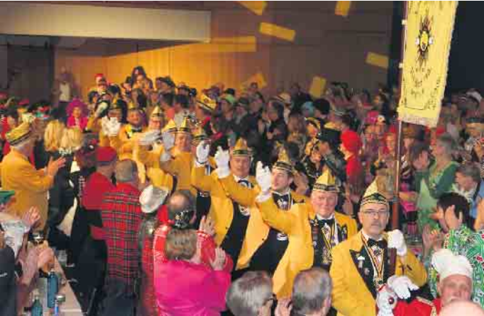
Die Senatoren der Schwarz-Gelbe-Jonge zogen mit einer neuen Standarte ins Brückenforum ein.

Die Galasitzung im Brückenforum übertraf alle Erwartungen