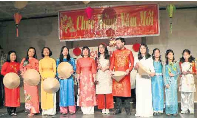
Fröhliche vietnamesische Tänze und farbenfrohe Nationaltrachten gab es in der Mühlenbachhalle zu sehen.

Vietnamesisches Neujahrsfest in der Mühlenbachhalle