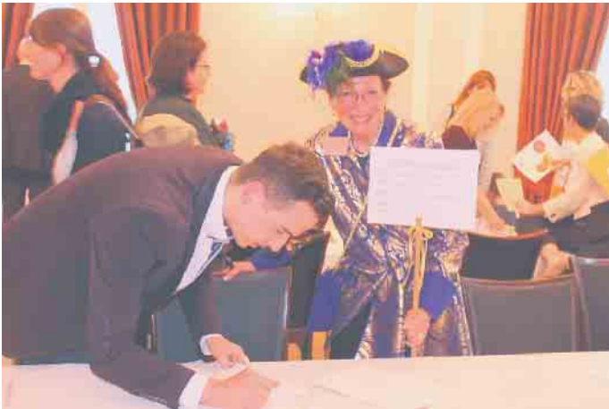
Marktplatz Gute Geschäfte Vertragsunterschrift

fürstliche Trachten gekleidet hatten, suchten Unterstützung beim Druck von Flyern und Postkarten sowie Hilfe bei der Kirchenreinigung. Ihre Gegenleistung waren Führungen durch Namen-Jesu-Kirche und die Stadt Bonn. Die geschlossenen Verträge werden stets