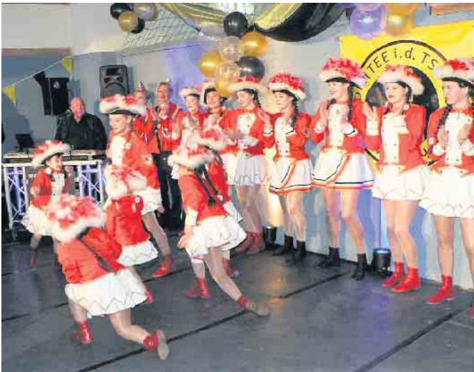
In Schwarzhemdorf tanzten sich die Jüngsten der LiKüRa-Ehrengarde in die Herzen der Närrinnen.