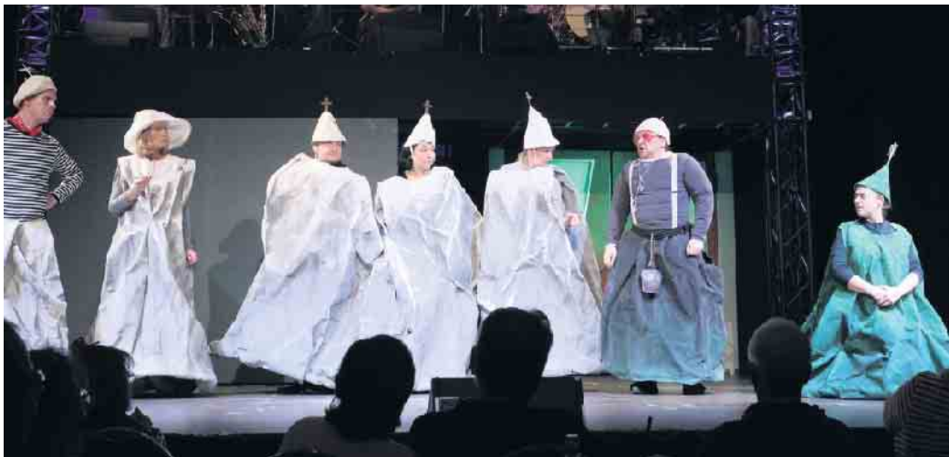
Gipfeltreffen zum Klimaschutz. Ergebnis unbekannt, erfahrungsgemäß gibt es keins.