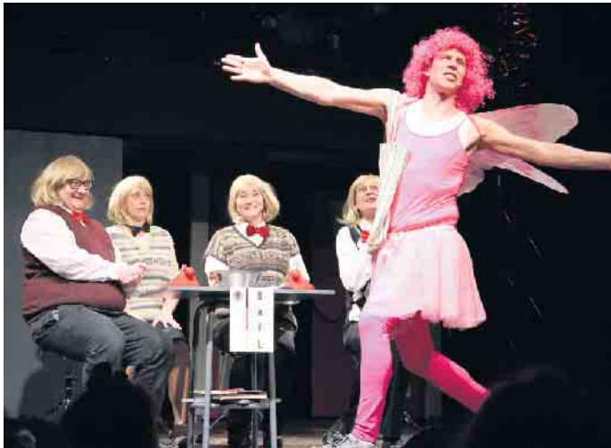
Überschwengliche Freude beim Hauptgewinn des Losverfahrens zur Wehrpflicht.