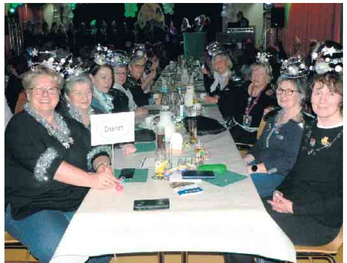
„Jecke Wiever“ aus allen LiKüRa-Orten haben Durst.