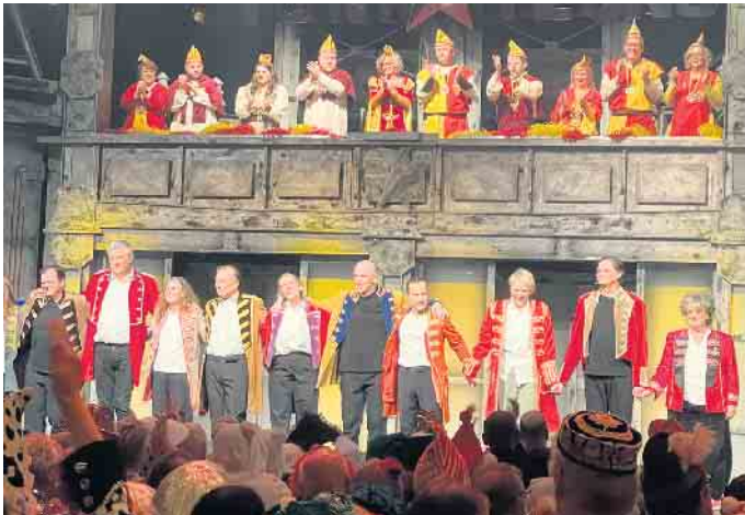
Der Elferrat mit dem Ensemble der Stunksitzung

Nach dem mehrstündigen Programm waren alle Beteiligten beim Ausklang im Foyer beeindruckt, überwältigt und den beiden Initiatoren gegenüber sehr dankbar für die Idee und diese Gelegenheit.