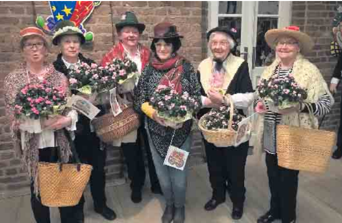
Pützchens Schützenfrauen wissen zu feiern. Foto aus einer früheren Veranstaltung: wm

Pützchen. Was vor 67 Jahren als karnevalistischer Frauenkaffee begann, ist schon seit vielen Jahren ein Karnevalsklassiker, der seinen festen Platz im Beueler Veranstaltungskalender hat. Am 7. Feb-