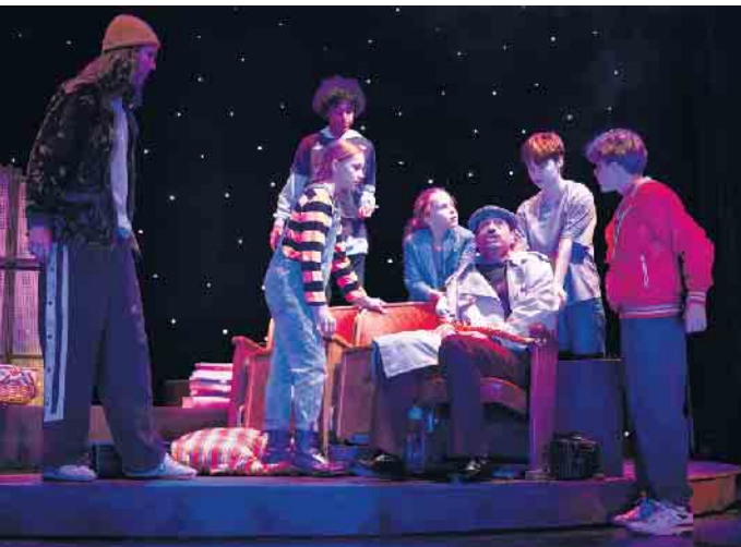
„Herr der Diebe“ im JTB

Die nächsten Vorstellungen von ‚Herr der Diebe‘ finden am Freitag, 20. Februar, um 18:30 Uhr und am Samstag, 21. Februar, um 15 Uhr im Jungen Theater Bonn statt. Weitere Informationen sowie Spieltermine und Stücke finden Sie unter www.jt-bonn.de .