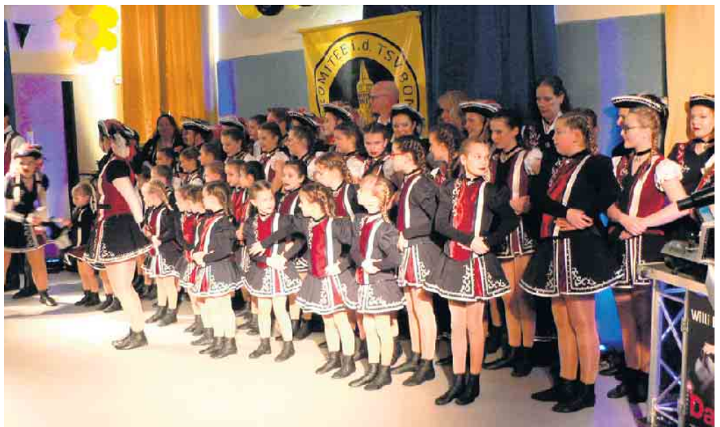
Die Kids der Stadtgarde Schwarz Rot Hennef wurden auch dieses Jahr wieder begeistert gefeiert.