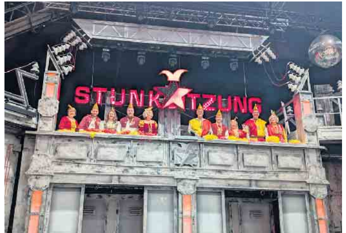
Der Elferrat vor der Sitzung