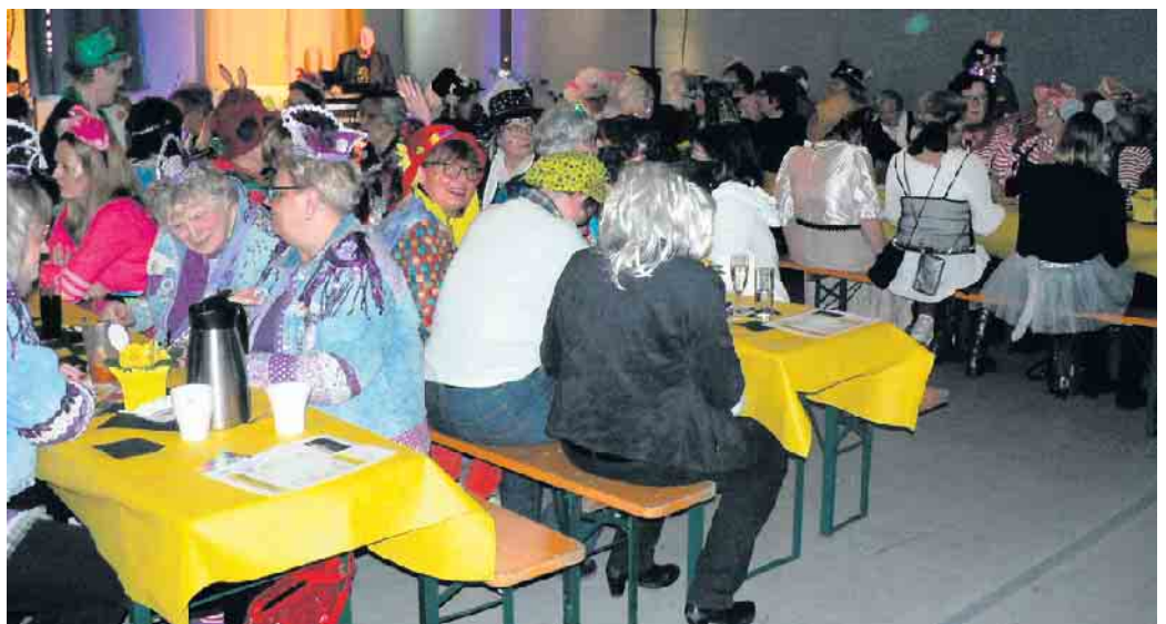
Volles Haus und megatolle Stimmung beim DK i. d. TSV Bonn rrh.