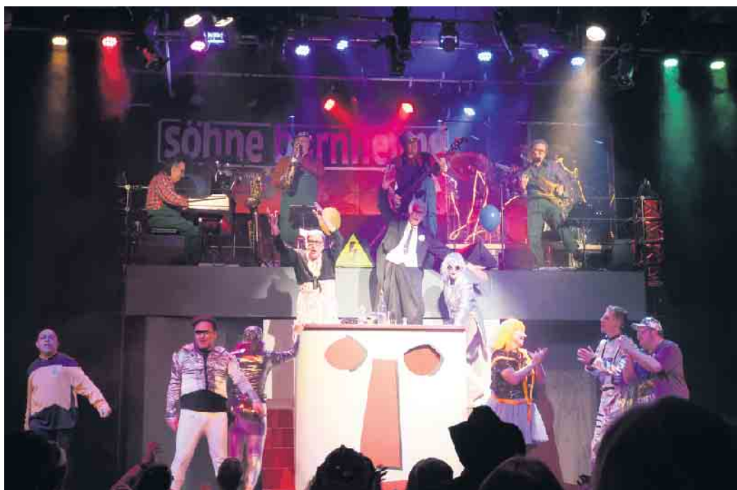
Völlig losgelöst: Das gesamte Pink Punk Pantheon-Team.

Von den Konflikt- und Klimaherden der Welt, von Potentaten wie Trump und Putin bis zu den nicht