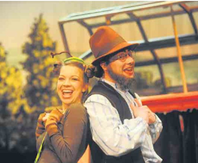
Pettersson und Findus

Weitere Informationen zu den Stücken sowie die entsprechenden Termine finden Sie unter www.jt-bonn.de .