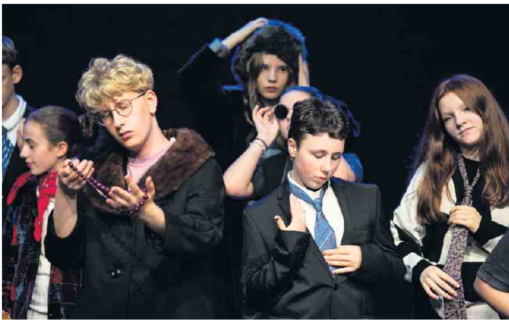
Probenfoto von „Be rich or die trying“. Premiere im Theater Marabu am 15. Februar.

Am 15. Februar, um 19 Uhr, wird im Theater Marabu, Kreuzstraße 16, die Stückentwicklung „Be rich or die trying“ (werde reich oder sterbe bei dem Versuch) uraufgeführt (ab 13 Jahren). Dabei dreht sich alles um das Thema Geld. Sechzehn Performer*innen zwischen 13 und 17 Jahren sprechen, worüber sonst nicht gesprochen wird: Geld! Welche Rolle spielt es im eigenen Leben, welche Erwartungen, Versprechungen, aber auch Verletzungen löst es aus. Das Team Ensemble Marabu lädt zur ersten Start-Up-Pitch-Party ein, denn man braucht das Geld der Gäste, um damit Geld zu machen. „Wir haben ein Date - lasst uns 60 Minuten zusammen protzen, verschwenden und feiern! Ganz ohne Schamgefühle! Oder?“. Weitere Aufführungen gibt es am 16. Februar, 18 Uhr,