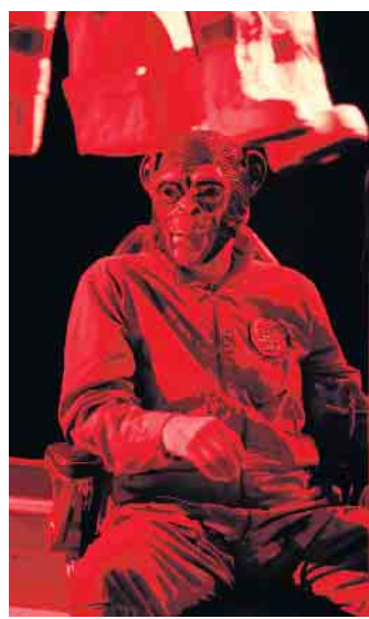
Die Crew von „Mission Laika“ ist immer noch im Weltall auf der Suche nach der der Hündin Laika.

Außerdem findet am 18. Februar, von 9.30 bis 15.30 Uhr, wieder ein Theaterlabor in der Fortbildungsreihe für Lehrer*innen und Erzieher*innen statt, diesmal mit der Kostüm- und Bühnenbildnerin Katrin Lehmacher mit dem Schwerpunkt Ausstattung. Anmeldung bitte bis zum 10. Februar bei theaterpaedagogik@theater-marabu.de . wm