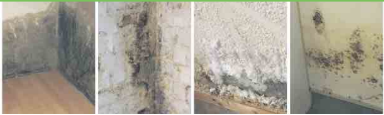
Defekte Horizontalsperre Querdurchfeuchtung Ausblühungen Schimmelbefall

Durch Feuchtigkeit in den Wänden entstehen Schimmel, Ausblühungen und Abplatzungen durch Salze; die Bausubstanz wird angegriffen. Besteht das Problem schon länger und bleibt unbehandelt, wird die Wohnqualität eingeschränkt. Der Wert der Immobilie wird dadurch nachhaltig gemindert. Ob Eigenheimbesitzer, Architekt oder Hausverwaltung, die Firma RH WANDTROCKNUNG ist als Fachbetrieb der BKM MANNESMANN AG Ihr schneller und zuverlässiger Ansprechpartner vor Ort. Als Experten für Gebäudetrockenlegung und Sanierung beseitigen wir Feuchtigkeit und kümmern uns um Bauwerkstrockenlegung!