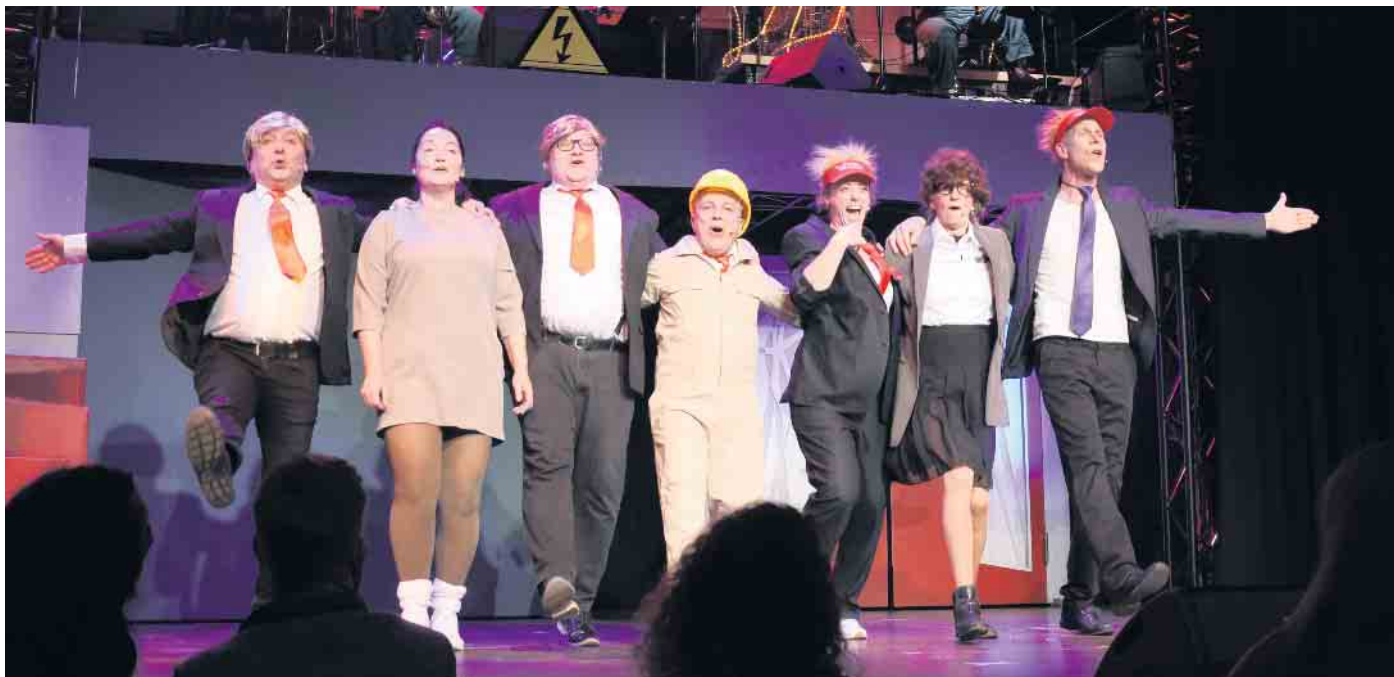
US-Präsident Trump kam in einem kleinen Musicalbeitrag nicht ungeschoren davon.

Ovationen für das Team der Kultveranstaltung