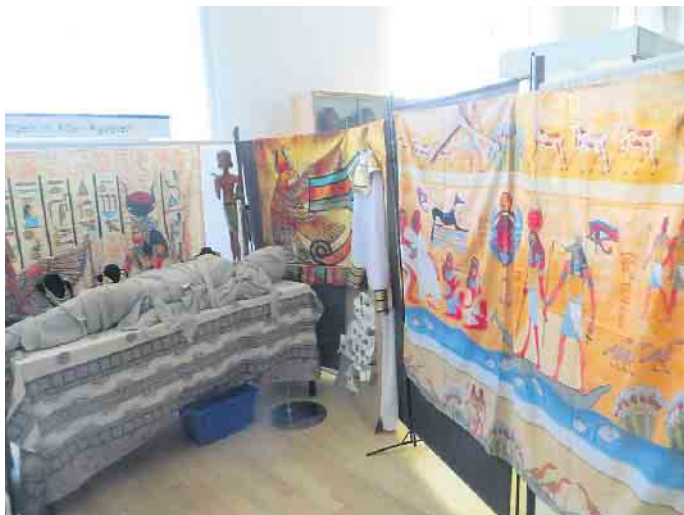
Das erwartet die Teilnehmer der Workshops

Auch im Februar finden Workshops im Ägyptischen Museum statt