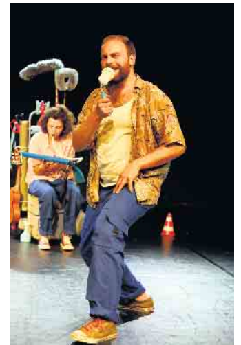
Keine BlauPause, einfach nur Spaß und Vergnügen bei der Arbeit.

„Genau so, nur anders“. Wer bin ich und wer bist du? Was unterscheidet uns voneinander und macht uns anders? Ein Tänzer und eine Schauspieler*in treffen aufeinander, um im spielerischen Wettstreit um die bessere Performance, zu versuchen die Grenzen gesellschaftlicher Zuschreibungen und Erwartungen zu überwinden und neue Möglichkeitsräume für sich und die Zuschauenden zu entdecken. Das Publikum sitzt mit auf der Bühne und