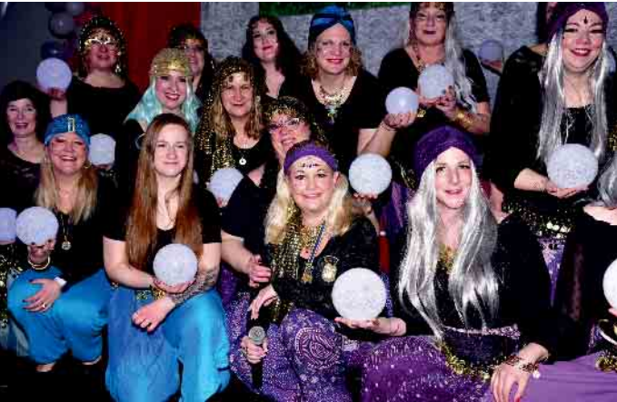
„Fidele Reisetanten“: Sagen die Kugeln die Zukunft voraus?

Buntes Programm mit vielen Höhepunkten im Pfarrzentrum Pützchen