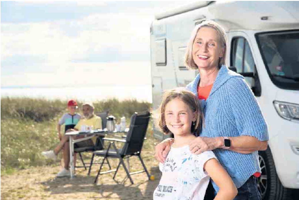
Campingurlaub ist in allen Generationen angesagt. Bevor es losgeht, sollte allerdings der Versicherungsschutz für das Wohnmobil überprüft werden.

Mit einer Teilkasko ist das Wohnmobil gegen Brandschäden abgesichert. „Die Versicherung zahlt