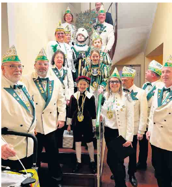
Immer unterwegs! Mit dem Kinderdreigestirn geht es zum nächsten Auftritt.