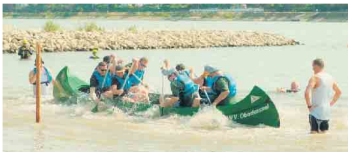
Spaß hat es gemacht, aber für die Karnevalisten erfolglos, das Wett paddeln beim Oberkasseler Wassersportverein. Foto: pr