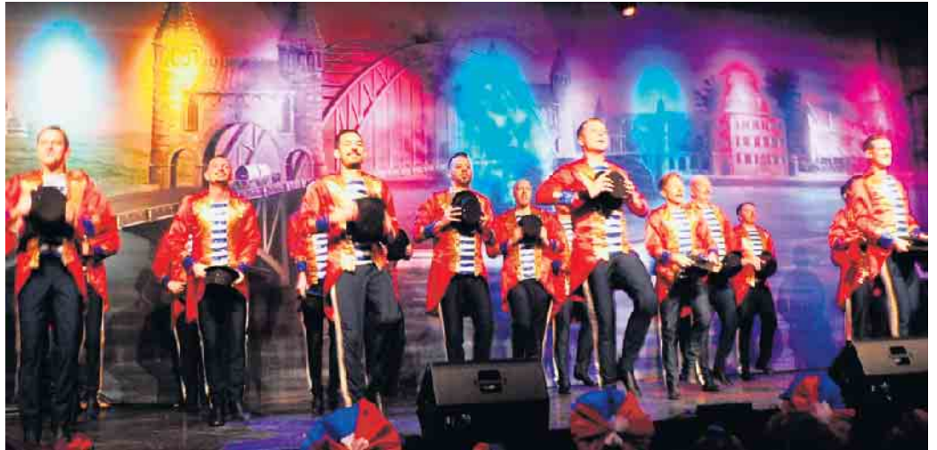
Die „Stattgarde Colonia Ahoj“ war das Highlight der Veranstaltung.