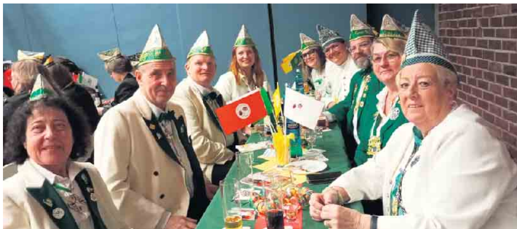
„Kaasseler Jonge“ und Mädchen bei der Proklamation des Dreigestirns.

Unter den derzeit 117 Mitgliedern gibt es nicht nur „Jonge“, sondern auch „Kaasseler Mädche“, egal welchen Alters, die bei der KG herzlich willkommen sind. An jedem ersten Montag im Monat findet das sogenannte „Aktiventreffen“ ab 19 Uhr in der roten Wagenhalle der KG, Heinrich-Ko-