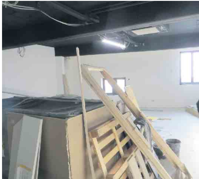
So sieht es Anfang Januar auf der Baustelle aus