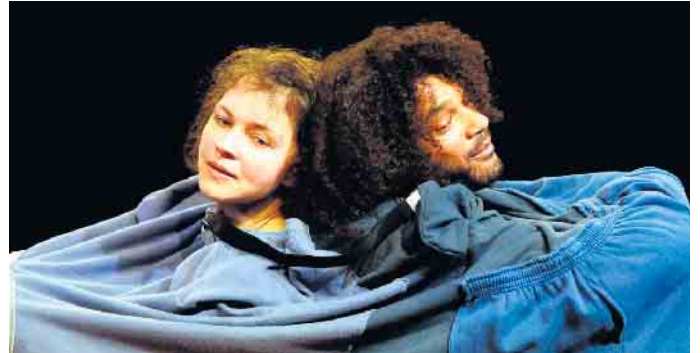
„Genau so, nur anders“, wo sind die Unterschiede, was ist anders?