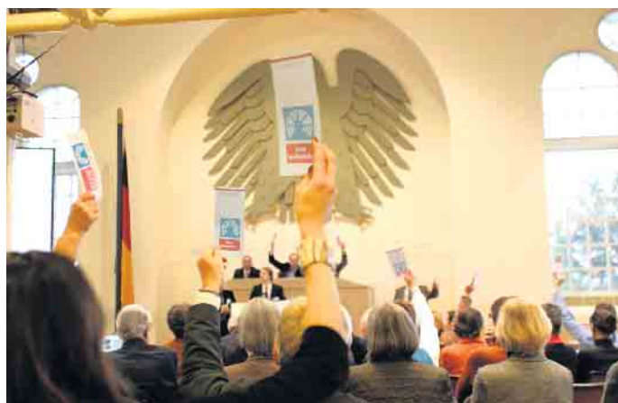
Die Parlamentarier*innen stimmen über die Förderung der vorgestellten Projekte ab.