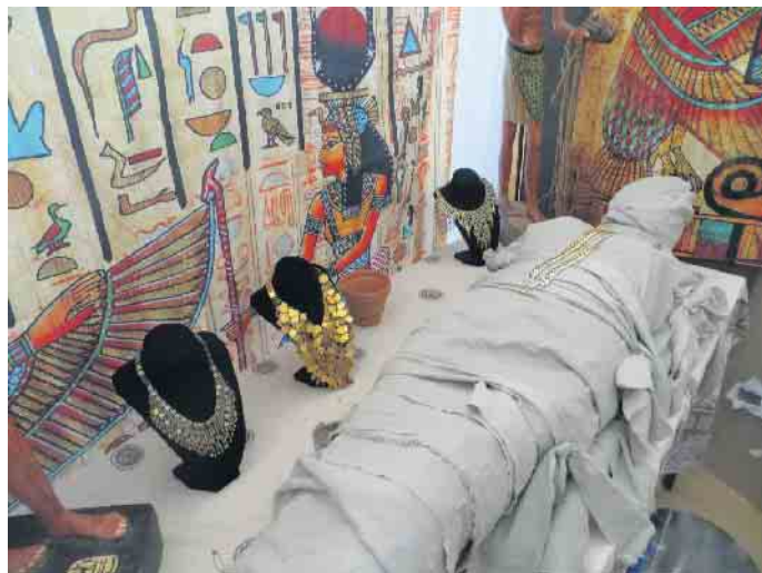
Noch ist die Mumie nicht fertig

Nach Einführung in die einfache Hieroglyphenschrift wird das Schreiben des eigenen Namens geübt und ein persönliches Lesezeichen aus echtem Papyrus gebastelt. Ein Suchspiel um Hieroglyphen zu finden, zu deuten und zu übersetzen gibt es auch noch.