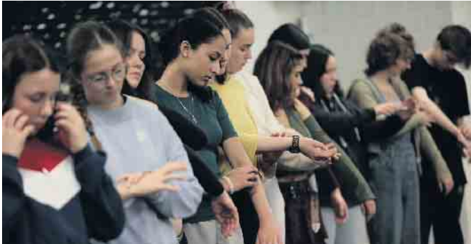
Jugendliche spielen in „lo_Ved“, einem Stück, das sich um Fragen der Liebe dreht.

Die Stückentwicklung von Jugendlichen kommt auf die Bühne