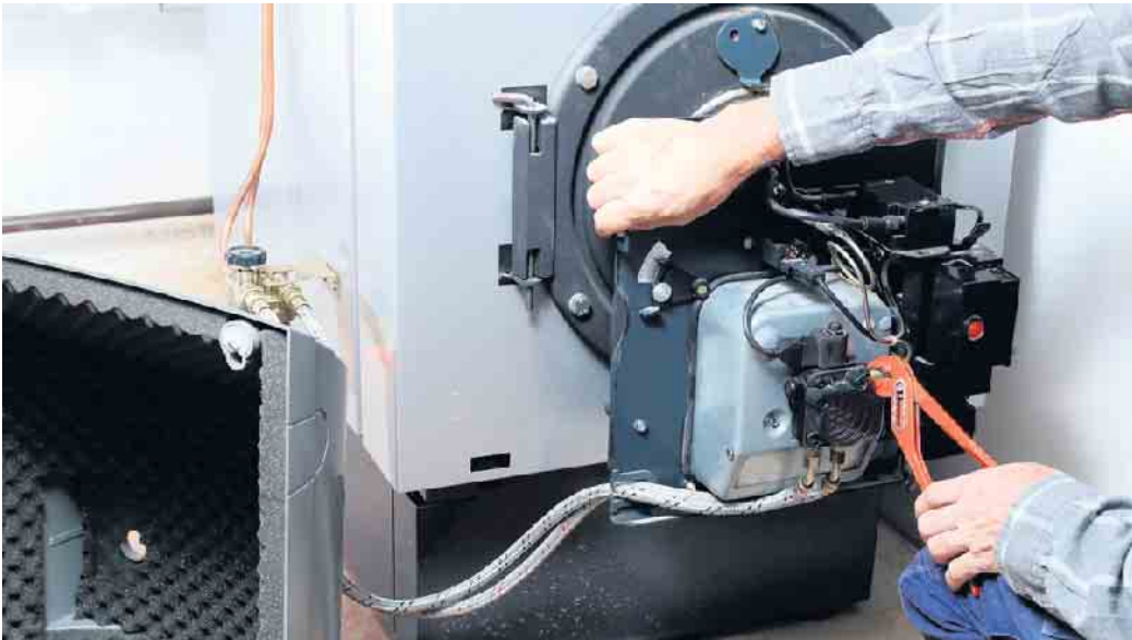
Viele Reparaturen können durch regelmäßige Heizungswartung vermieden werden.

Die Kosten für eine jährliche Wartung der Heizung in einem Einfamilienhaus liegen im Schnitt bei rund 160 Euro. Grundsätzlich hängen die Preise vom jeweiligen Fachbetrieb sowie der regionalen Lage und dem Anlagentyp ab. Die durchschnittlichen Wartungskosten sind bei der Gasheizung (130