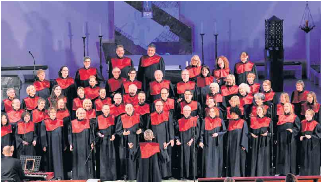
Seit 1996 ist der Chor „Wave of Joy“ mit seinen Gospelkonzerten ein gern gehörter Gast in der Region.

wechslungsreich und mitreißend. Die Stücke gehen ins Ohr, viele Lieder laden zum Klatschen oder Mitsingen ein.