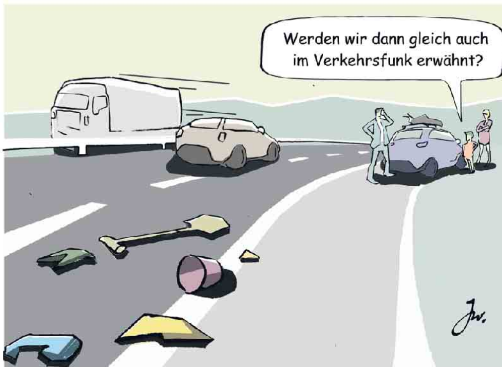
Kaum zu glauben, was so alles auf den Fahrbahnen herumliegt.

Das verlangt auch der Paragraph 32 der Straßenverkehrsordnung