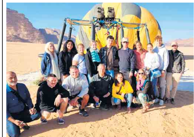
Ballonfahrt im Wadi Rum