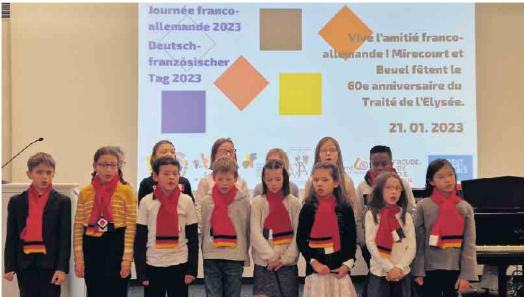
Der Chor der Bonner „Ecole de Gaulle-Adenauer“ begeisterte die Gäste.