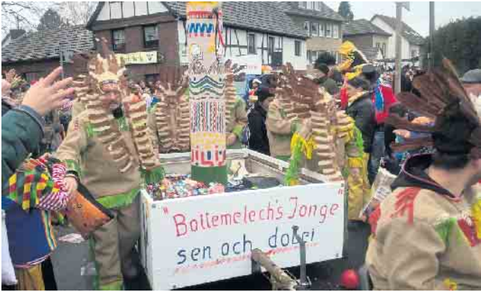
Die Bottemelech's Jonge sind eine feste Größe im Vilich-Müldorfer Karnevalszug.