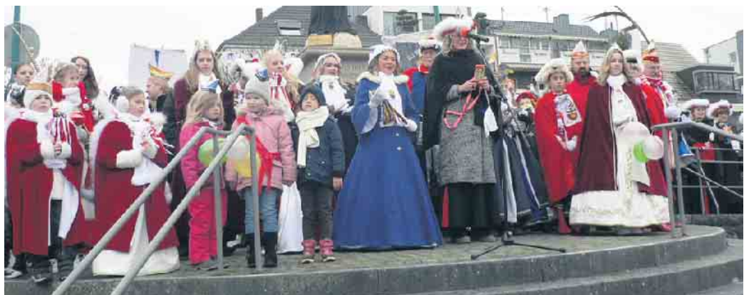
Wohlvollend schaute der Heilige Nepomuk dem Vorjahrestreffen zu.