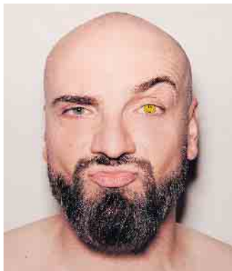
Ingmar Stadelmann löst die Probleme der Welt mit Humor.

Comedian Ingmar Stadelmann mit neuem Solo