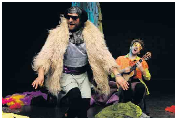
„Summ & Brumm“ sind auf der Suche nach ihrer Identität.

„Good Game Gretel“, eine Inszenierung, die 2019 ihre Premiere hatte, verabschiedet am 24. Januar von der Bühne des Theater Marabu. Bei der Geschichte zwischen Märchenadaption und Computerspiel (ab 10 Jahren) geht es um Hänsel und Gretel. Zwei Performer*innen machen sich auf die Spur der verschwundenem Geschwister und begeben sich in die düstere Märchenwelt, die auch immer ein Spiegel der Gegenwart ist. Spielerisch hinterfragen sie die Geschichte. Wer könnten Hänsel und Gretel heute sein, warum können sie nicht nach Hause? Welche Probleme müssen sie lösen und welche Gefahren überwinden? Mit den Mitteln des Computerspiels erschaffen sie ihre eigene fantastische Welt. Eine Mischung aus Märchen, Computerspiel und realen Erfahrungen. Aufführungen sind am 22., 23. und 24. Januar, jeweils um 10 und 12 Uhr. „Summ und Brumm“, eine Koproduktion mit dem Theater Bonn, ist ein humorvolles Stück Musiktheater für Kinder ab 3 Jahren ohne viele Worte, aber mit viel Musik. Summ & Brumm sind zwei