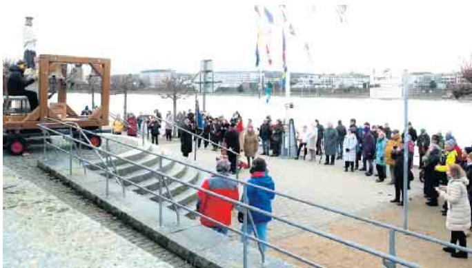
Gut besucht war das Anbeiern zum neuen Jahr an der Nepomukstatue.

Der sehr rührige Schiffer-Verein hat den „Mobilen Beueler Glockenturm“ im Jahre 2017 angeschafft, um vor Ort die rheinische Tradition des „Beierns“ zu demonstrieren. Diese Form des Glockenspiels zu besonderen Anlässen kann ein Jeder erleben, ohne über steile Treppen und Leitern in den Glockenstuhl eines Kirchturms steigen zu müssen. Im 13. Jahrhundert wurden erstmals Seile an Klöppeln in Glocken befestigt, damit der Glöckner die Glocke mit der Hand anschlagen konnte. Daraus entstand das „Beiern“ und die niederländische Bezeichnung „Beiaard“ für ein Glockenspiel. Die Spieler eines solchen Instrumentes heißen dort noch heute „Beiaardier“. Diese Tradition ist nicht nur im Rheinland, sondern auch in Frankreich, den Niederlanden, Belgien, Norddeutschland und von dort aus auch in den skandinavischen Ländern bezeugt. Aber ohne jeden Zweifel ist das