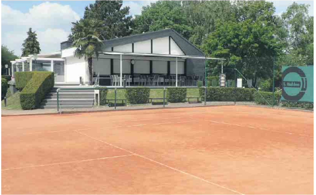
Auf der schönen Tennisanlage in Ramersdorf findet das ATP Challenger Turnier 2026 statt.