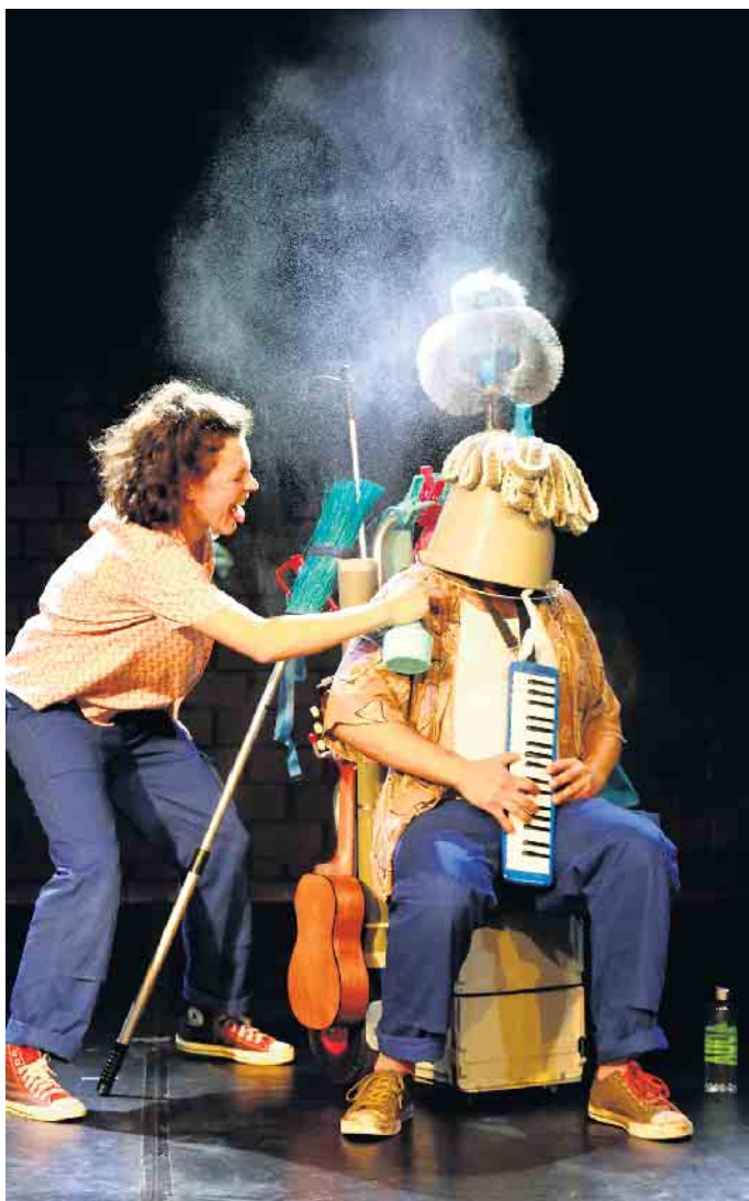
Mit viel Spaß „fluppt“ das Tagewerk und niemand macht blaue Pausen.

Die vielen globalen Krisen sind eine Zerreißprobe für die Welt und das Zusammenleben der Menschen. Das JEM macht sich auf die Suche nach den Geschichten, die Halt geben gegen die Fliehkräfte da draußen, die den Feindseligkeiten, dem Hass und der Gewalt