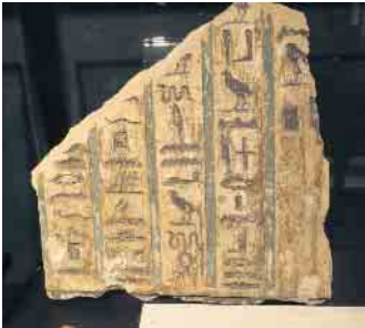
Tafel mit Hieroglyphen-Schrift

Veranstaltungsort für die Kurse: Ägyptisches Museum der Universität Bonn, Poststr. 26 in 53111 Bonn.