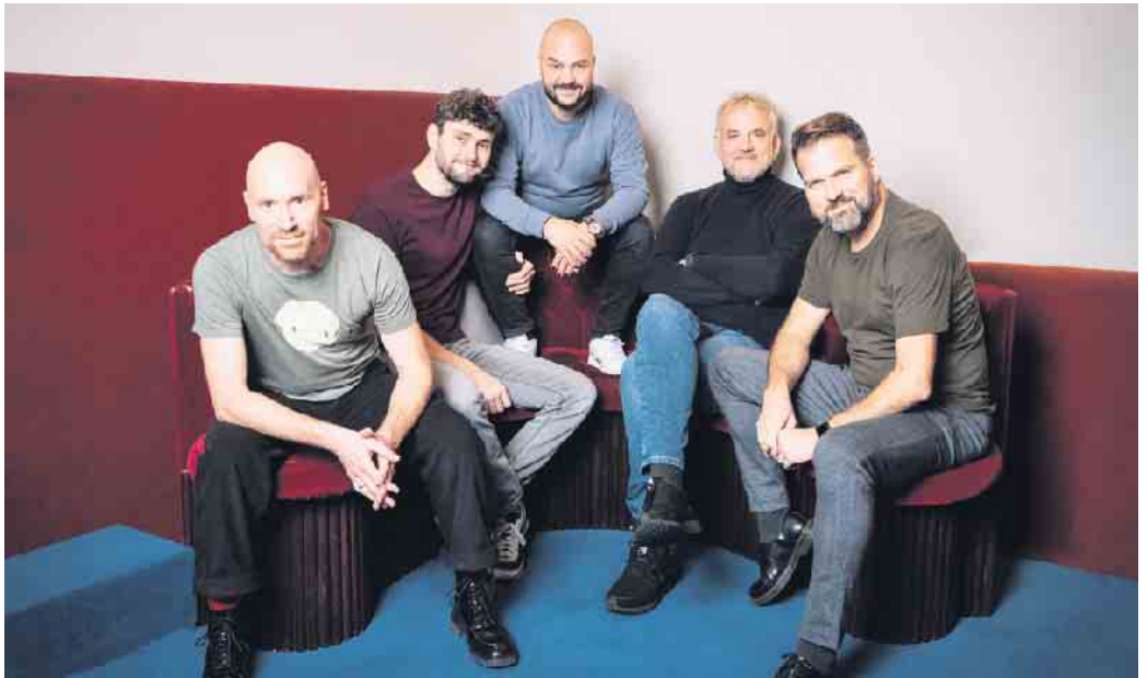
Die Gruppe „Alte Bekannte“ präsentiert seine A-Capella-Songs im Pantheon.