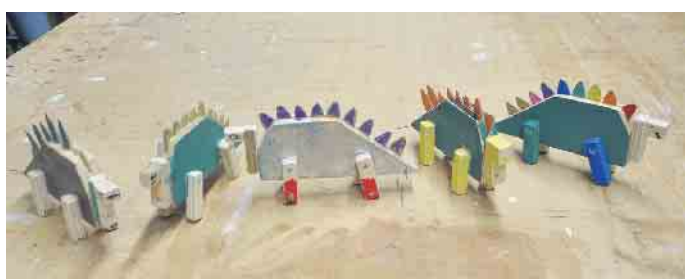
Fünf großartige Dino-Figuren machten es sich am Ende der Bastelstunde auf dem Werkstatt-Arbeitstisch gemütlich.

„Dass ihr im nächsten Jahr wieder dabei seid wollt, ist ein wunderbares Vorweihnachtsgeschenk für mich und die Fa. Specht.“ (WDK)