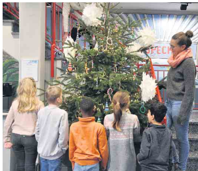
Nach getaner Arbeit blickten die kleinen Baumschmücker zufrieden und zu Recht stolz auf den von ihnen kunstvoll verzierten Weihnachtsbaum in der Ausstellungshalle der Fa. Specht.