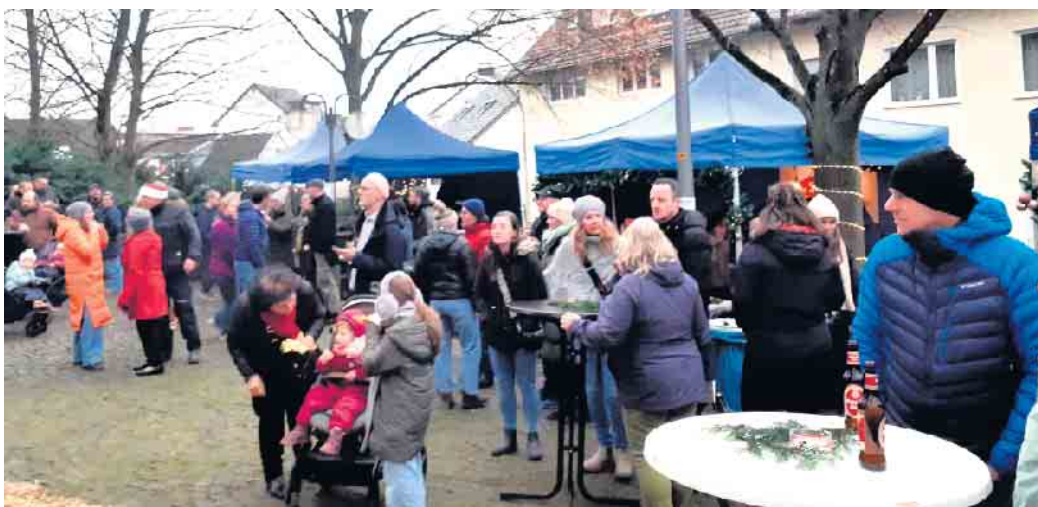
Zum Einstand ein erfolgreicher Adventsmarkt in Küdinghoven.

der erste Küdinghovener Adventsmarkt, der in diesem Jahr eine Fortsetzung haben wird. wm.