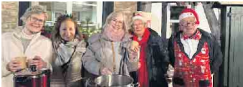
Die Kälte hatte keine Chance. Tolle Stimmung, Fröhlichkeit gepaart mit einem Glühwein bestimmten den Abend.