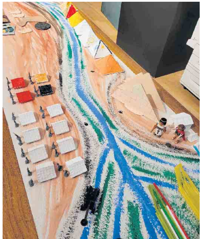
Stilisierter Verlauf des Nils