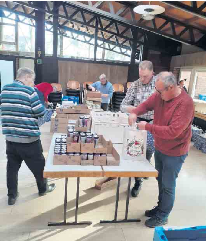
Packaktion im Putzchener Pfarrzentrum.