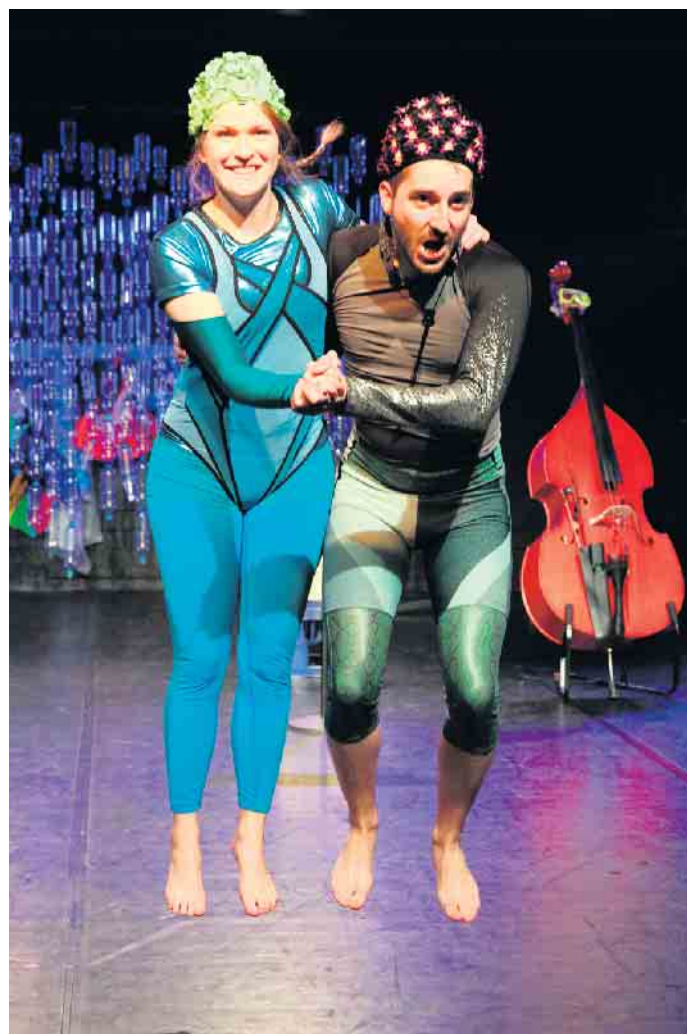
„Splash“. Wasser steht im Mittelpunkt des Musiktheaterstücks.