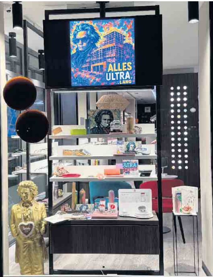
Das Siegerfenster des Wettbewerbs bei Optik Kröber.