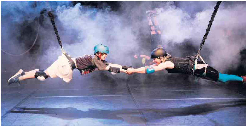
Komm doch näher! „Come a little closer“ ist der Versuch, Hass und Gewalt zu überwinden.

etwas entgegensetzen und daran erinnern, was es heißt, ein Mensch zu sein (ab14 J.). Leider wird die Finanzierung des Theaterbetriebs und der Projekte mit Kindern und Jugendlichen in Zeiten knapper Kassen zunehmend schwieriger. Eine Erhebung von Teilnahmegebühren oder eine Erhöhung der Eintrittspreise ist für die Verantwortlichen keine Option, denn keinesfalls wollen sie Kinder und Jugendliche vom kulturellen Leben ausschließen, weil sie sich die Teilnahme nicht leisten können. „Deshalb helfen Sie uns, indem Sie von unserem ‚Solidaritätsticket‘ Gebrauch machen und einfach an der Theaterkasse etwas mehr bezahlen, wenn es Ihnen möglich ist. Damit helfen Sie, die Ticketpreise insgesamt niedrig zu halten. Auch Spenden an den gemeinnützigen Verein marabu projekte e. V. kom-