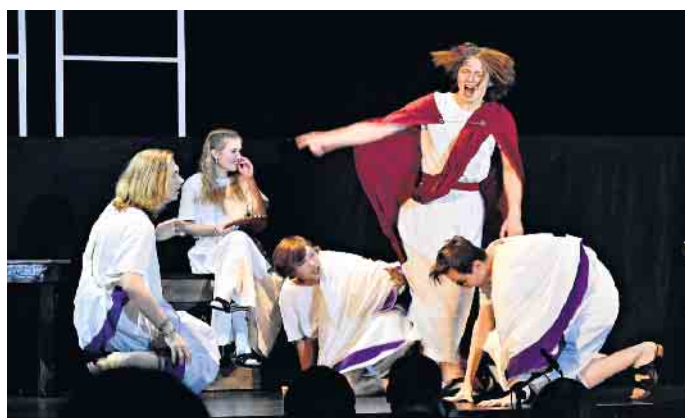
Kaiser Nero (Paule Hellmann) weist tobend die Ratschläge der Senatoren zurück.

bieten reichlich Stoff für ein Verwirrspiel um Macht zwischen Größenwahnsinn und Bereicherung, mit heimlichen Affären, Verschwörungen bis hin zu Rache und Mord. So gelang es auch hier, ein emotional aufgeladenes Stück mit immer neuen Wendungen in der Frage nach der Schuld und der Suche nach den Tätern für die Morde an Regenten und Senatoren anzubieten. Die Gedanken der Herrschenden werden in dem Stück deutlich herausgestellt, etwa wenn die Mutter von Nero, Agrippina, ihrem Sohn den Sinn der Spiele erklärt: „Gebt den Menschen was sie wollen - das ist Politik.“ Im Verlauf