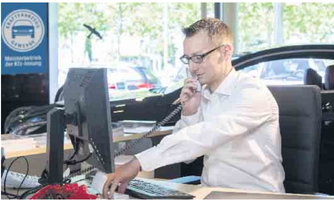
Die Kraftfahrzeugbranche bietet gute Karrieremöglichkeiten auch im kaufmännischen Bereich.

technische und kaufmännische Laufbahnen einsteigen. Unter www.wasmitautos.com finden Interessierte Informationen und Tipps rund um Ausbildungen und berufliche Entwicklungsmöglichkeiten sowie zur Suche von Ausbildungsbetrieben nach Postleitzahl und Ort. Die Website erklärt zudem, worauf es in den typischen Berufsbildern Kfz-Mechatroniker, Karosserie- und Fahrzeugbaumechaniker ankommt, welche Fähigkeiten und Inte-