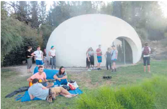
Friedensdorf Neve Shalom.

Der Sankt Augustiner Verein JugendInterKult e.V. (JIK) sucht noch zwei Begleitpersonen für zweiseitige Jugendbegegnungen mit Israel-Palästina, die nach Fahrtteilnahme im Oktober 23 und intensiver JIK-Schulung diese Fahrten auch als Leitende vorbereiten und begleiten möchten. Die Bewerber:innen sollten ca. 30 bis 50 Jahre alt sein (mindestens eine Person weiblich), im Raum Bonn - Köln wohnen, gute Englischkenntnisse, pädagogische Erfahrung im Umgang mit Projekten und Heranwachsenden haben und schon etwas vertraut sein mit dem Nahostkonflikt. Als verantwortliche Leiter:innen ab 2024 erhalten sie eine Aufwandsentschädigung. Die Teilnahme an folgenden