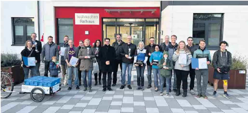
Die Gewinnerinnen und Gewinner des Stadtradelns bei der Siegerehrung vor dem technischen Rathaus.

Radfahrende mit den meisten Kilometern geehrt