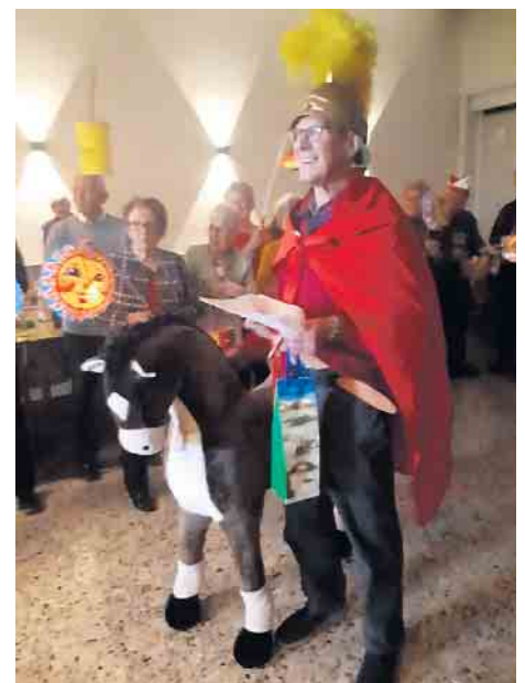
Sankt Martin bei der AWO