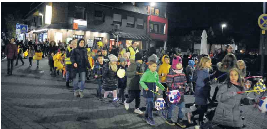
Schnappschuss aus dem Martinszug im Zentrum von Menden