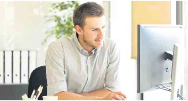
Die fortschreitende Digitalisierung verändert die Anforderungen an die Beschäftigten im Bankwesen rasant.

Nachwuchskräfte im Bankwesen müssen flexibel auf Veränderungen reagieren können