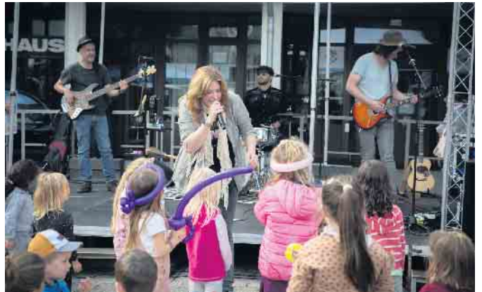
Die Band „Jack is Back“ sorgte für ordentlich Stimmung.

An den Ständen stellten die verschiedenen Akteure kostenlos eine Auswahl an Kuchen, Crêpes, Waffeln und Getränken zur Verfügung, was zu einer herzlichen und einladenden Atmosphäre beitrug. Für zusätzliche kulinarische Genüsse sorgten die Grillhexe aus Asbach und der Eiswagen vom Eiscafé La Fortuna aus Sankt Augustin. Das Kinder- und Familienfest hat einmal mehr gezeigt, wie wich-