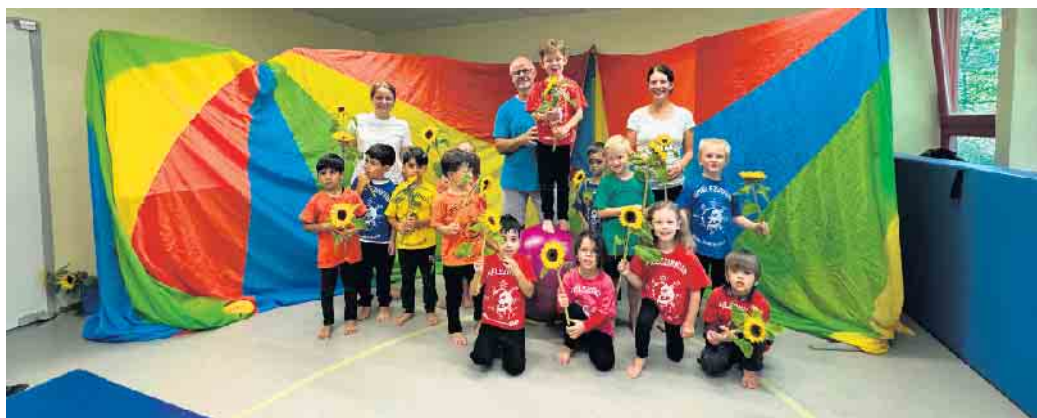
Stolze kleine Artisten nach der Zirkusaufführung.

Anfang September war es soweit: Die Vorschulkinder des städtischen Kindergartens „Am Park“ verwandelten sich in kleine Artisten und begeisterten rund 70 Zuschauerinnen und Zuschauer mit ihren Zirkusdarbietungen. In der Turnhalle des Kindergartens zeigten die Kinder stolz, was sie in der Woche zuvor mit viel Freude und Engagement einstudiert hatten. Eltern, Geschwister und Großeltern verfolgten die Aufführung mit großen Augen und viel Applaus. Der Höhepunkt des Jahres war für die Kinder nicht nur eine besondere Erfahrung, sondern auch ein großes Gemeinschaftserlebnis. Das Zirkusprojekt hat im Kindergarten „Am Park“ eine lange Tradition und wird bereits seit vielen Jahren in Zusammenarbeit mit dem Spielzirkus Bonn-Rhein-Sieg durchgeführt. Ingo Scharn-