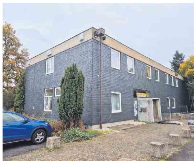
Die neuen Quartiere für die Fledermäuse hängen nun an einem Gebäude der Steyler Missionare.