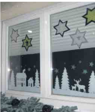
Sterne zeigen den Weg

Spaziergang zu einem „Türchen“ in Hangelar unternommen werden. Was kann ich tun? Dazu melden Sie sich bis 9. November per E-Mail unter adventskalender.an@katholisch-sankt-augustin.de und nennen neben Ihrer Adresse insbesondere den Tag, an dem Sie ein Adventskalendertürchen gestalten wollen. Diese Angaben werden, ohne Namen, den Hangelarern ab Mitte November in einem Flyer zugänglich gemacht. Dann gestalten Sie Ihr Fenster zum angegebenen Tag.