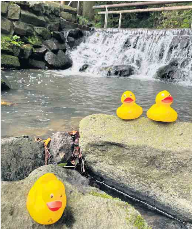
Zum Entenrennen auf dem Lützbach, der durch das Außengelände des Saunaparks fließt, lädt der Saunapark während der Festwochen ein.