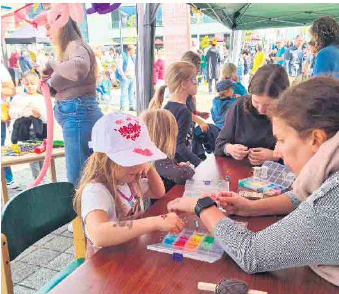
Besucherinnen und Besucher beim Kinder- und Familienfest.

den zu hören sein beim Jahreskonzert. Karten können im LOTTOshop Hangelar Kölnstr. 132 Tel: 02241-21585, bei Familie Rostek in Meindorf Liebfrauenstr.3 Tel: 02241-311777, online unter tickets@siegklang.de sowie bei den Aktiven erworben werden. Der Eintritt beträgt 12 Euro, ermäßigt 8 Euro, Jugendliche bis 14 Jahre haben freien Eintritt an diesem Abend im Saal der Freien Waldorfschule Hangelar am 24. November um 18 Uhr, Graf-Zeppelin-Str. 7.