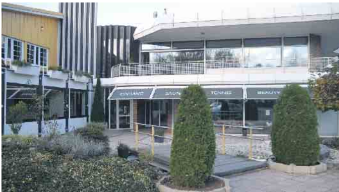
Der Saunapark Siebengebirge bietet viele Möglichkeiten, Ruhe und Entspannung zu genießen.