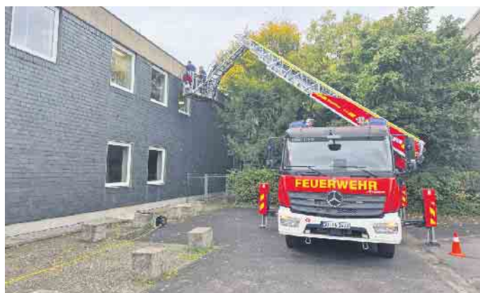
Mit Hilfe der Drehleiter war die Montage der Quartiere in etwa sechs Metern Höhe kein Problem.

chender Ersatz geschaffen werden. Holzbeton-Quartiere werden sehr gerne von Fledermäusen angenommen. Neben den Gebäudequartieren werden auch zahlreiche weitere Höhlen-Quartiere an verschiedenen Bäumen im Umfeld angebracht.