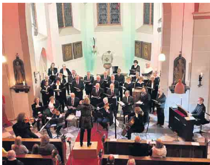
Kirchenchor Meindorf 1911