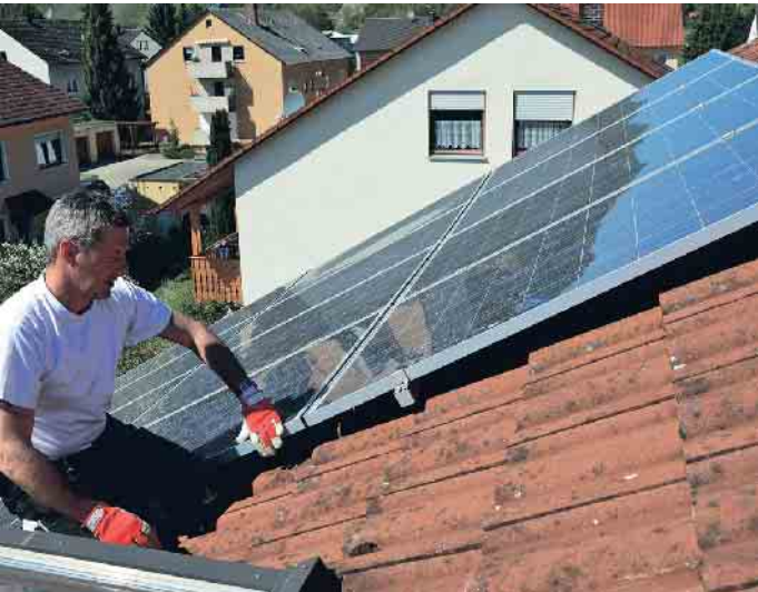
Der qualifizierte Dachdecker prüft die Befestigungen der Solarmodule und begutachtet die Unterkonstruktion im Rahmen des DachChecks.

Der Zentralverband des Deutschen Dachdeckerhandwerks (ZVDH) rät daher allen Hausbesitzern und Hausverwaltungen, nach dem Winter das Dach und seine Bauteile überprüfen zu lassen. Nur so können mögliche Schäden rechtzeitig behoben werden. Im Rahmen eines DachChecks wird das gesamte Dach einer gründlichen Sichtprüfung unterzogen.