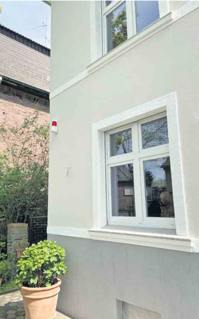
Sicherheitssysteme für die eigenen vier Wände sollten von einem Fachbetrieb maßgeschneidert für das Objekt und die Bedürfnisse seiner Bewohner geplant werden.

auf dieser Basis ein individuelles Konzept. Die gesamte Anlage und die einzelnen Komponenten sollten VdS-Zertifizierungen besitzen. Dies gewährleistet auf der einen Seite ein hohes Maß an geprüfter Sicherheit. Auf der anderen Seite sind Anlagen mit diesen Zertifizierungen auch von vielen Schadenversicherern anerkannt, die hierfür Abschläge auf ihre Versicherungspolice einräumen. Hilfe bei der Finanzierung von Einbruchschutzmaßnahmen gibt es zudem vom Staat. Im Rahmen des Programms 159 „Altersgerecht umbauen“ gewährt die KfW Förderbank Kredite von bis zu 50.000 Euro zu zinsvergünstigten Konditionen. (DJD)