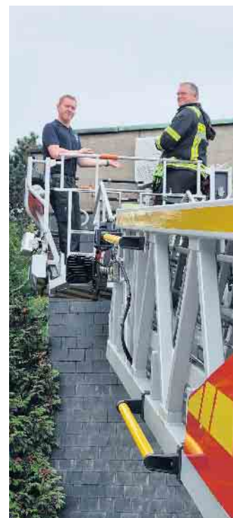
Zwei Mitglieder der Feuerwehr haben das schwere Quartier befestigt.

Im Vorfeld des Abrisses wurde das alte Gebäude von Biologen begutachtet. Dies verlangen die geltenden Artenschutzbestimmungen. Es wurden zahlreiche Quartiersmöglichkeiten für gebäudebewohnende Fledermausarten - wie zum Beispiel die Zwergfledermaus ( Pipistrellus pipistrellus ) - festgestellt, die mit dem Abriss verschwinden werden. Daher musste entspre-