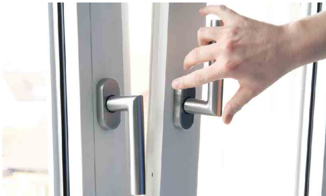
ROLF Fensterbau - Ihr Partner für gut belüftete Wohnräume.

Doch wie lässt sich der Luftaustausch im Alltag einfach und effektiv gestalten? Eine unauffällige und wartungsarme Lösung bieten Fensterfalzlüfter, die ohne Elektronik für eine konstante Frischluftzufuhr sorgen. Diese Lüftungssysteme lassen sich vom Fachmann einfach im oberen Bereich des Fensterflügels montieren und fügen sich nahtlos in das Design des Fensters ein. So sind sie selbst bei offenem Fenster nahezu unsichtbar. Durch die innovative FlieBgelenktechnik der Regelungskappen sorgt der Fensterfalzlüfter auch bei geschlossenem Fenster für eine optimale Luftzirkulation und eine angenehme Raumtemperatur. Die Luftvolumenströme werden dabei automatisch an die relative Luftfeuchtigkeit angepasst, was den Energieverbrauch optimiert und gleichzeitig für frische Luft sorgt. „Besonders überzeugend ist, dass sich das