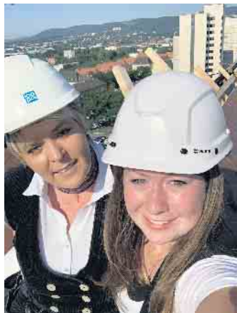
Klimaschutz, keine reine Männersache; es gibt auch Frauen im Dachdeckerhandwerk.