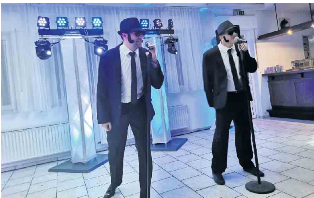
Die Blues Brothers beim gemütlichen Abend

Der gemütliche Abend ist ein fester Termin im Kalender der Karnevalsgesellschaft Blau-Wieße