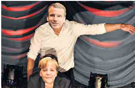
Wiedererkennung garantiert: Die Reisegruppe Ehrenfeld zeigt tänzerisch die Beziehung berühmter Paare der Weltgeschichte auf.