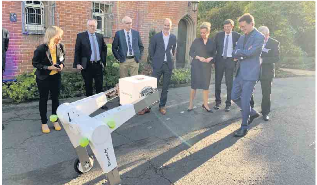
Präsentation eines Roboters für die Gäste der Eröffnungsfeier.

Nordrhein-Westfalen solle, wie Ministerpräsident Hendrik Wüst betonte, zu einem Hotspot der KI-Forschung werden. Am Lamarr-Institut werde an Fragen zur Mobilität von morgen, innovativen Produktionsprozessen oder smarter Energieversorgung geforscht. Bürgermeister Max Leitterstorf freute sich, das Lamarr-Institut in Sankt Augustin begrüßen zu können: „Neben der geplanten Ansiedlung des DLR Instituts für KI-Sicherheit auf dem Butterberg sowie den bestehenden Aktivitäten des Fraunhofer-Instituts und der Hochschule Bonn-Rhein-Sieg ist dies eine hervorragende Entwicklung und stärkt unsere Stadt als WissensStadtPlus gerade in diesem zentralen Feld