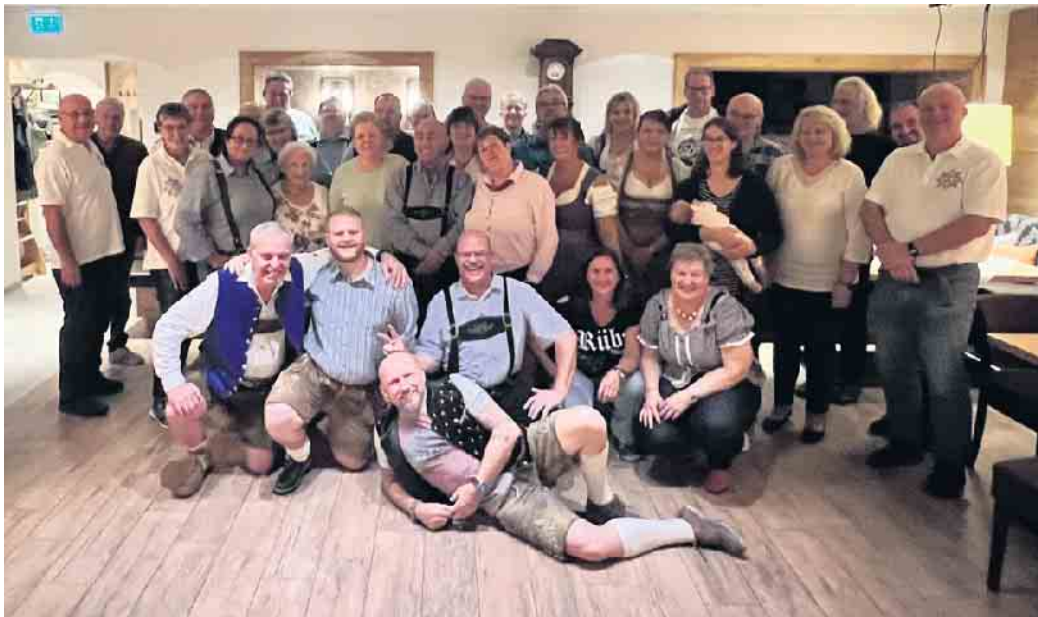
Die Prinzengarde der Stadt Sankt Augustin in St. Johann

Am Donnerstag, den 30. September machten sich rund 40 Aktive der Prinzengarde der Stadt Sankt Augustin auf den Weg ins schöne