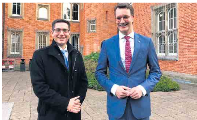
Bürgermeister Max Leitterstorf und Ministerpräsident Hendrik Wüst (v.l.) vor dem Institutsgebäude.

dierten Ausbildung des wissenschaftlichen Nachwuchses, wird der Transfer in die Industrie in Form von Wissen, Expertise und vertrauenswürdigen Anwendungen im Vordergrund stehen.