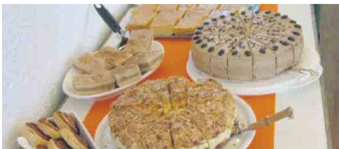
Schauen Sie auf ein Stück Kuchen herein

Der Verein Familien-/Seniorenhilfe Sankt Augustin e.V. lädt am Sonntag, 5. Oktober, ab 15 Uhr, herzlich zum Sonntagscafé ins Pfarrheim St. Anna, Franz-Jacobi-Str. 1, Hangelar ein. Bei Kaffee, Tee und Kuchen kann man in fröhlicher Atmosphäre nette Leute treffen, erzählen, plaudern und Gemeinschaft pflegen. Das Sonntagskaffee findet jeden 1. Sonntag im Monat statt. Die Ehrenamtlichen des Vereins freuen sich auf viele Besucher!