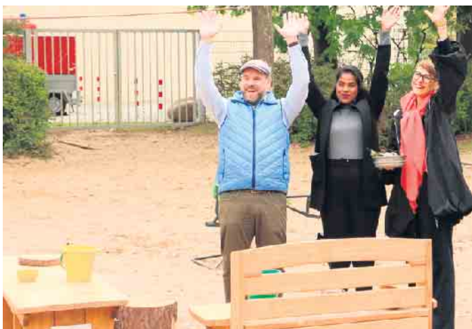
Beste Stimmung bei der Übergabe der neuen Matschküche.