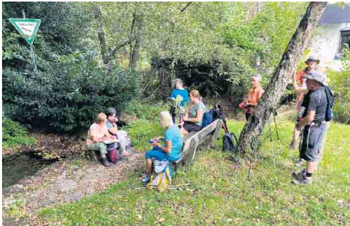
Rast an einer Dorf-Quelle.

Interessierte sind jederzeit herzlich eingeladen, sich der Gruppe anzuschließen und die Schönheit der Umgebung wandernd zu entdecken.