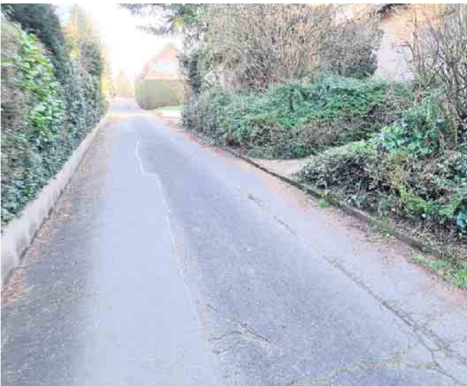
Am Gänsepütz.

Der Fachbereich Tiefbau der Stadt Sankt Augustin beginnt am 29. September mit umfangreichen Kanal- und Straßenerneuerungsarbeiten in der Straße Am Gänsepütz. Die Bauzeit ist - vorbehaltlich günstiger Witterung - bis April 2026 angesetzt.