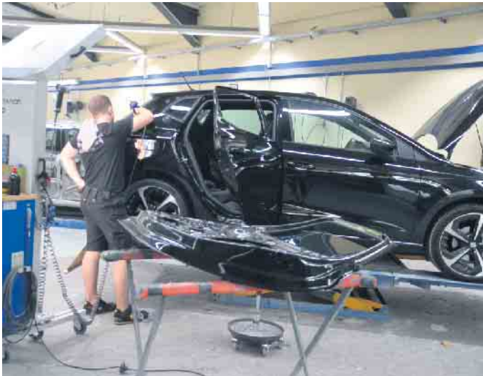
Ein fachkundiges Team nimmt sich der Lackschäden an und lässt das Fahrzeug am Ende wieder wie neu aussehen.

Stefan Hegger und sein Team bieten in Oberpleis ein umfassendes Leistungsangebot an - erstmals ist eine Auszubildende im Betrieb