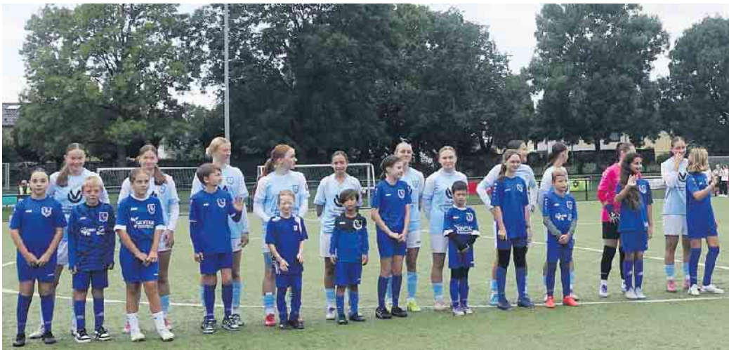
Die U17-Juniorinnen des SV Menden 1912 e.V. vor dem Anstoß zum Spiel gegen den VfB Stuttgart im DFB-Pokal.

U17-Juniorinnen des SV Menden leisten mutigen Widerstand gegen den VfB Stuttgart