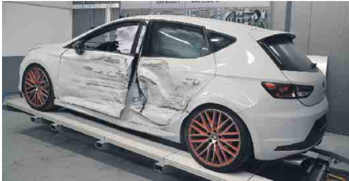
Nicht nur kleine Lackschäden, auch größere Schäden am Fahrzeug werden in dem Fachbetrieb instandgesetzt.