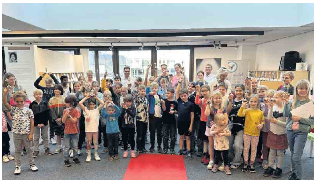
Die erfolgreichen Teilnehmerinnen und Teilnehmer am diesjährigen Sommerleseclub präsentieren ihre Lese-Oskars.

Den ganzen Sommer über wurden fleißig Bücher gelesen oder