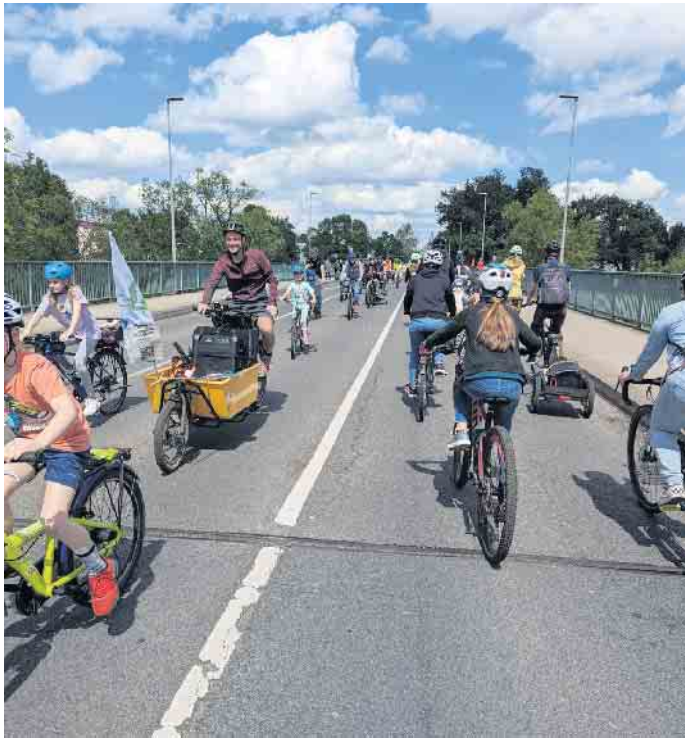
Kidical Mass auf der Bonner Straße