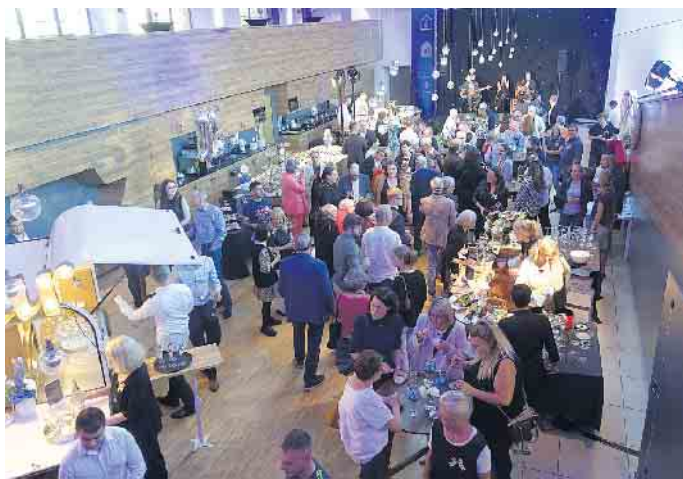
Blick in den großen Veranstaltungsraum im Ronald McDonald Haus Sankt Augustin. 190 Freunde und Sponsoren des Hauses hatten allen Grund zum Feiern.