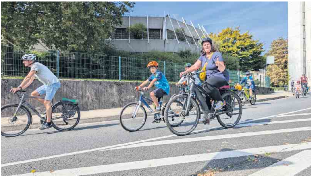
Daumen hoch für die Kidical Mass

Liebe Kinder, liebe Familien, wir laden euch herzlich zur Kidical Mass am 28. September ein. Die Kidical Mass ist eine bunte Kinder-Fahrraddemo für sichere Kita-, Schul- und Radwege. Gemeinsam sind wir sichtbar und setzen uns für eine kinderfreundliche Verkehrspolitik ein - nun schon zum sechsten Mal in Folge. Los geht's am Sonntag, 28. September: Start um 14 Uhr auf dem Karl-Gatzweiler-Platz, St. Augustin, Ende um ca. 15:15 Uhr am Markt, Siegburg. Ebenfalls um 14 Uhr trifft sich ab Menden Markt die Bürgerinitiative „Menden Clean Up“ und schließt sich der Kidical Mass an. Damit soll gemeinsam die bislang unzureichende Fahrradinfrastruktur auf der Siegstraße, insbesondere für junge Radfahrende, angemahnt werden. Am Ziel warten frische Waffeln und Getränke, ein großartiger Radparcours, Bastelangebote und Spiel-