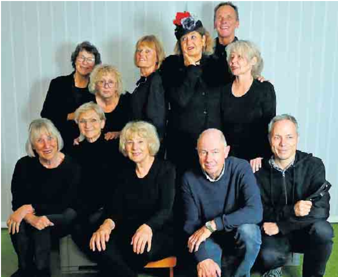
Die Laientheatergruppe VIELFACH sucht Verstärkung.

Laientheatergruppe Ensemble VIELFACH sucht Verstärkung für die neue Theaterrevue.