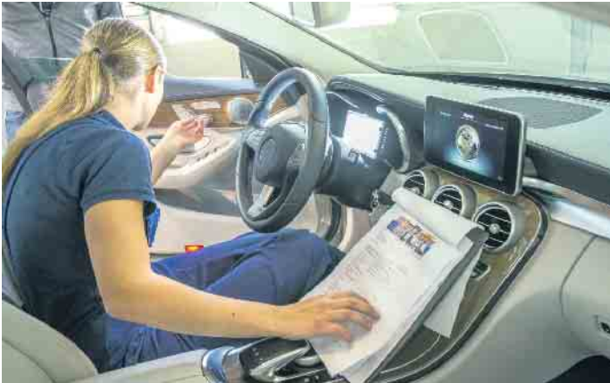
Ausbildungsberufe in der Kraftfahrzeugbranche bieten jungen Menschen gute Entwicklungschancen und zukunftssichere Arbeitsplätze.

Die Mobilitätsbranche ist einem starken Wandel unterworfen. Elektrofahrzeuge werden zur Normalität, durch eine Vielzahl von Assistenzsystemen mit Sensoren, Radar- und Kamera-systemen und elektronischen Bauteilen werden die Fahrzeuge immer komplexer. Parallel sind innovative Mobilitätsformen wie das Carsharing oder flexible Auto-Abos den Kinderschuhen entwachsen. Für Men-