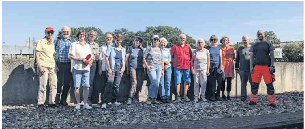
ZWAR Netzwerker auf Info-Tour bei der ZABA

(FB) ZWAR - Zwischen Arbeit und Ruhestand, ist ein Netzwerk, in dem sich Interessierte einfach vernetzen um gemeinsam aktiv zu bleiben. Die Gruppe Hangelar / Sankt Augustin Ort existiert jetzt seit Mai 2022 und zählt inzwischen 84 Teilnehmer. Das ist ein riesiger Erfolg, der nur durch gemeinsames Handeln erzielt werden kann. Gemeinsam aktiv sein und das ohne die übliche Bindung eines Vereins: das ist mit ZWAR gelungen. Die jüngste Aktivität einer Gruppe aus Hangelar und Ort, bei der auch einige Niederpleiser ZWARler gerne mit eingeladen wurden, war die Besichtigung der zentralen Abwasser Aufbereitungs Anlage, kurz ZABA. Bei strahlendem Sonnenschein erfuhren die Teilnehmer alles über das Abwasser, welche Dinge nie in die Toilette und das Abwasser gehören und vor allem, welcher erhebliche Aufwand betrieben werden muss, um Dinge und Rückstände aus dem Abwasser zu entfernen, bevor es „als Trinkwasser für die Fische“ in