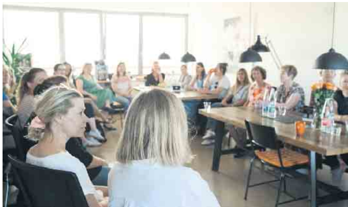
Netzwerktreffen von Unternehmerinnen aus dem Rhein-Sieg-Kreis.

(NoLe) Nach dem erfolgreichen Auftakt in Hennef geht das neue Unternehmerinnen-Netzwerk WeGrow im Rhein-Sieg-Kreis in die nächste Runde. Rund 25 Frauen aus den unterschiedlichsten Branchen waren im Juni beim Startschuss in der Denkschmiede Hennef dabei - von Gründerinnen