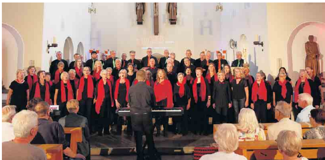
„Moving Voices“ aus Sankt Augustin und „Siegtal Voices Merten“ beim Jubiläumskonzert in der Kirche Sankt Mariä Heimsuchung in Mülldorf.

Zum Jubiläum hatte der Chor sich etwas Besonderes einfallen lassen: Sie hatten die Siegtal Voices Merten aus Merten an der Sieg bei Eitorf. eingeladen, die ebenfalls unter der Leitung von Karsten Rentzsch singen. Die 16 Männer, ebenfalls in Schwarz, allerdings mit grünen und orangefarbenen Krawatten, starteten mit „Every Breath You Take“, einer Nummer der Band The Police aus dem Jahr 1983, gefolgt von