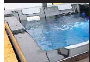
Whirlpools & Swim Spas