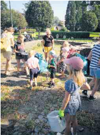
Am Sonntag, 10. September, gab es ein ungewohntes Bild in Menden. Durch viele der Straßen des

Sankt Augustiner Stadtteiles streiften sammelwütige, engagierte kleine und große Bürger, ausgestattet mit Greifzangen, Handschuhen und Müllsäcken auf der Jagd nach Verpackungen, Zigarettensmullen und sonstigem achtlos weggeworfenem Müll. Dem privaten Aufruf und dem Einsatz vierer befreundeter Familienväter waren gleich mehr als 50 Leute gefolgt. Zwischen 3 und 50 Jahre alte Müllsammler jagten und fanden gleich mehr als 16 Säcke voller Müll, die nach Absprache und Unterstützung mit dem Amt für Natur und Umweltschutz und dem Bauhof fachgerecht entsorgt werden können.