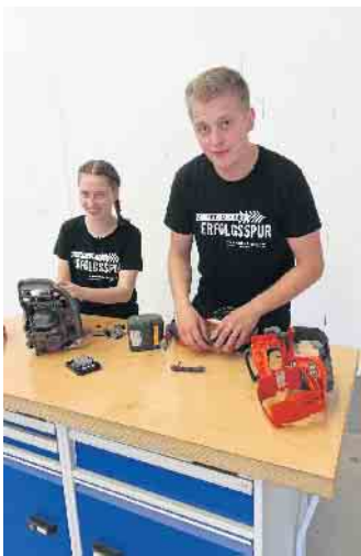
Die praxisnahe Ausbildung eröffnet reizvolle berufliche Perspektiven bis hin zur Selbstständigkeit.

Die sogenannte Generation Z, die heute den Arbeits- und Ausbildungsmarkt betritt, wünscht sich Studien zufolge verstärkt