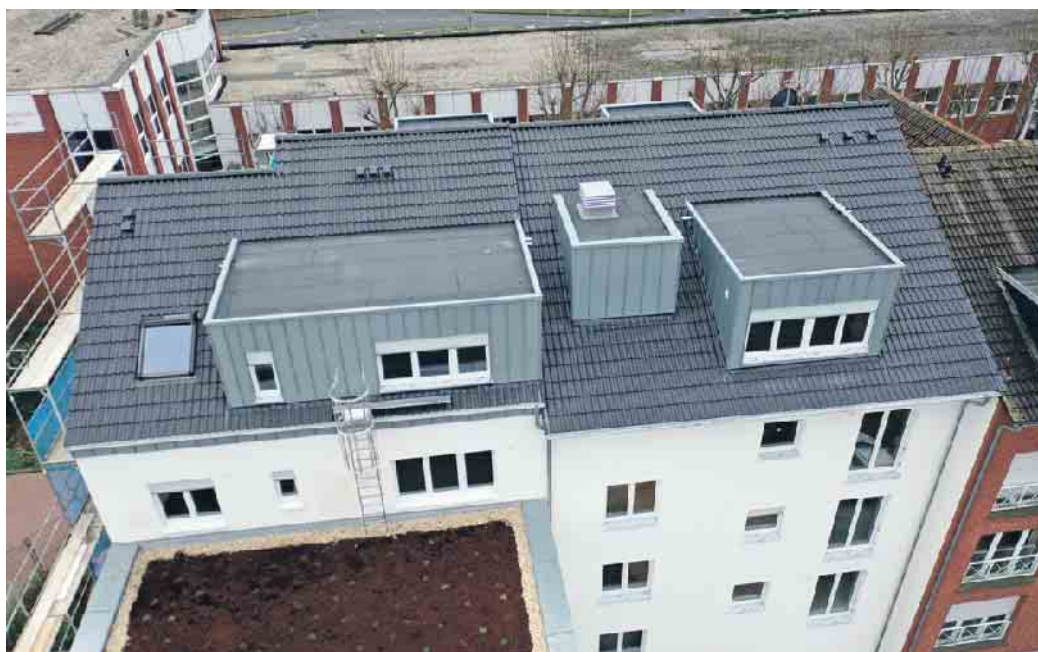
Dachdecker lassen Dächer auch ergrünen.

Deutschland gibt es immerhin 120 Millionen m2 begrünte Dachflächen. Das sorgt für Kühlung und Luftbefeuchtung, aber auch für Lärm- und Schallschutz. Junge Leute, die gerne im Handwerk arbeiten und dabei auch Klimaschützer sein wollen, liegen mit einer Ausbildung im Dachdeckerhandwerk genau richtig“, rät ZVDH-Präsident Dirk Bollwerk und ergänzt, dass das Dachdeckerhandwerk bislang auch gut durch die Coronakrise gekommen sei: kaum Kurzarbeit und wenige Entlassun-