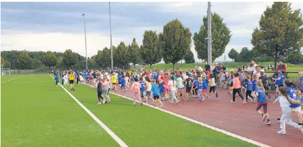
Kinder laufen für Kinder

StadtSportverbandes mundgerecht serviert wurden. Die aus dem Sponsorenlauf eingenommenen Spenden sollen zweckgebunden für die Unterstützung von bedürftigen Kindern verwendet werden. Aus dem gesammelten Geld werden 90 Prozent den Fördervereinen der Schulen zur eigenen Verwaltung übergeben, 10 Prozent verbleiben beim StadtSportverband, der damit Projekte der Sankt Augustiner Vereine unterstützt. Außerdem soll Kindern aus wirtschaftlich prekären Verhältnissen die Teilnahme am Vereinssport oder die Anschaffung von Sportkleidung ermöglicht werden. Der StadtSportverband hofft auch in 2024 den Sponsorenlauf „Kinder für Kinder“ an den Start bringen zu können.