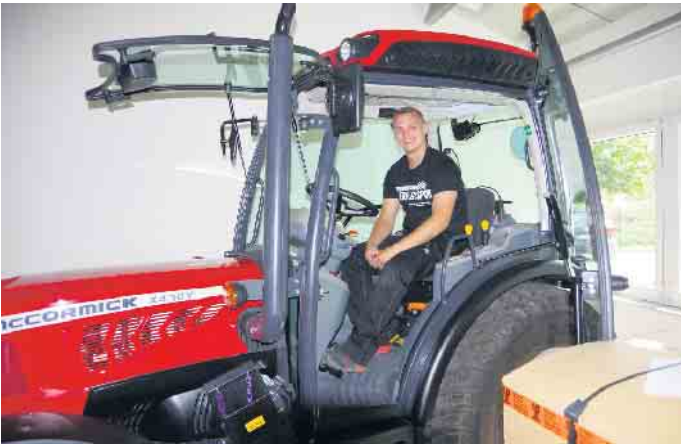
Schweres Gerät sicher beherrschen: Die Leidenschaft für Technik ist eine gute Voraussetzung für eine Ausbildung im Motorgeräte-Fachhandel.