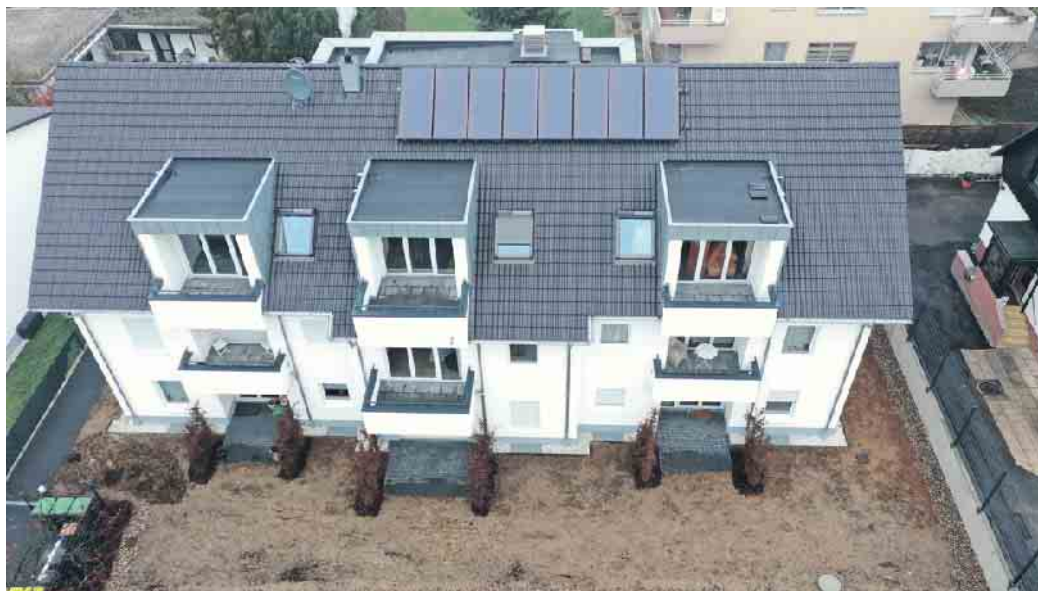
Das Dachdeckerhandwerk, der richtige Ansprechpartner für die Solaranlage auf dem Dach.

Dachdecker sind Klimaschützer Zunehmend wird es auch wichtig, den bereits deutlich spürbaren Veränderungen durch den Klimawandel zu begegnen, zum Beispiel der Hitzebelastung in Ballungsgebieten. „Dachdecker und Dachdeckerinnen sorgen mit ihrer fundierten Arbeit nicht nur für eine trockene und behagliche Wohnung, sondern tragen als Teil einer klimabewussten Gesellschaft mit ihrer Arbeit dazu bei, dass unsere Welt auch in Zukunft lebenswert bleibt. Denn neben der Sanierung bringen Dachdecker auch Fotovoltaikanlagen aufs Dach oder planen Gründächer. In