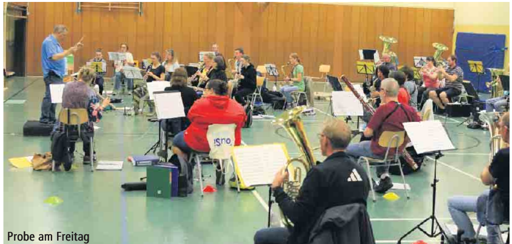
Probe am Freitag

Immobilien Kempken · Vilicher Straße 22 · 53757 St. Augustin Tel.: 02241/945 630 · Mobil: 0151/67232180 · immobilien-kempken@t-online.de