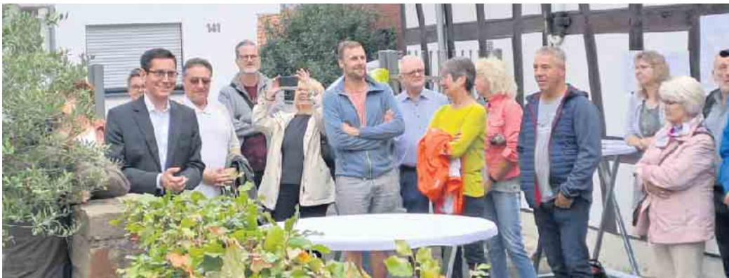
Einführungsrede Bürgermeister Max Leitterstorf