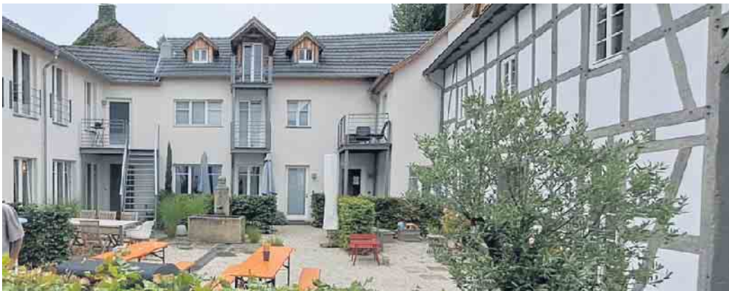
Innenhof de Könsgenshof, Rechts Wohnhaus, Mitte Mehllager, links Bäckerei