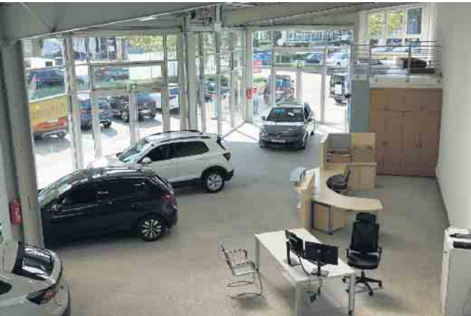
Der großzügige Innenbereich der neuen Autowelt.

Am vergangenen Wochenende hat das Autohaus Hoff die Autowelt in Sankt Augustin-Menden eröffnet. Das besondere Konzept am neuen Standort machte die Besucher neugierig.