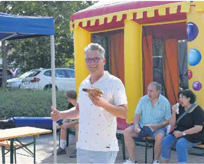
Für die Besucher gab es Bratwürstchen und kühle Getränke.

erklärt er: „Wir wollen auf der Einsteinstraße hier in Menden das Portfolio erweitern und einen neuen Markt bedienen.“ Neben einer Verköstigung der Besucher mit Bratwürsten und küh-