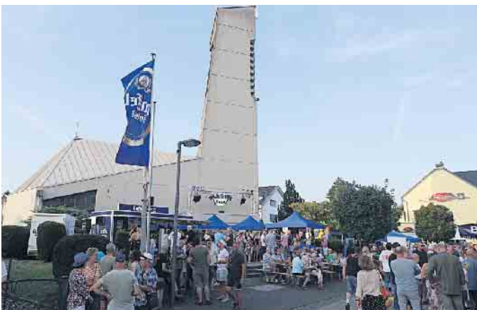
Schon früh gut besucht: Die Gaffel-Oase vor der Pfarrkirche St. Anna