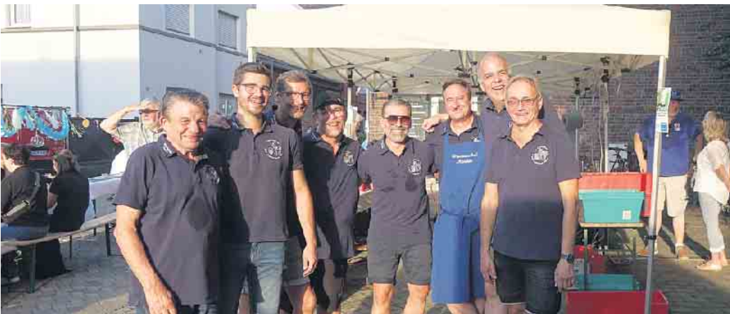
Der Ortsausschuss von Menden beim schweißtreibenden Service für den guten Zweck, Tradition und Brauchtum in Menden hochzuhalten.

(hdp) Am vergangenen Sonna-bend, 1. September, um 17 Uhr, war es wieder soweit: Mit einem ökumenischen Gottesdienst, es war ja Kirchweih der Kirche Sankt Augustinus, begann der diesjäh-rige „Dä längste Desch vun Men-den“ auf der gesperrten Kirch-straße. 2018 zum ersten Mal er-folgreich durchgeführt, nutzen auch diesmal die Bewohner Men-dens die Gelegenheit, sich in un-gezwungener Atmosphäre an ei-nem Tisch, diesmal bestehend aus rund 25 Bierzeltgarnituren, zu tref-fen und zusammen zu feiern. Es geht ums Kennenlernen neuer Bürger und Wiedersehen alter Freunde, so ganz ohne elektri-sche Musik und elektrisches Licht, ums Miteinanderklönen, Lachen und Singen. Und traditionell geht es auch um den schönsten Tisch, der von den diesmal rund 180 Teilnehmern