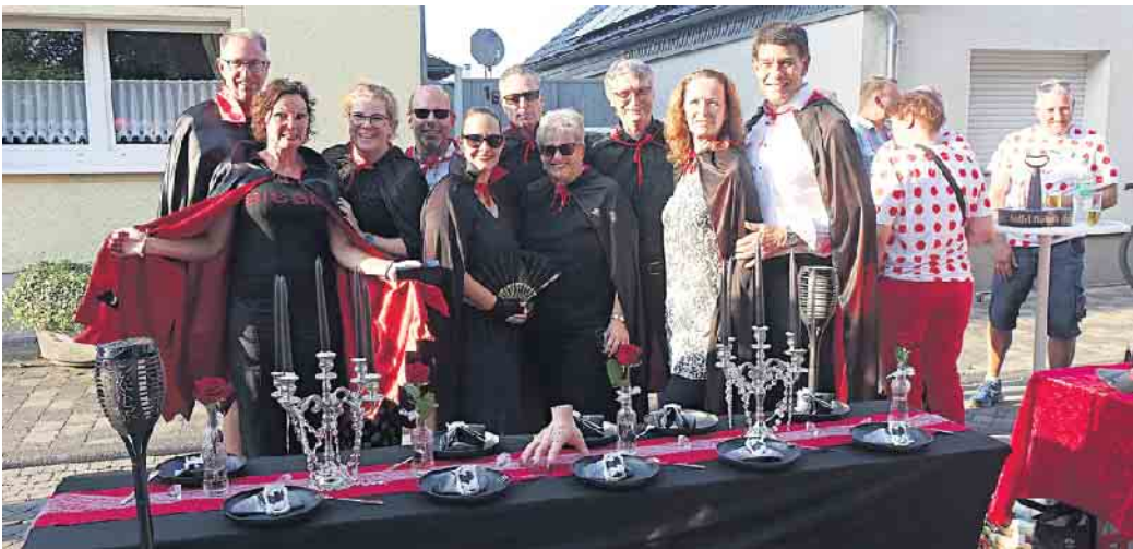
Auch dabei: Das Gefolge um das Sankt Augustiner Prinzenpaar lud zum „Tanz der Vampire“.

den drei Zweitplatzierten Tischen, einmal mit bunten Lampions, einer Tafel für ein Vampiressen und dem aufwändig geschmückten Tisch der „Superhelden vom Rebhuhnfeld“. Auch diesmal sorgte der Ortsausschuss von Menden als Verein der Mendener Vereine bei hohen Außentemperaturen für die Organisation, die hinreichende Zahl Bierzeltgarnituren, eine gute Wurst und kühle Getränke getreu seiner Zielsetzung, das Brauchtum und die Tradition in Menden zu pflegen. Weiter so. Als nächste Veranstaltung ist am 21. September ein Oktoberfest im Schützenhaus Menden geplant.