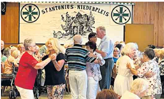
Zwischen den Programmpunkten wurde das Tanzbein geschwungen

Wichtig ist ihm aber auch stets darauf hinzuweisen, dass dieses, wie auch zahlreiche andere Feste in und für Niederpleis, nur durch die tatkräftige Unterstützung der Ortsvereine möglich ist. „Mein Dank gilt dabei besonders der Schützenbruderschaft Sankt Antonius Niederpleis, die mir den Raum zur Verfügung stellt und hinter den Kulissen fleißig mit-