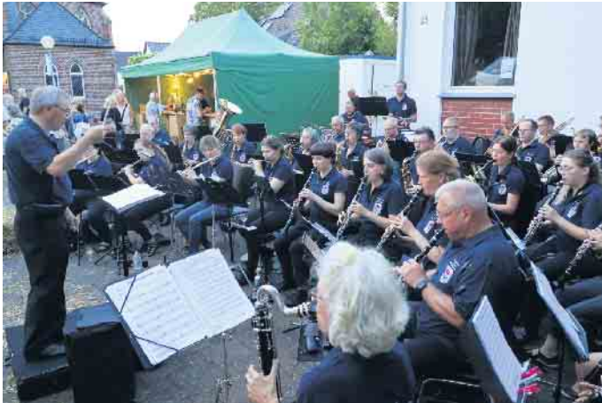
Beim Weinfest der Männerei Meindorf

Das Siegklangorchester ist musikalisch breit aufgestellt und während auf seinen Konzerten (Das Jahreskonzert 2024 findet am 24. November in der Waldorfschule Sankt Augustin statt) auch klassische Musikstücke gespielt werden, hatten hier Melodien aus der Volks- und Popmusik den Vorrang. Nach gut zweieinhalb Stunden Spielzeit mit kurzen Pausen zur Abkühlung des von der Sonne erhitzten Orchesters verabschiedete sich der Siegklang mit dem Siegklangmarsch als Zugabe in das verdiente Restwochenende.