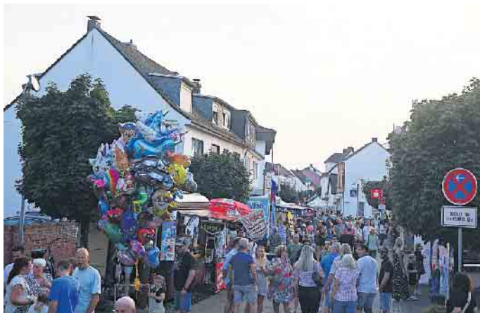
Blick von der Pfarrkirche St. Anna in Richtung Richthofen-Kreisel: Viele Besucher mit guter Laune.

aus: „Aber es hat sich gelohnt.“ Die zahlreichen Besucher des Events bestätigten dies mit guter Laune bis tief in die Nacht. Während tagsüber vielleicht der eine oder die andere aufgrund der recht hohen Temperaturen verzichtete oder den