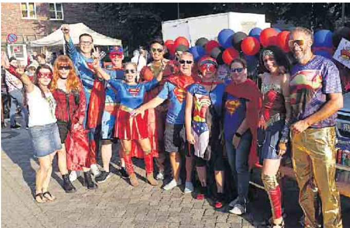
Die Vor- und Vorvorjahressieger vom Rebhuhnfeld, aufwändig dekoriert und kostümiert als „Helden vom Rebhuhnfeld“.