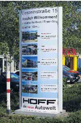
Die neue Hoff-Autowelt in der Einsteinstraße 15 in Sankt Augustin-Menden hat ihre Türen geöffnet.

Am vergangenen Wochenende hat das Autohaus Hoff die Autowelt in Sankt Augustin-Menden eröffnet. Das besondere Konzept am neuen Standort machte die Besucher neugierig.