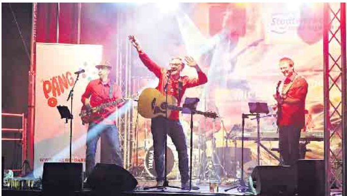
Auf der Bühne der Stadtwerke am Richthofen-Kreisel: Die Kölschrockband PÄNG liefert Bestes aus dem Repertoire der bekannten Kölner Musikgruppen für den Kölschen Abend.

Es bleibt zu hoffen, dass auch bei der Nachkalkulation der Veranstaltung die gute Laune erhalten bleibt und so für das nächste Jahr eine Neuauflage des Spektakels angegangen werden kann. Die Erwartungen sind hoch nach diesem gelungenen Event.