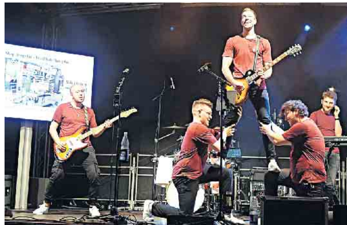
Die Coverband Mad Memories begeisterte auf der KSK Bühne am Josef-Menne-Kreisel: Mit Volldampf durch die Rockhits der letzten 50 Jahre.