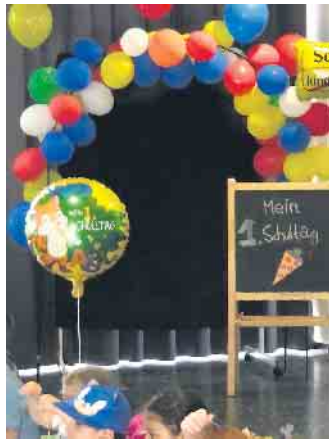
Vor einem geschmückten Hintergrund konnten die Eltern ihre Kinder am ersten Schultag fotografieren.