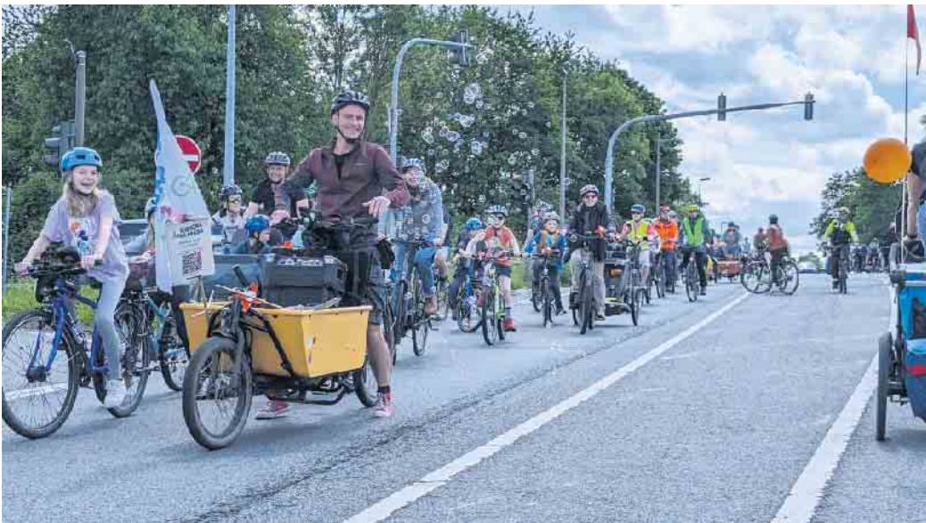
Kidical Mass auf der Bonner Straße.

Das Ziel: Kinder und Jugendliche sollen sich sicher mit dem Rad in ihren Städten bewegen können. Zur Schule, zu Freunden, zum Sport. Das ist in beiden Orten oft nicht möglich, weil ein lückenloses Netz sicherer Radwege fehlt. Auch gute Radwege zu nahegelegenen Nachbarstädten sind für Kinder und Jugendliche wichtig. Für die kleinen und großen Teil-