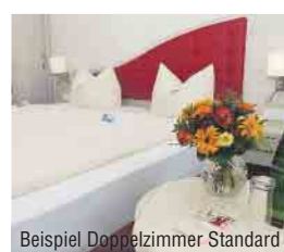
Beispiel Doppelzimmer Standard