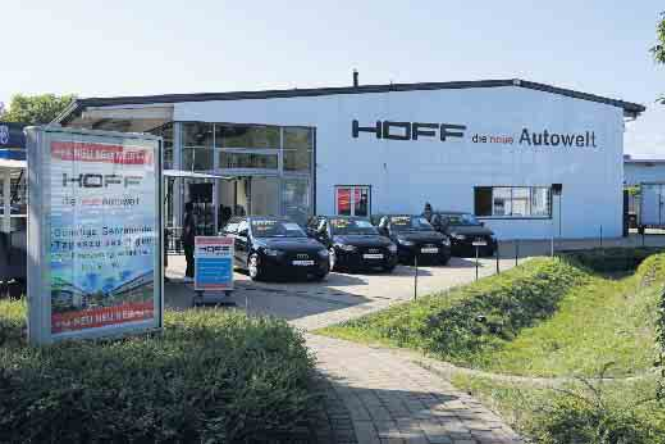
Neuer Standort, neues Konzept: Die Hoff Autowelt bietet Fahrzeuge mit großen Preisvorteilen und kleiner Rate an.