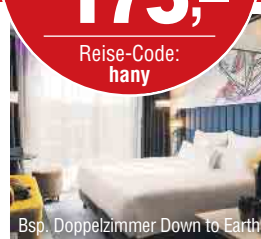
Bsp. Doppelzimmer Down to Earth