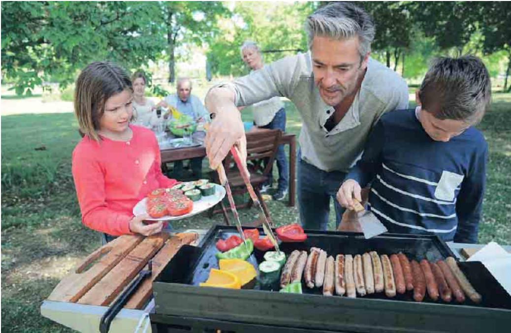
Glühende Kohlen und der unwiderstehliche Duft brutzelnder Würstchen: Besonders Familien nutzen die warme Jahreszeit, um zusammen zu grillen.

Umfragen zufolge gehören bei sieben von zehn Personen Bratwürste beim Grillen einfach dazu.