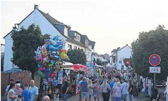
So soll es auch beim 29. Hangelarer Spektakel sein.

und Gemeinschaftssinn gefördert werden soll und auch den Versuch, dem Online-Handel durch persönliche Ansprache und Betreuung etwas entgegen zu setzen. Eröffnet wird das Spektakel am Samstag, 6. September, um 14:30 Uhr, auf dem Richthofen-Kreisel mit dem traditionellen Fassanstich durch den Bürgermeister der Stadt Sankt Augustin. Am Samstag endet das Programm um Mitternacht, um dann am Sonntag, 7. September, von 11 bis