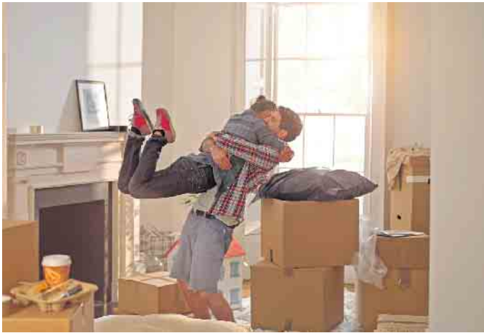
Vorfreude pur: Nach dem Umzug beginnt ein neuer Lebensabschnitt. Damit man sich so glücklich in die Arme fallen kann, ist allerdings vorher viel Planung und Organisation nötig.

Die kompakte zeitliche Checkliste, damit alles reibungslos verläuft