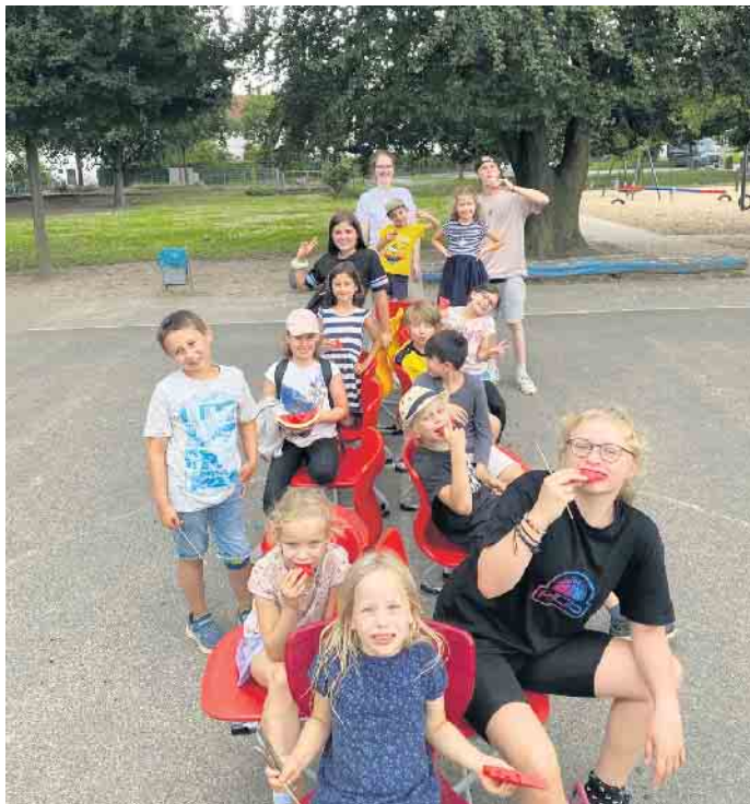
Teilnehmende beim Ferienabenteuer zum Mitgestalten.