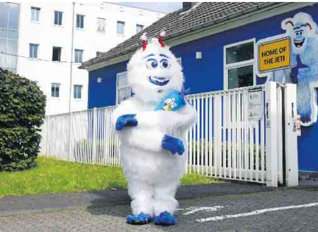
Auch der JETI freut sich auf seine Einschulung.

sie zwei Stunden kostenlos im Innenbereich des beliebten Frei-zeitbades schwimmen. Einzige Voraussetzung: Ein aktuelles Foto mit ihrer Schultüte an der Kasse vorzeigen. Und das ist noch nicht alles: Jeder Erstkläss-ler erhält zudem eine Überra-schung zum Schulstart, die die drei Konzernmaskottchen Trodi-ni, AGGI und JETI sich gemein-sam überlegt haben. „Wir wün-schen allen Schulanfängern ei-nen energiegeladenen Start in die Schule und drücken die Dau-men, dass sie sich turbo-schnell im neuen Alltag zurechtfinden werden. Mit unserer gemeinsa-men Aktion wollen wir zeigen, dass wir als Stadtwerke Trois-dorf, AGGUA TROISDORF und JETLine auch schon für unsere Jüngsten da sind und sie auf ganz unterschiedliche Weise auf ih-rem Weg begleiten werden“, so TroiKomm und Stadtwerke Ge-schäftsführerin Andrea Vogt.