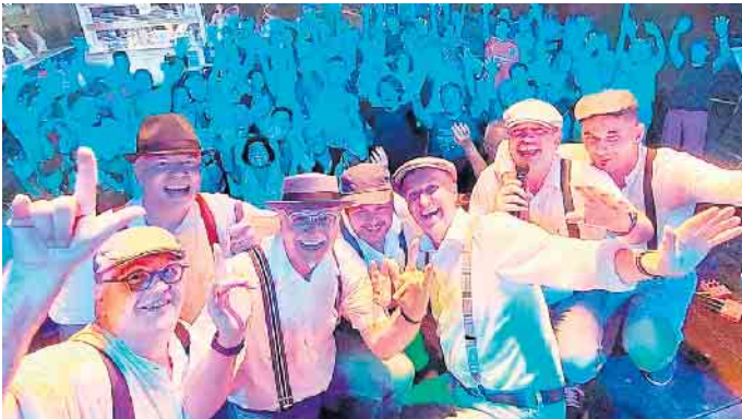
Met Schmackes.

dorf. Von unvergesslichen Hits bis hin zu Ohrwürmern der letzten Jahrzehnte bot die Band zweieinhalb Stunden ein unglaubliches Pro-