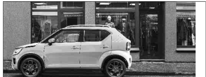
Abbildung zeigt aufpreispflichtige Sonderausstattung.