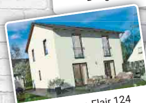
Stadthaus Flair 124