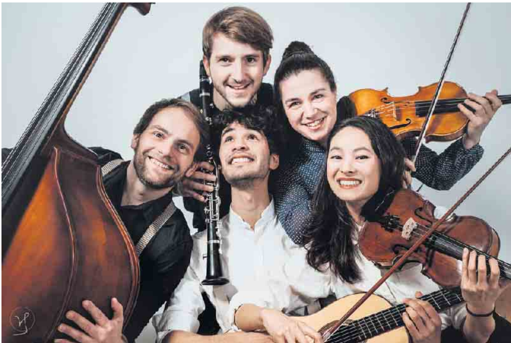
Tovte.