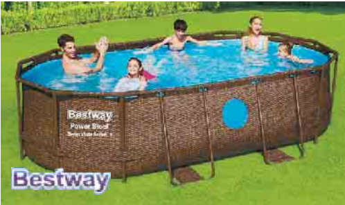
* Beispielhafte Abbildungen