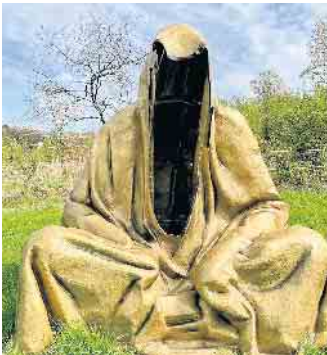
„The Guardian of Time“.

Overath, ein Ort, der vor circa 1.000 Jahren von den Franken besiedelt wurde, war Start und Ziel von 14 Wander:innen des TV Hangelar. Von den knapp 15 Kilometer führte das erste Stück auf einem schattigen schmalen Pfad oberhalb der Agger entlang. Danach schlängelte sich der Weg bergauf nach Maria-Linden. Gut, dass der Weg oft durch den Wald führte, denn es