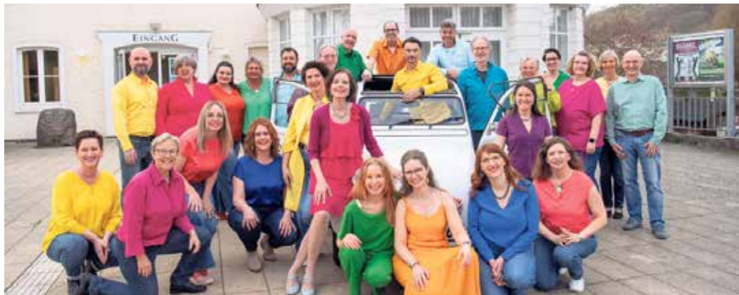
Die KlangFarben im Stadtmuseum.

Gemeinsam ist man weniger allein. Diese alte Weisheit bewahrt sich vor allem dann, wenn unser