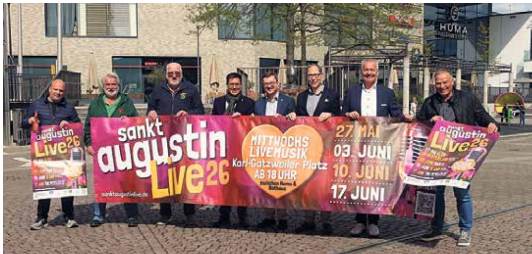
Bürgermeister, Sponsoren, Veranstalter und ehrenamtliche Helfer freuen sich auf die kommenden Konzertabende vor dem Rathaus.

„B. and M“ kommen am 10. Juni. Die beiden Buchstaben stehen für die Musiker Brackelsberg + Müllenschläder, die seit über zehn Jahren mit ihrem Programm mittlerweile deutschlandweit Premium-Entertainment von Disco und Pop und auch