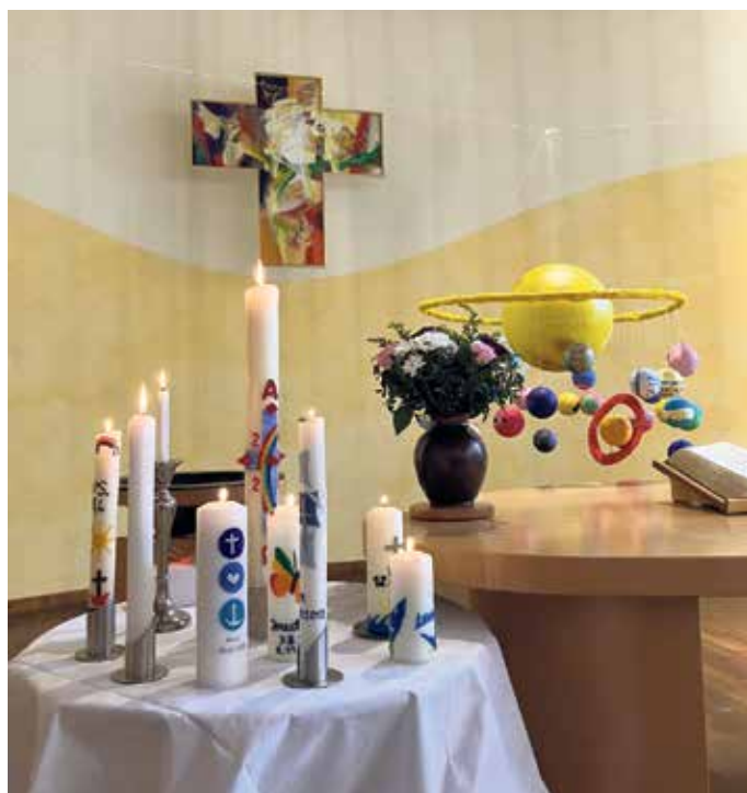
Taufkerzen, Konfirmation 2025