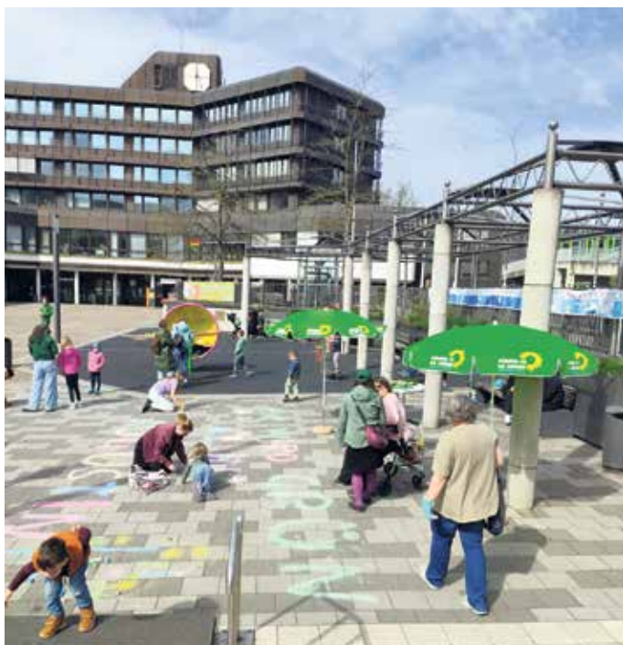
Künstler*innen im Einsatz