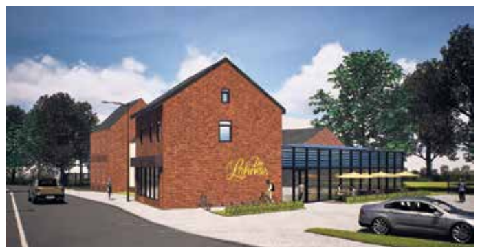
Visualisierung des Neubaus aus dem nahezu gleichen Blickwinkel.

Brötchenholen am Morgen, auf einen Kaffee am Nachmittag oder am Wochenende mit der Familie. Wenn alles nach Plan läuft, sollen Ende 2026 die ersten frischen Brötchen im Pleeser Eck verkauft werden.