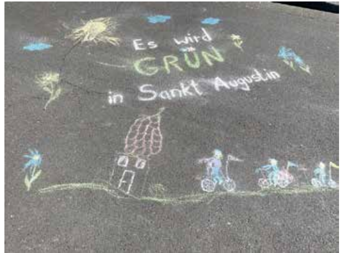
Es wird GRÜN in Sankt Augustin