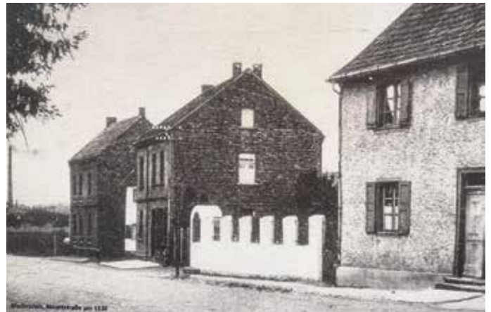
Das „Pleeser Eck“ im Jahr 1930.