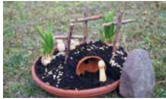
Das Grab ist leer

Herzliche Einladung zur Osternacht für Familien mit Kindern am Kar Samstag, 4. April, um 18 Uhr auf dem Außengelände des Familienzentrums St. Anna in der Graf-Zeppelin-Str.9, Hangelar. Bei Regen findet das Treffen im Pfarrheim St. Anna, Franz-Jacobi-Str., Sankt Augustin-Hangelar statt. Anschließend daran findet für die Kinder eine Ostereisuche statt. Um 21:30 Uhr findet dann die Osternacht in der Pfarrkirche St. Anna