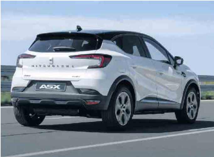
Neuer ASX: Interessantes Design, moderne Details; Länge/Breite/Höhe: 4,22/2,03/1,58m; Kofferraum: ab 326l

mehr Käufer für die Hybridversion gibt. Denn das Aufladen der Batterie an Privathäusern sei noch sehr eingeschränkt möglich. Der Plug in-ASX (68 kW/92 PS plus 49 kW/67 PS-Elektromotor) ist 170 km/h schnell. Elektrisch sind 135 km/h möglich. Preis: 39.390 Euro. Der erste Fahreindruck mit der HEV-Version: das Zusammenspiel der Motoren klappt gut. Der Fahreindruck ist dynamisch. Besonders gefallen hat mir das Kurven- und Lenkverhalten. Und die Verarbeitung des in Spanien produzierten ASX macht einen guten Eindruck. Zudem bietet Mitsubishi eine 5 Jahres-Garantie und 8 Jahre auf die Fahratterie. Werner Müller