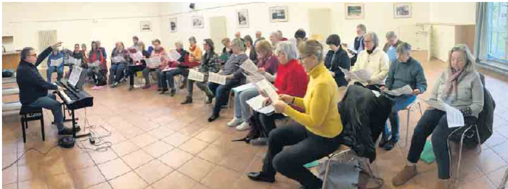
Gemischter Chor des MCB bei der Probe.

Die Jahreshauptversammlung des Männerchors 1872 Birlinghoven e.V. (MCB) kam einer kleinen Zeitenwende gleich. Ob in den 150 Jahren seiner „Männergeschichte“ jemals Frauen in einer Jahreshauptversammlung gesichtet wurden, lässt sich heute nicht eindeutig klären. Im 151. Jahr seines Bestehens war es aber so weit: Erstmals waren Frauen des gemischten Projektchors eingeladen, um den Aufbruch des MCB in eine neue Zukunft mit zu gestalten. Nachdem die im Herbst aufgenommene Probenarbeit vielversprechend Fahrt aufgenommen hat, immerhin nehmen regelmäßig mehr als 30 Frauen und Männer an den wöchentlichen Proben teil, geht es jetzt darum, den ersten Auftritt auf großer Bühne vorzubereiten. Beim traditionellen Schlosskonzert am 5. und 6. Mai wird der Männerchor nicht nur in bewährter Weise von den Sängern des MGV „Lebenslust“ Niederpleis unterstützt, sondern ein Block mit vier Liedern ist allein für den gemischten Projektchor vorgesehen. Neben dieser Zukunftsperspekti-