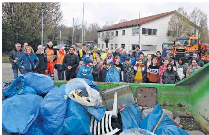
Ein gut gefüllter Container voll Müll jeglicher Art sind das sichtbare Zeichen für den Unrat im Sankt Augustiner Umfeld aber auch für den Fleiß der Müllsammler.