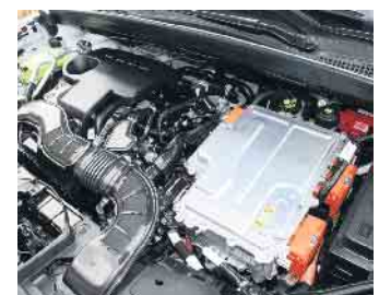
Hybridantrieb mit insgesamt 143 PS aus Benzin- und Elektromotor. Verbrauch: ca. 5,0 l/100 km