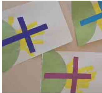
Jesus ist auferstanden

Herzliche Einladung zur Osternacht für Familien mit Kindern am Karsamstag, 8. April, um 18 Uhr auf dem Außengelände des Familienzentrums St. Anna in der Graf-Zeppelin-Str.9, Hangelar. Das Vorbereitungsteam der Kinderkirche bittet eine Picknickdecke und selbstgestaltete Kerzen mitzubringen. Bei Regen findet das Treffen im Pfarrheim St. Anna, Franz-Jacobi-Str. statt.