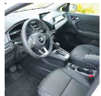
Hübsches Cockpit, großer Bildschirm

Autohaus Weidenbrück GmbH Langbaughstr. 12 53842 Troisdorf Telefon 02241/96020 www.autohaus-weidenbrueck.de