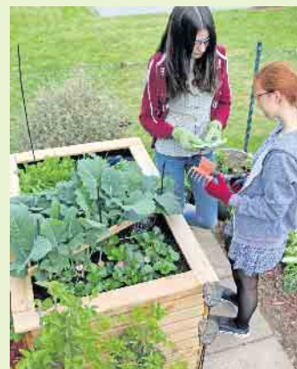
Hochbeete ermöglichen ein flexibles und rückschonendes Gärtnern. Mit Bausätzen aus Holz ist das Beet schnell errichtet.

Egal ob Sichtschutz, Palisaden, Terrasse oder Gartenhäuschen: Holz im Außenbereich benötigt eine sachgemäße und regelmäßige Pflege. Unbehandelt wird es silbergrau, behält aber seine technischen Eigenschaften. Gartenmöbel, die nicht direkt der Witterung durch Regen oder Spritzwasser ausgesetzt sind, können mit einem Holzschutz-Öl gepflegt werden. Zäune, Spielgeräte und Pergolen, die direkt bewittert sind, können mit wasserabweisenden Anstrichen vor Schäden geschützt werden. Bei Pfosten, Zaunriegeln, Gartentoren und Latten ist