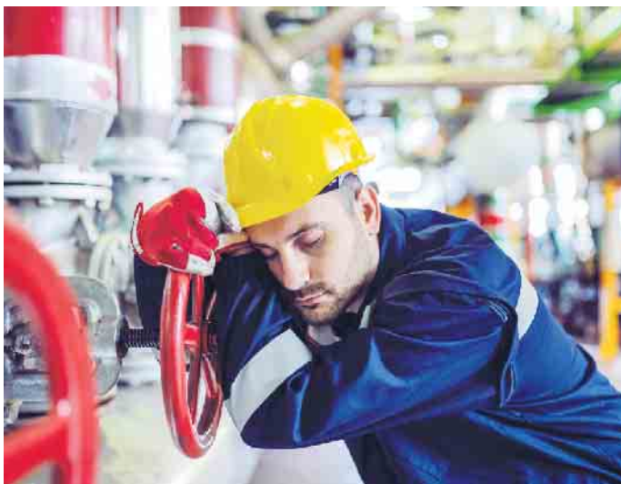
Übermäßig lange Arbeitstage kosten viel Kraft und können auf Dauer krank machen. Deshalb setzt das Arbeitszeitgesetz klare Grenzen.

arbeitsschutzgesetz sind acht Stunden täglich das Maximum, der Unterricht in der Berufsschule muss dabei als Arbeitszeit berücksichtigt werden. (djd)