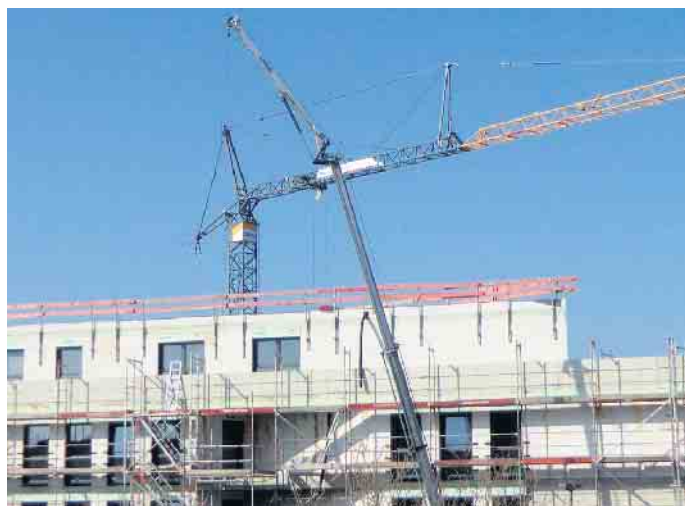
Zu wenig Wohnraum

Baulandmobilisierungs-Verordnung NRW: Sie gibt 95 Städten neue Instrumente in die Hand. Sie gilt auch in Sankt Augustin, weil dort die ausreichende Versorgung der Bevölkerung mit Mietwohnungen zu angemessenen Bedingungen nach § 201a BauGB nicht gewährleistet oder besonders gefährdet ist. Die Baubehörde kann