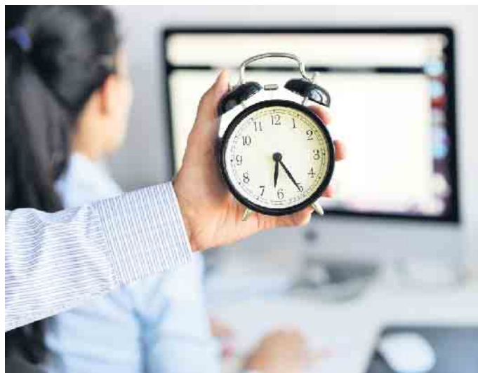
Zulässige Höchstarbeitszeiten sind gesetzlich geregelt.