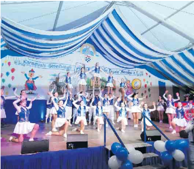
Blue Royal ließ die Stimmung im Zelt überkochen