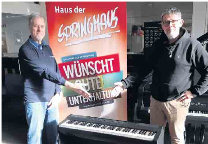
Abholung des Hauptpreises bei Klavins

herzlichen Glückwunsch. Wir danken allen Loskäufern und Spendern für die Unterstützung. So haben sie mitgeholfen, dass es in Bonn auch weiterhin Kultur auf Spitzenniveau gibt. Und das ganz besonders in unserem schönen Theater Haus der Springmaus.