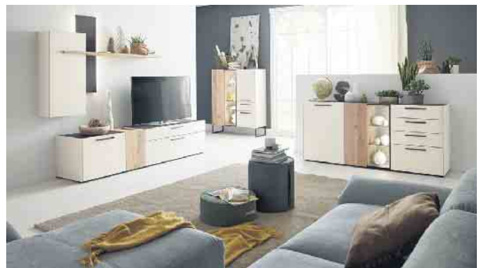
Mit Stauraum allein ist es bei Schränken nicht getan, denn sie sollen dauerhaft schön und sicher sein.

lich oder ganz gezielt Stauraum bieten Fächer und Sortiersysteme hinter Türen oder in Schubkästen. Klassiker wie das Schrankbett zum Ausklappen oder ein praktischer Heimarbeitsplatz im Schrank sind weitere pfiffige sowie platzsparende Einrichtungsideen. „Und wer eine maßangefertigte Stauraumlösung beispielsweise für eine Dachschräge oder für unter der Treppe benötigt, findet ebenfalls qualitätsgeprüfte Anbieter mit dem ‚Goldenen M‘, die jeden individuellen Wunsch in die Tat umsetzen“, sagt der DGM-Geschäftsführer. DGM/FT