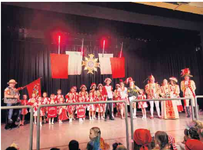
Tanzflöhe und Kinder mit ihren neuen Turnbeuteln

sowie eine passende Trinkflasche. So können die bevorstehenden Auftritte noch besser gemeistert werden. Unsere Kleinsten sind der Nachwuchs von morgen. Wir sind stolz auf euch und froh, dass ihr ein Teil der Prinzengarde seid. Wer gerne bei uns mittanzen möchte, kann gerne bei einem Schnupper-Training vorbeischauen. Alle weiteren Infos hier auf unsere Homepage: www.prinzengarde-sankt-augustin.com/schnupper-training.html