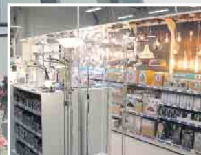
Abb. sind Beispiele! Produkte in Ausstellungen und Lager können abweichen!

KLEIN BAUSTOFFE Baumarkt Brennstoffe FUTTERMARKT