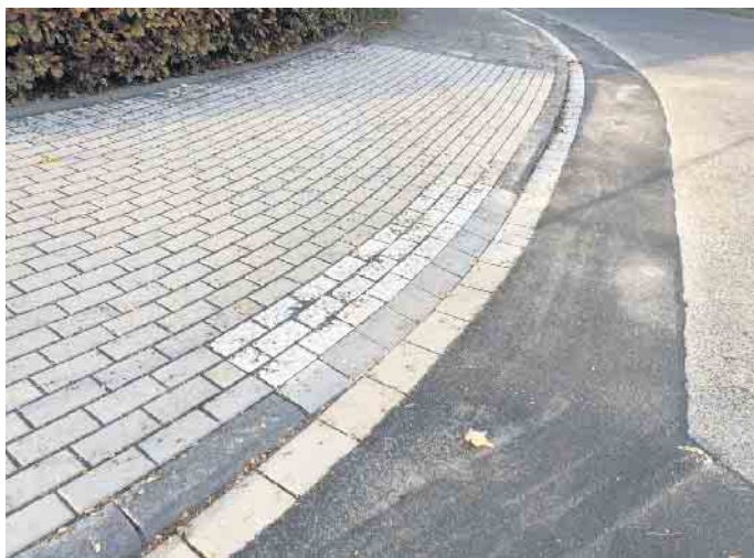
Abgeflachte Bordsteine - ein wichtiger Beitrag zur Barrierefreiheit

Die Stadtverwaltung erstellte in Zusammenarbeit mit den Ortsvorsteher*innen einen Plan, welche Kreuzungen barrierefrei umgestaltet werden sollen. Dabei stand im Vordergrund der Überlegung, welche Wegebeziehungen den Menschen wichtig sind. So sind zunächst vorrangig die Kreuzungen umgestaltet worden, die von vielen Menschen benutzt werden, sei es auf dem Weg zu den Kirchen, den Schulen oder den Kindergärten. Natürlich wurden die Vorgaben für Blindenleitsysteme mit kontrastreichen Material und Noppensteinen beachtet, damit Blinde und sehbehinderte Menschen die Übergänge ebenfalls sicher nutzen können. Die GRÜNEN