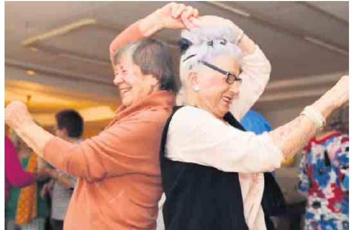
„Tanzen in der Gruppe“ ist ein neues Angebot des Vereins „Leben mit Krebs“.

statt. Am 25. Februar startet das neue Angebot mit einem Schnuppertermin. Die weiteren Termine, zunächst bis zu den Sommerferien: 11., 18. und 25. März, 22. April, 6., 13., 20. Mai und 10. Juni. Weitere Informationen und verbindliche Anmeldung bis zwei Wochen vor Angebotsbeginn bei Carine Wester unter c.wester@lebenmitkrebs-rsk.de oder Telefon 02246/6060 beziehungsweise 0157/88026253.