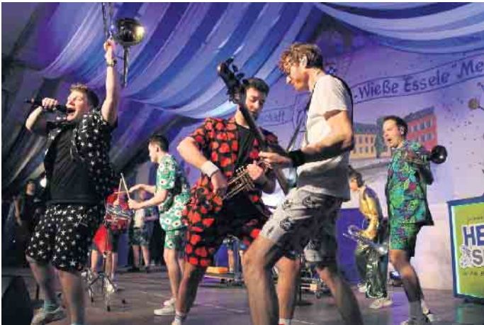
Druckluft überzeugte mit Beats der Extraklasse

am vergangenen Samstag mit der traditionellen Herrensitzung bereits das nächste Highlight auf die Mendener Karnevalisten. Die Möglich-