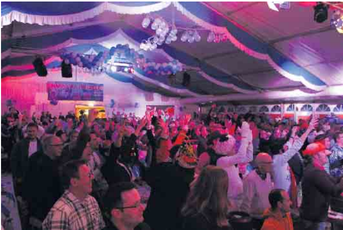
Die Herren im Mendener Zelt feierten ausgelassen

Herrensitzung der KG Blau-Wieße Essele begeistert Mendener Jecken