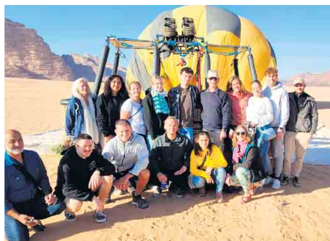
Ballonfahrt im Wadi Rum