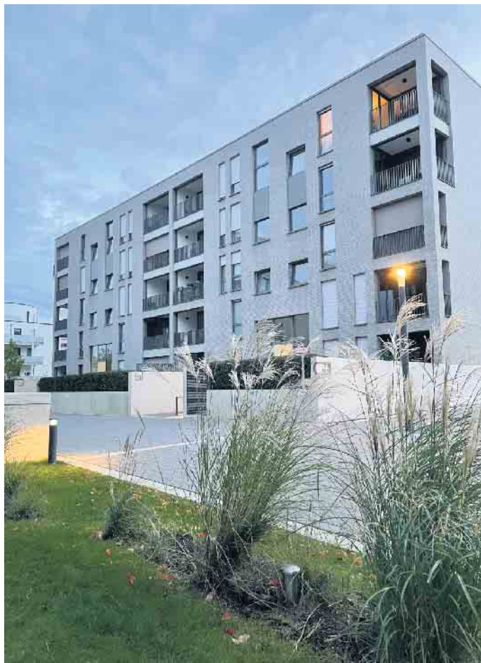
Auch bei Großprojekten der richtige Partner: ROLF Fensterbau

möglich die neuen eingesetzt.“ Auch die Dämmung der Fenster wurde erneuert - ein zusätzlicher Zeitfaktor, der aber für die Wärmeeffizienz des Hauses entscheidend ist. Meist steht bei Sanierungsarbeiten dieser Art die Steigerung der Energieeffizienz eines Hauses im Fokus. Viele ältere Fenstermodelle besitzen oft noch eine klassische Einfachverglasung. Das Problem solcher Fenster ist ihre hohe Ineffizienz im Hinblick auf den Wärmeverlust. „Wir arbeiten nur noch mit Fenstern der neusten Generation, die eine Zwei- oder Dreischeiben-Isolierverglasung aufweisen“, berichtet der Profi. Da Nachhaltigkeit bei ROLF Fensterbau einen hohen Stellenwert hat, werden die alten Fenster nicht sofort entsorgt. Die Kunststoffrahmen werden zerkleinert und die Materialien voneinander getrennt, sodass sie recycelt und daraus neue Produkte gefertigt werden können. Der Fenstertausch des Großbauprojekts konnte binnen weniger Wochen erfolgreich abgeschlossen werden. „Wichtig ist, dass man die Arbeit von einem Experten durchführen lässt. Das erspart nicht nur einiges an Zeit, sondern auch nachträgliche Reparaturen durch entstandene Fehler“, ergänzt Alefelder.