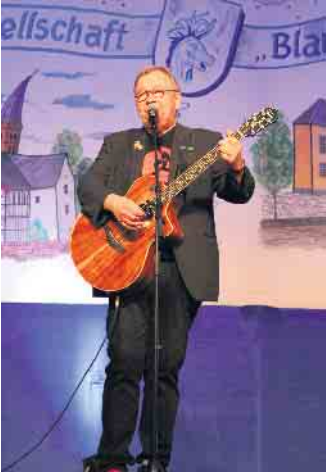
Bernd Stelter ist immer wieder gern gesehener Gast im Festzelt