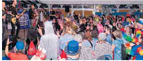
Die Paveier brachten das Zelt zum Kochen

Nach unendlich langen drei Jahren Wartezeit steht am Sankt Sebastianus-Platz in Menden endlich wieder das Festzelt der KG Blau-Wieße Essele. Erstmals wurde die Session im Zelt am vergangenen Freitag mit dem Essele-Danz eröffnet, der Kostümparty im Zelt. Obwohl dieses neue Format erst zum zweiten Mal veranstaltet wurde, hat sich die Besucherzahl im Vergleich zum letzten Mal auf über 800 Besucher mehr als verdoppelt. Verwunderlich ist dies angesichts eines herausragenden Programms selbstverständlich nicht. Eröffnet wurde der Abend von der neuen Tanzgarde der KG, die vom 1. Jugendtambourcorps Menden hereingespielt wurde. Die Seniorengarde zeigte sofort, warum sie bei der letzten Deutschen Meisterschaft einen beachtlichen 4. Platz erreicht hat. Auch den Minis und Kindern merkte man ihr Lampenfieber bei