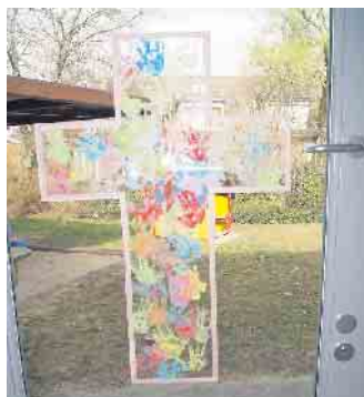
Fensterkreuz von Kindern gestaltet

Die Ehrenamtlichen freuen sich über viele kleine und große Besucher.