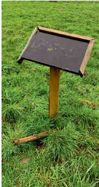
Zerstörte Informationstafel der Stadt Sankt Augustin.

Augustin eine Belohnung von 250 Euro ausgesetzt. Sachdienliche Hinweise werden unter 01722500668 entgegengenommen.