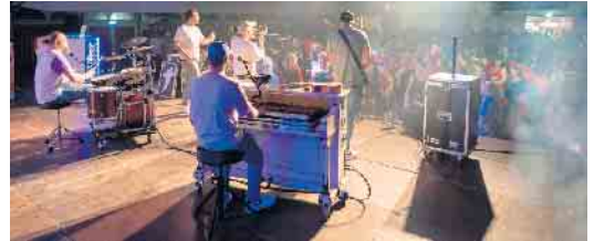
Lupo hatte für alles ein Wort, nur „für die Liebe nit“

ihrem ersten richtig großen Auftritt nicht an. Als der erste musikalische Topact die Bühne betrat, war das Zelt schon prall gefüllt. Songs wie „Für die Liebe nit“ und „Claudia“ ließen die Stimmung kochen. DJ Fosco schaffte es gekonnt, die Stimmung auch zwischen den Live-Acts ungebrochen hoch zu halten. Die Paveier, die wenig später die Bühne betraten, genossen die fantastische Stimmung im Zelt sichtlich und spielten folgerichtig deutlich länger als sie eigentlich gebucht waren. Auch die Domstürmer, der letzte Live-Gast