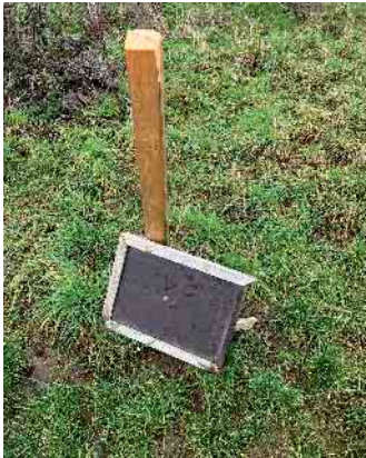
Zerstört - Informationsschild Naturprojekt im Heidfeld

Wahrscheinlich in der Nacht von Sonntag, 16. Januar, auf Montag, 17. Januar, haben Unbekannte insgesamt vier Informationstafeln zu Naturschutzprojekten komplett entfernt oder zerstört. Zwei waren von der Stadt Sankt Augustin aufgestellt worden und gaben u.a. Hinweise auf die Einsaat einer Naturwiese, zwei weitere gehörten zu den Naturschutzprojekten des Diplom Biologen Andreas Fey. Die Schilderrahmen wurden dabei brutal aus der Verankerung gerissen und die Informationstafel in die Felder geschleudert. In einem Fall fehlte sogar das Schild inklusive des Standpfostens. Ausgangspunkt war die städtische Wiesenfläche an der Fachhochschule und dann von dort weiter Richtung des Naturprojektes der Feldscheune Kelz.