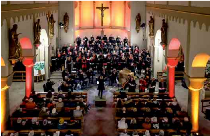
Aufführung des Kirchenoratoriums „Die Geburt Christi“ von Heinrich von Herzogenberg am 4. Dezember in St. Margareta, Königswinter-Stieldorf

Gottvertrauen getragen. Im zweiten Halbjahr, beispielsweise am 16. September, um 15 Uhr, in Holzlar, lädt der Chor zum Hören und Mitsingen fröhlicher Herbstlieder bei Kaffee und Kuchen ein. Der Erlös kommt in diesem Jahr dem Freundeskreis Evangelischer Chor Hangelar-Holzlar e.V. zugute. Das volle Programm und weitere Informationen finden Sie unter www.holzlar.evangelisch.de Alle, die im Chor gern mitsingen möchten, sind herzlich zur Chorprobe mittwochs, 19.45 bis 21.30 Uhr, eingeladen. Wir sind ein sehr geselliger Chor mit momentan 44 aktiven Sänger:innen. Neben der Gestaltung von Gottesdiensten in drei Gemeinden bereiten wir in Kooperation mit befreundeten Chören in der Regel ein größeres Konzert vor, als Herausforderung für die Sänger:innen, als Ohrenschmaus für alle