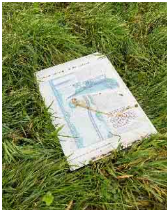
Weggeworfen - Informationstafel zum Naturprojekt der Feldscheune Kelz