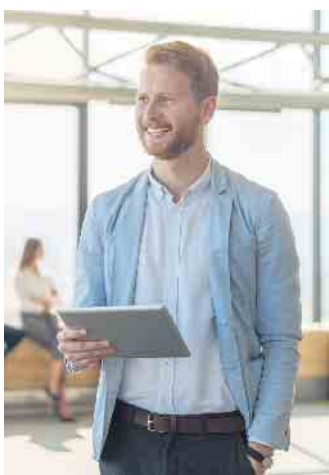
Die fortschreitende Digitalisierung verändert die Anforderungen an die Beschäftigten im Bankwesen rasant.

Hierarchien bieten ein hohes Maß an Gestaltungsspielraum und Verantwortung. „Dass alle wichtigen Entscheidungen in der Bank vor Ort getroffen werden, ist gerade für angehende Führungskräfte ideal“, erläutert der Experte. (djd)