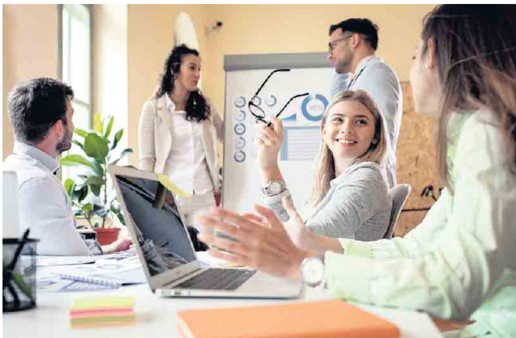
Kommunikative Fähigkeiten sind bei angehenden Bankkauffleuten besonders gefragt.