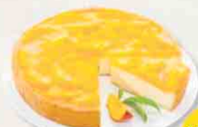
PFIRSICH-RAHM- KÄSE-TORTE 2.400 g | 14 Portionen