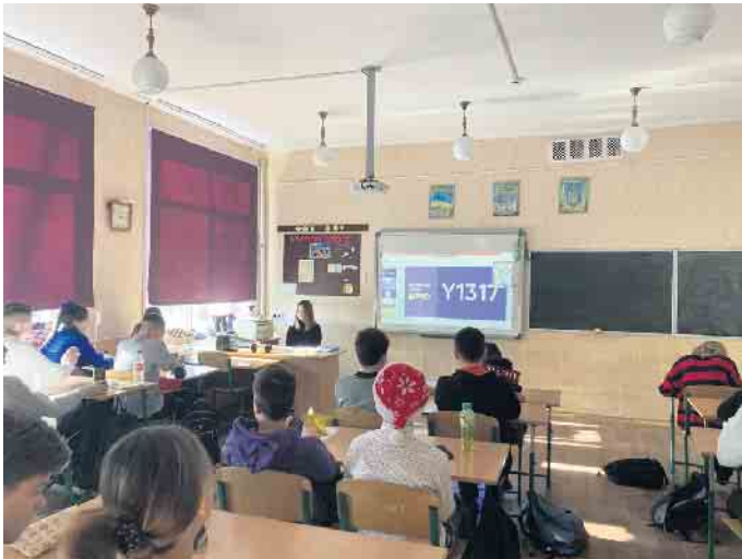
Klassenraum vor der Zerstörung

Sankt Augustiner Vereine unterstützen Schule in der Ukraine