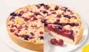
KIRSCHKUCHEN MIT BUTTERSTREUSELN 1.700 g