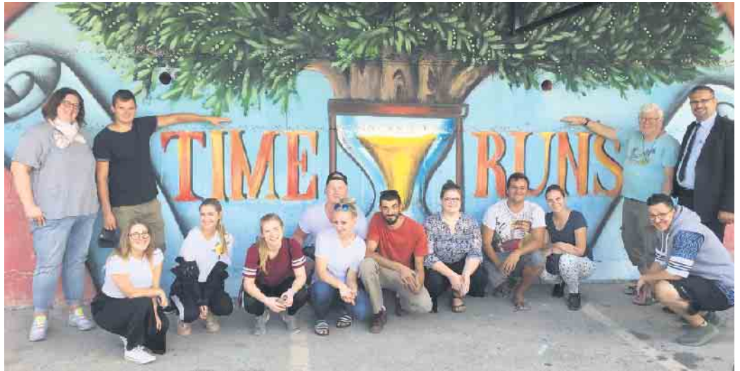
Kunstprojekt in Bethlehem, Foto: Gregor Schröder

Bewerbungsfrist bis 31. Januar per E-Mail an: schroedergregor@aol.com ; Infos unter 0163-6335535