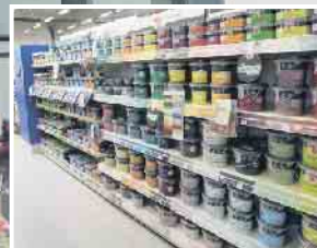
Abb. sind Beispiele! Produkte in Ausstellungen und Lager können abweichen!

KLEIN BAUSTOFFE Baumarkt Brennstoffe FUTTERMARKT