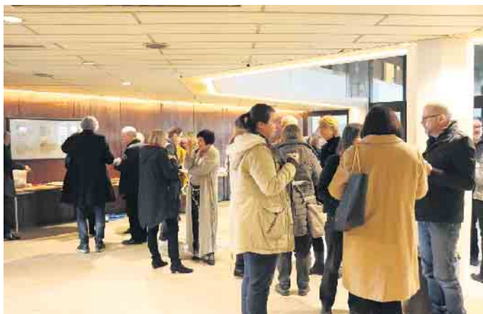
Die Teilnehmenden der Sozialkonferenz im Gespräch.