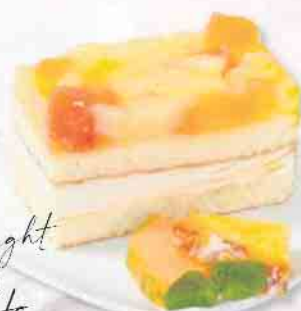
JOGHURT-EXOTIC-SCHNITTE 2.000 g | 12 Portionen