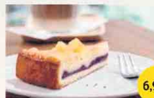
APPLE-CASSIS-CAKE 1.170 g | 12 Portionen