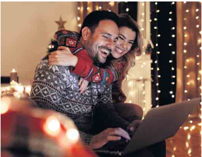
Im privaten Bereich wollen viele Menschen in diesem Jahr bei der Weihnachtsbeleuchtung sparen - über ein öffentliches Lichtermeer würden sich die meisten dagegen freuen.

Tonnen CO 2 . Sollten tatsächlich ein Drittel aller Haushalte weniger oder gar keine Beleuchtung nutzen, könnten bis zu 6,8 Milliarden Lämpchen und damit immerhin rund 73.000 Tonnen CO 2 eingespart werden“, rechnet Ata Mohajer vor. Besonders nachhaltig für das Klima wäre der vollständige Umstieg auf Ökostrom - dann könnte die gesamte Menge an CO 2 vermieden werden. (djd)