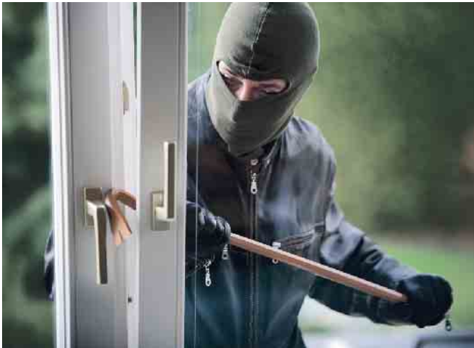
Gekippte Fenster bieten Einbrechern ideale Einstiegshilfen.