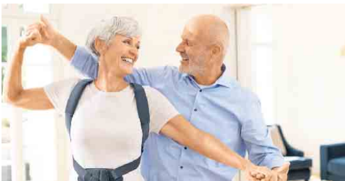
Komm, tanz mit mir: Eine Rückenorthese bietet Patienten mit osteoporotischen Wirbelkörperfrakturen wieder mehr Mobilität im Alltag.

ordnen. Im Fachhandel wird die Rückenschiene vom Orthopädie-Techniker an die Wirbelsäule angepasst und dann in eine gepolsterte Rückentasche geschoben. Zum Einsatz kommt eine solche Rückenorthese auch bei einem Rundrücken sowie bei Juvenile Morbus Scheuermann, einer Wirbelsäulenerkrankung im Jugendalter, die oft mit Fehlhaltungen und Schmerzen einhergeht. (djd)