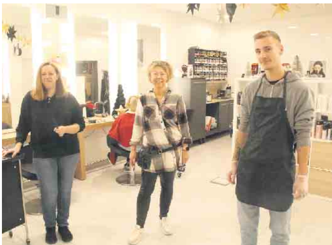
Anlässlich des dreijährigen Bestehens gibt es eine Glücksradaktion im Egge-Kamm.