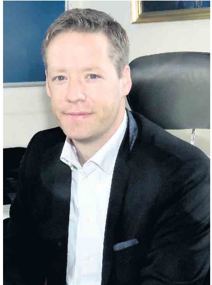
Bürgermeister Matthias Möllers

Eine neue Photovoltaikanlage auf dem Dach der Buker Grundschule erzeugt einen Großteil des Eigenbedarfs und mittels eines Handlungskonzeptes für Starkregen-Ereignisse wollen wir den Hochwasserschutz weiter ausbauen. Wir haben kräftig in die Real- schule investiert, der geplante Wohnpark Egge wurde REGIONALE-Projekt, ein Strukturentwicklungsprogramm des Landes Nordrhein-Westfalen mit Zugang zu Fördermöglichkeiten, in Buke wurden die Arbeiten zur Umgestaltung der Teichanlage Am Spring fortgeführt, wir haben am Triftweg in Schwaney ein passendes Grundstück für die neue Kita gefunden und unser Viadukt erhielt eine neue, energieeffiziente Beleuchtung. Es gäbe noch viele kleinere oder größere Dinge zu nennen, die wir in diesem Jahr begonnen oder umgesetzt haben und auch im nächsten Jahr haben wir viel