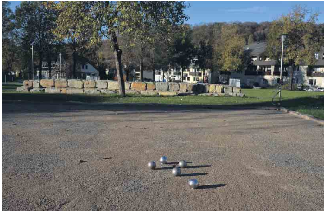
Um Boule zu spielen, bedarf es keiner spezifischen Vorerfahrung. Die Regeln sind schnell gelernt.

(oder zwei Spieler) treten gegeneinander an. Es geht darum, seine eigenen Kugeln näher an einer kleinen Zielkugel zu platzieren als die des Gegners und auf diese Weise Punkte zu machen. Wer am Ende 13 Punkte erreicht, gewinnt das Spiel.