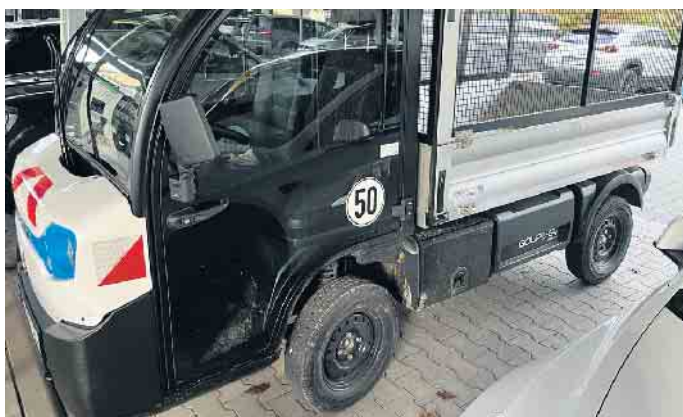
Der multivariable e-Allzwecktransporter Goupil G4 erfüllt alle technischen Anforderungen, die für ein effizientes Arbeiten notwendig sind.

Ziel des Programms REACT-EU ist es, die wirtschaftlichen und sozialen Folgen der COVID-19-Pandemie abzumildern, klimafreundliche Technologien zu fördern sowie die digitale und stabile Erholung der Wirtschaft zu unterstützen. Mit einer Fahrzeugbreite von nur 1,32 m, einer Höchstgeschwindigkeit von 50 km/h und einer Zuladung von bis 1200 kg erreicht der G4 eine Reichweite von 70 bis 90 km. Damit ist das Leeren von Abfallbehältern, der Transport der thermischen Unkrautbekämpfungsanlage, die Abfuhr von Laub und vieles mehr