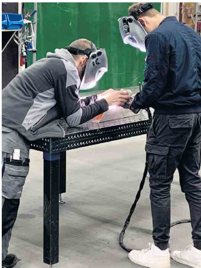
Schweißarbeiten am 3D-Schweißtisch

Der Jahrgang 9 der Gesamtschule besucht das Unternehmen Playparc