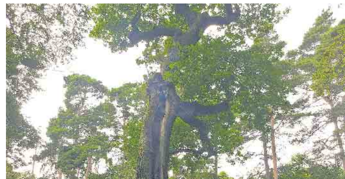
Bereits geschädigte Bäume können mit biologischen Vitalkuren neue Lebenskraft gewinnen und noch lange durch ihre Schönheit erfreuen.

Vitale Kraft spendet die Behandlung aber nicht nur älteren Pflanzen, als Anwachshilfe bei Neuanpflanzungen oder Umpflanzungen leistet sie ebenfalls gute Dienste. Sie gibt Gehölzen optimale Startbedingungen und trägt so dazu bei, dass sich auch folgende Generationen an kräftigen, gesunden Bäumen erfreuen und von ihrem volkswirtschaftlichen Wert profitieren können. Und den taxiert der NABU für die 100-jährige Eiche auf mehr als 250.000 Euro - zum Beispiel für die Erhaltung der Bodenfruchtbarkeit, die Stabilisierung des Wasserhaushalts oder Schutzfunktionen gegen Wind, Lärm, Hitze oder Erosion. Die Bäume tun also einiges für uns Menschen - Zeit, dass wir ihnen etwas zurückgeben. (djd)