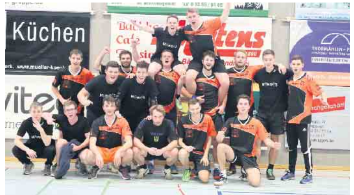
Impressionen vom Connex-Cup 2022.

Kassel vom 24. bis 29. Juli. Informationen zu den Teams der HSG-Jugend, deren Trainingszeiten und Spielpläne sowie zu den anstehenden Events finden sich stets aktuell auf der Homepage unter hsg-ab.de .