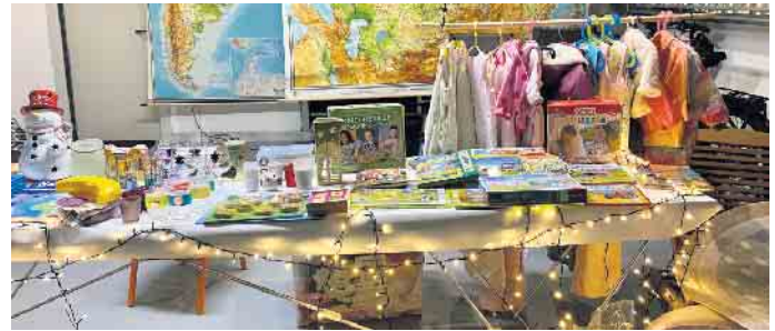
Holzschnitzereien, Selbstgemachtes und Schönes an den Flohmarkt-Ständen