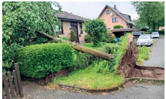
Dieser entwurzelte Baum kippte auf ein Wohnhaus.