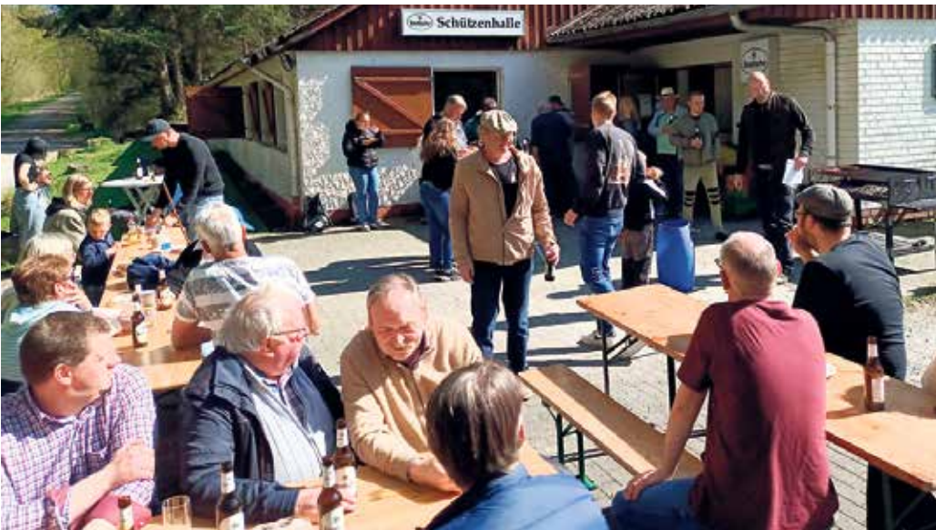
Im Driburger Grund angekommen, erwartete die Bollerborner ein gemütlicher Nachmittag bei bestem Wetter. Auch Nicht-Wanderer waren am Nachmittag herzlich willkommen und nutzten die Gelegenheit, am geselligen Beisammensein teilzunehmen.