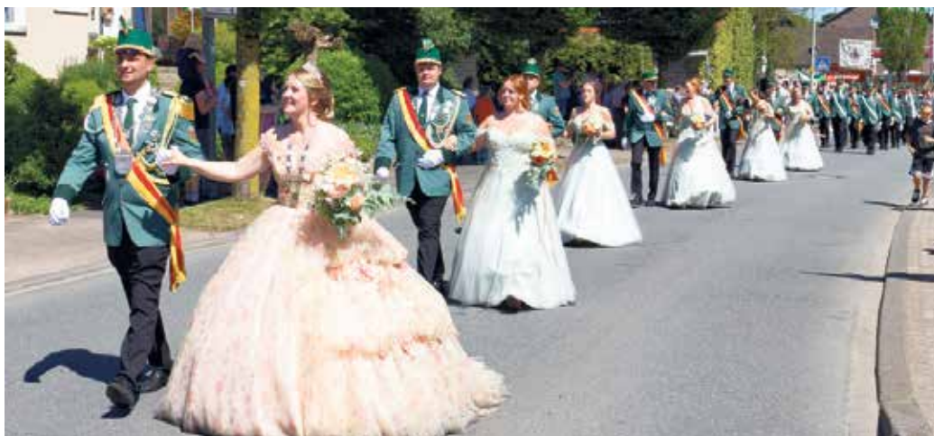
Königspaar und Hofstaat beim Umzug am Pfingstmontag

Drei Tage Sonnenschein, volle Straßen, beste Stimmung und ein Königspaar, das Schwaney begeisterte: Die St. Sebastian Schützenbruderschaft Schwaney 1733 e. V. blickt auf ein außergewöhnlich stimmungsvolles Schützenfest vom 24. bis 26. Mai zurück.