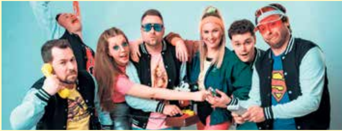
Am Samstagabend geht es mit „The 80s 90s Liveband“ mit einer außergewöhnlichen Live-Performance zurück in die Vergangenheit.