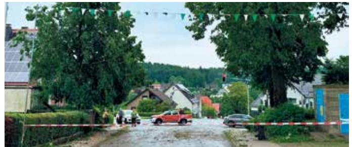
Umgestürzte Bäume sorgten an mehreren Stellen im Gemeindegebiet für Behinderungen und Gefahren.