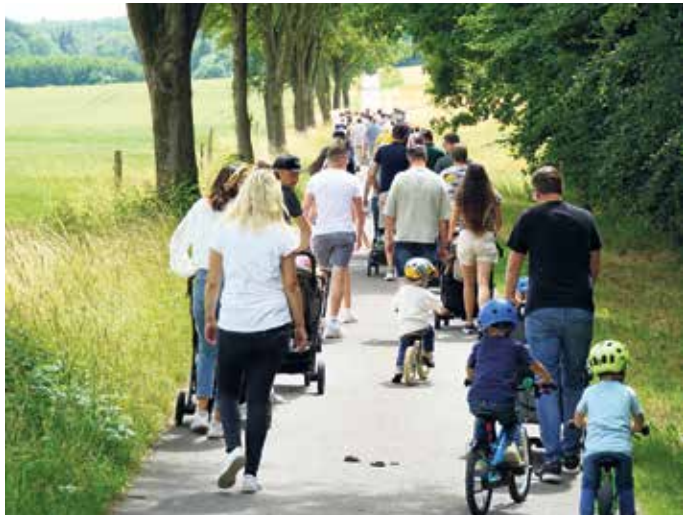
Wanderung durch die Schwaneyer Feldflur

Spiele, vom Wikingerschach über die KLJB-Kletterkiste bis hin zur Hüpfburg ist alles dabei. Zum Abend hin werden die Kompanien den Grill anfeuern und knusprige Pommes und Bratkartoffeln zubereiten. Es wird ein UKB von 10 Euro pro Person erhoben. Kinder bis 18 Jahre sind kostenfrei willkommen. Um besser und nachhaltig mit dem Essen planen zu können, bitten die Kompanien um Anmeldungen bis zum 22. Juni bei den Schriftführern Stephan Dreyer (0171 / 310 26 12) oder Louis Stangier (0176 / 576 690 90). Sollte die Mitnahme durch die Kutsche gewünscht sein, wird um einen kurzen Hinweis gebeten.