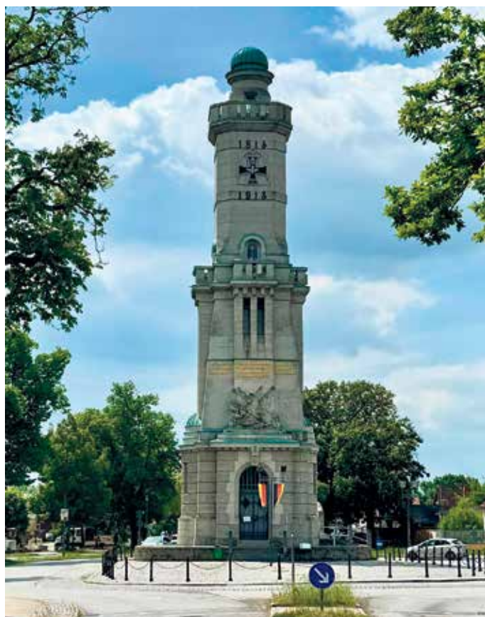
Der Gedenkturm an die Schlacht bei Großbeeren 1813 ist ein 32 Meter hohes, denkmalgeschütztes Bauwerk

Das Programm des Besuchs war vielfältig und bot zahlreiche Gelegenheiten für Austausch und Begeg-