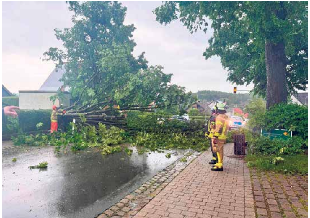
Feuerwehr und Bauhof arbeiteten stundenlang Hand in Hand, um die Folgen des Unwetters zu bewältigen.

Einsatzes von Bauhof, Feuerwehr und weiteren Helfenden konnten größere Schäden verhindert und wichtige Verkehrswege schrittweise wieder freigegeben werden. Die Aufräumarbeiten nahmen zwar noch einige Zeit in Anspruch, doch die Gemeinde arbeitete zügig daran, die Folgen des Unwetters zu beseitigen und den Alltag möglichst schnell wiederherzustellen.