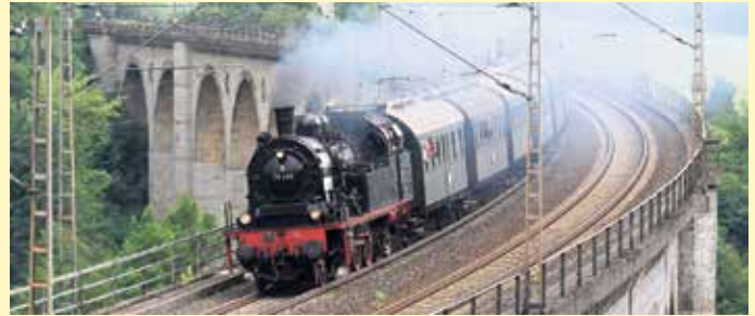
Dampflok auf dem Altenbekener Viadukt