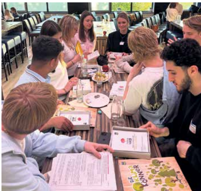
„Generation Zukunft: Nachhaltig handeln, Umwelt bewahren“: In Workshops arbeiteten die Jugendlichen an Projektideen zum Thema.