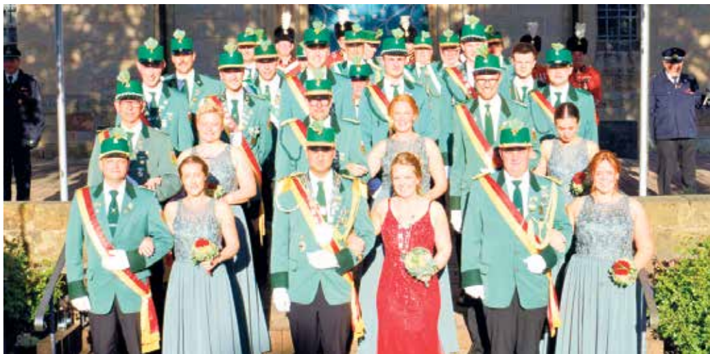
Aufstellung am Pfingstsonntag beim Zapfenstreich

St. Sebastian Schützenbruderschaft feierte ein rauschendes Schützenfest an Pfingsten