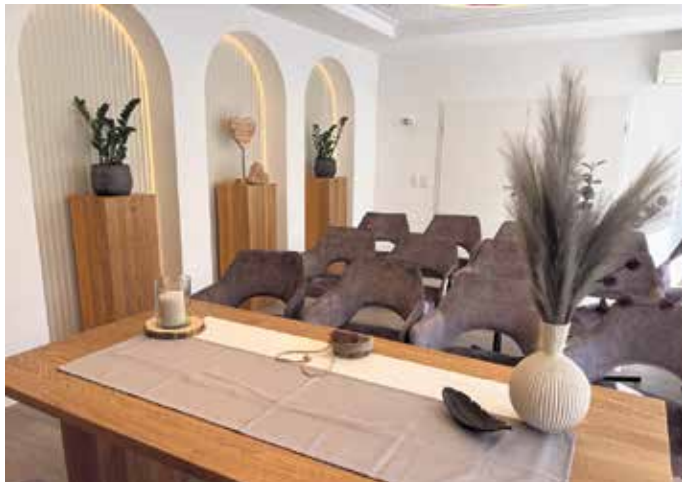
Dezent beleuchtete Rundbögen symbolisieren den Viadukt.

Stilvolle Atmosphäre für den schönsten Tag im Leben