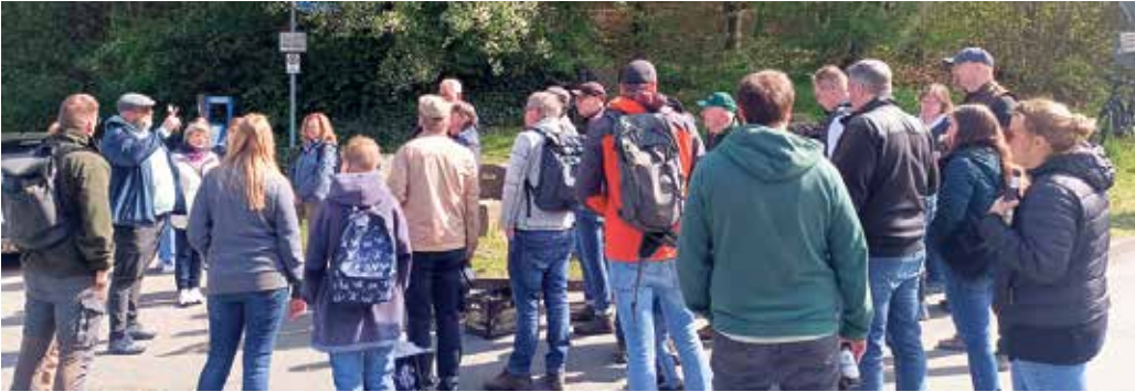
Insgesamt 36 Bollerbornerinnen und Bollerborner machten sich gut ausgerüstet - mit Getränken in den Rucksäcken - auf den Weg die Egge hinauf in Richtung Scholandstein.