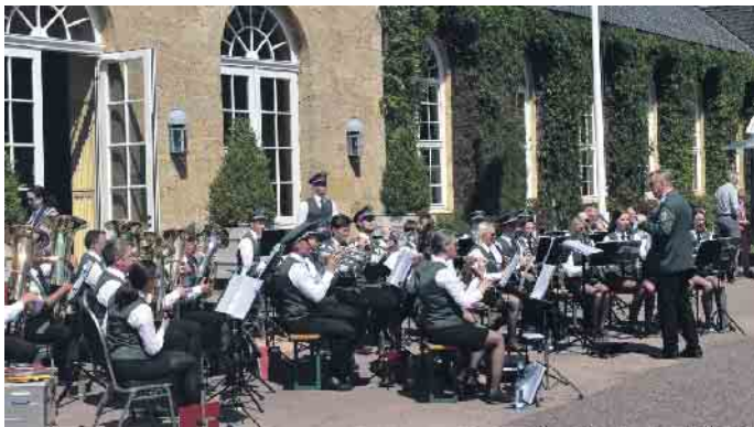
Musikalische Highlights setzen die Stadtkapelle Bad Driburg und das Junge Blasorchester „VORLAUT“, die für mitreißende Klänge sorgen.