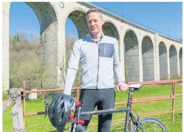
Stadtradeln mit dem Bürgermeister

werden gebeten, eine eigene Picknickdecke sowie Verpflegung mitzubringen. Mit der Tour endet das diesjährige Stadtradeln, welches eine sportliche und gemeinschaftliche Aktion ist, die vom 18. Mai bis zum 7. Juni 2025 zahlreiche Menschen auf das Rad bringt. Die Kampagne soll ein starkes Zeichen für nachhaltige Mobilität und aktiven Klimaschutz setzen. Die Teilnahme ist kostenlos, eine Anmeldung ist jedoch bis zum 1. Juni 2025 per E-Mail an anna.hall@altenbeken.de erwünscht.