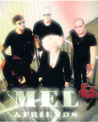
(copyright by Mehdi Amiri): Mel & Friends animiert auf dem Bad Driburger Winzerfest zum Mitsingen, Mitmachen und Genießen

Und am Sonntag sorgen die vier Musiker der Dixieboys mit ihrem erfrischend populären Programm von Dixieland bis zu alten deutschen Schlagern für unbeschwerte Stunden bei gutem Wein, leckerem Essen und geöffneten Geschäften von 13.00 - 18.00 Uhr.