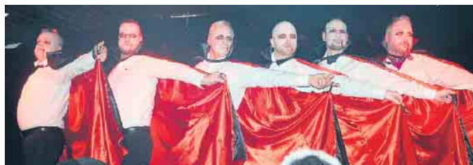
Das Männerballett war mit seinen Tanzdarbietungen als Vampire oder in ihrem Skelettkostüm ein Hingucker.