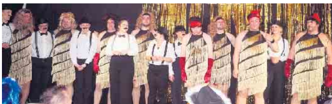
Mit dem Gemeinschaftstanz und einem abschließenden Lied verabschiedeten sich die Karnevalisten/innen von den Jecken im Driburger Grund.

Gegen 23 Uhr endete das diesjährige Bollerborner Karnevalsprogramm. Beim letzten Gemeinschaftsauftritt aller Akteure hielt es auch die Zuschauer/innen wie so oft am heutigen Abend nicht mehr auf ihren Plätzen. Sie ließen eine Bollerborner Ra-