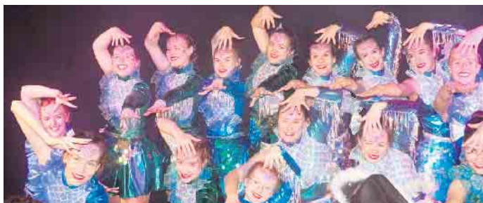
Zum 14. Mal trat die Sälzer Tanzgarde auf der Bollerborner Bühne im Driburger Grund auf.