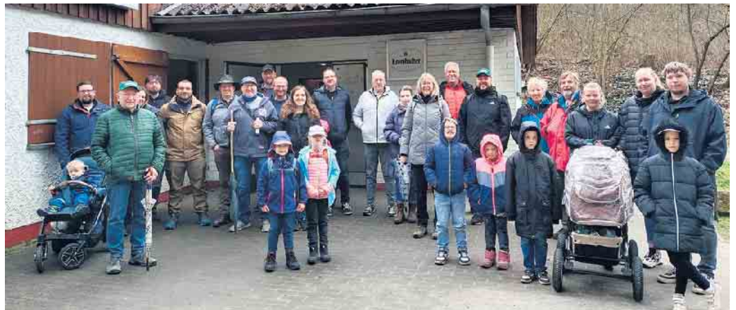
Ein Gruppenfoto zum Beginn der Wanderung. Mit Regenschirmen im Gepäck hatte man sich nicht von einer Teilnahme abbringen lassen.

einiger Zeit wurde von den Maltesern auch ein Fahrdienst zum Einkaufen für Senioren eingerichtet. Ebenfalls wurde eine Jugendgruppe ins Leben gerufen. Nähere Informationen hierzu sind bei den Maltesern zu erhalten. Der Nachwuchs beschäftigte sich in der Zwischenzeit mit dem Anmalen von Steinen und dem Ausmalen von Bildern.