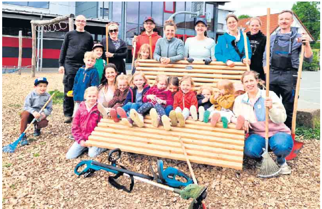
Einweihung der Relaxliege beim Spielplatzeinsatz