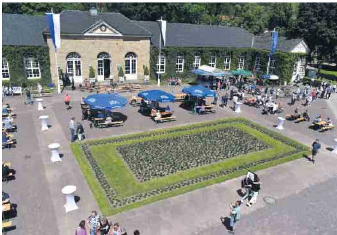
Der Platz vor den Brunnenarkaden wird zum Mittelpunkt des Parkfestes.

Zum Tag der Gärten und Parks in Westfalen-Lippe lädt der Gräfliche Park in Bad Driburg am Sonntag, den 15. Juni 2025, zu seinem beliebten Parkfest ein. Das Team vom Gräflichen Park hat auch in diesem Jahr wieder ein buntes Rahmenprogramm für Jung und Alt zusammengestellt. Die Besucher dürfen sich auf einen unvergesslichen Tag voller Musik, Kulinarik und Unterhaltung freuen. Musikalische Highlights setzen das Junge Blasorchester „VORLAUT“ sowie die Stadtkapelle Bad Driburg, die für mitreißende Klänge sorgen. Für den Gaumen gibt es köstliches Streetfood vom Foodtruck DOGGYLICIOUS sowie