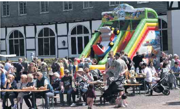
Immer wieder eine riesiger Spaß: die Hüpfburgen für kleine und größere Kinder.