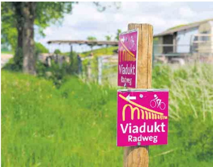
Eine Umleitung ist ausgeschildert

halle in Schwaney und führt für etwa einen Kilometer über befestigte Feldwege unter der B64 hindurch ins Dunetal. Dort trifft die Strecke wieder auf den gewohnten Verlauf. Die neue Streckenführung ist vor Ort ausgeschildert. Wann die Bauarbeiten an der Brücke wieder aufgenommen werden können, ist derzeit nicht absehbar - die Umleitung bleibt daher bis auf Weiteres bestehen.