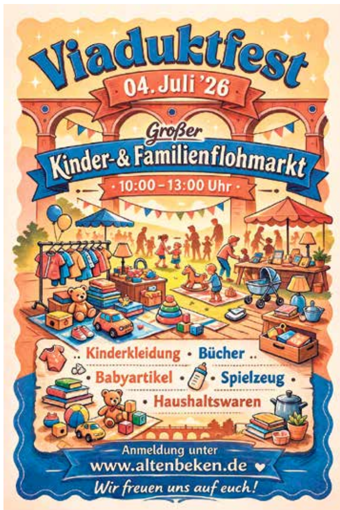
Ein Flohmarkt für Groß und Klein!

echte Flohmarktstimmung. Zwischen Stöbern, Entdecken und kleinen Überraschungen entstehen ganz nebenbei schöne gemeinsame Momente. Weitere Informationen sowie Anmeldemöglichkeiten für einen eigenen Stand sind unter www.altenbeken.de zu finden.