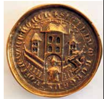
Stadtwappen von Warburg mit Humborg-Pferd

Bronze gegossenen, mittelalterlichen Stadtwappen. Diese Faximiles, nach einem alten Wachs-Siegel, hatte noch Bernd Robert Humborg, vor seinem Tode, als besondere Geschenke für besonders verdiente Persönlichkeiten anfertigen lassen. Nicht ohne dem Stadtwappen auch das Zeichen der Firma Humborg hinzuzufügen: das springende Pferd.