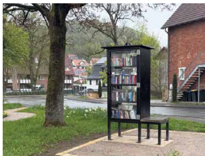
Ein Ort für alle am Place de Betton

Der Bücherschrank bleibt ein offener Treffpunkt: Bücher können gebracht, entnommen und getauscht werden - ein Ort des Austauschs und gemeinsamer Geschichten für alle.