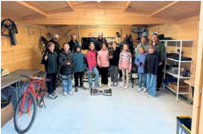
Waren mit viel Spaß dabei: die Kids der 4. Klasse der Grundschule Egge