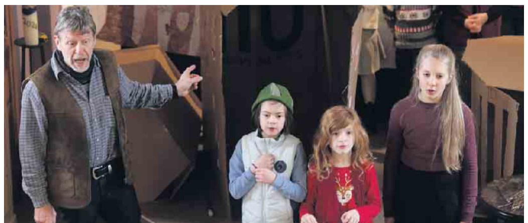
Kinderoper „Hänsel und Gretel“

Am 2. Adventswochenende hatte die evangelische Kirchengemeinde Altenbekens eingeladen: Samstag zu einem „Dämmerstopp“ an der Feuerschale bei Punsch, Glühwein und Käseständen und am Sonntag zur Kinderoper „Hänsel und Gretel“ und einem Adventsmarkt mit Waffeleessen. In guter Atmosphäre und im regen Austausch kamen Jung und Alt zusammen, genossen das Miteinander und die Leckereien, freuten sich über die schöne Aufführung der Kinderoper und staunten über die kreativen Fähigkeiten vieler Menschen, die mit ihrem Gebastelten und Gestrickten, ihrem Gesägten und Genähten sowie ihren Plätzchen einen sehr vielfältigen Adventsmarkt bestückt hatten. Da fiel es manchmal schwer, sich zu entscheiden, was man denn nun mitnehmen soll.