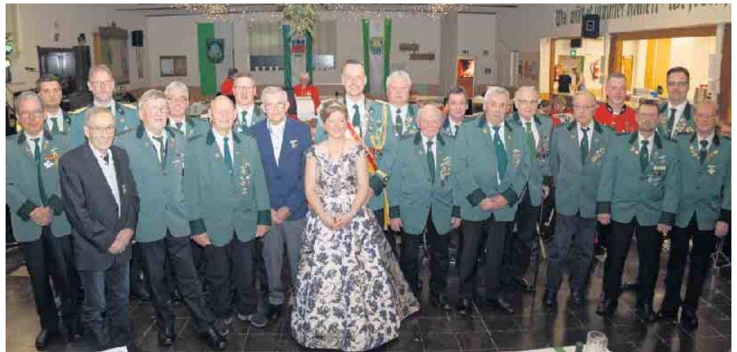
Die Geehrten mit Königspaar