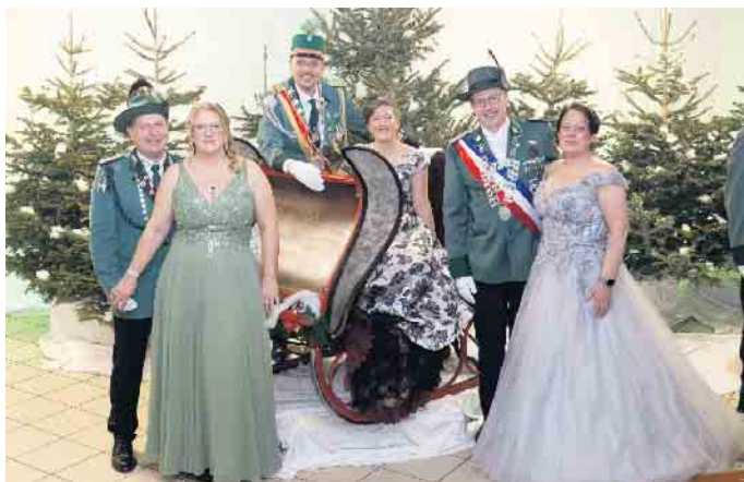
Königspaare der drei Ortsteile auf dem Schlitten.