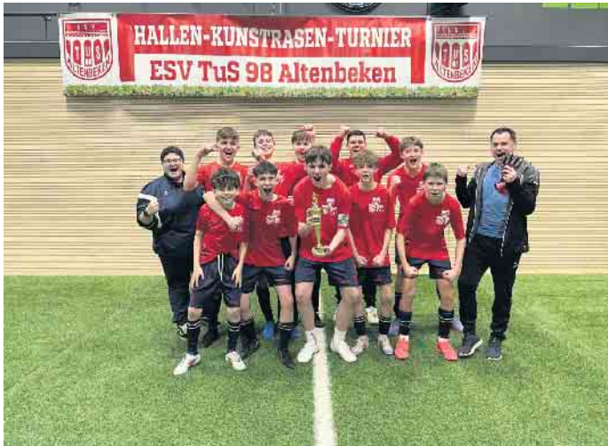
Die erfolgreiche C-Jugend vom TuS