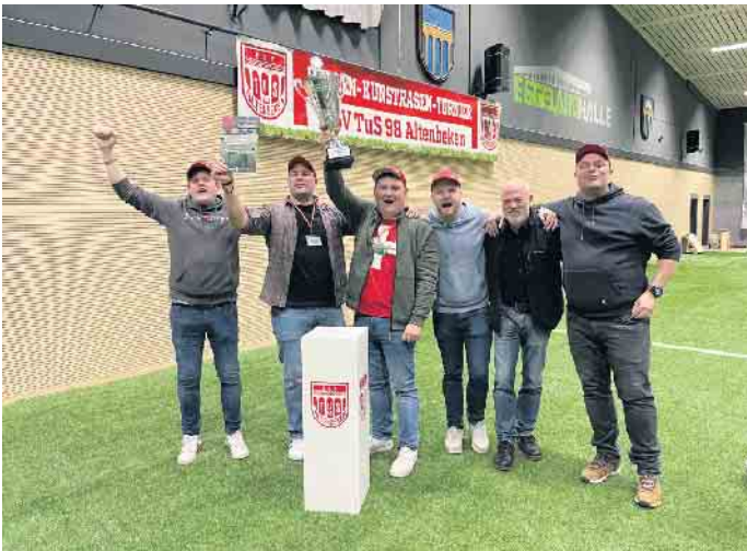
Schweizer Kompanie siegt beim Torwandschießen.

Das Highlight am ersten Samstag war der Firmencup. Mit 16 teilnehmenden Teams konnte nur ein Bruchteil der angefragten Firmen am beliebten Turnier teilnehmen. Den ersten Platz beim Firmencup belegt die Firma Invisible Brands, die mit der Erstteilnahme den langen Weg über die Qualifikationsrunde nehmen musste. Einen starken zweiten Platz erkämpft sich die Fa. Pelipal vor Finke Formgebung. Direkt im Anschluss ist der Frauen-Egge-Cup gestartet. Das Team des VFL Langeland hat sich dort am späten Abend den ersten Platz mit einem 3:1 Sieg im Finale gegen BSV Fürstenberg II geholt. Der Sonntag begann früh mit zwei