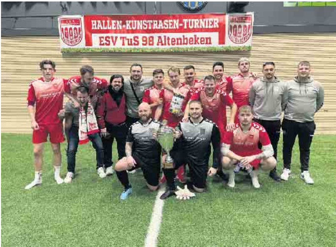
Egge Masters Turniersieger: der ESV TuS 98 Altenbeken

Wir blicken zurück auf zwölf Turniertage mit insgesamt 160 Mannschaften und großartigen Budenzauber in der Eggelandhalle Altenbeken