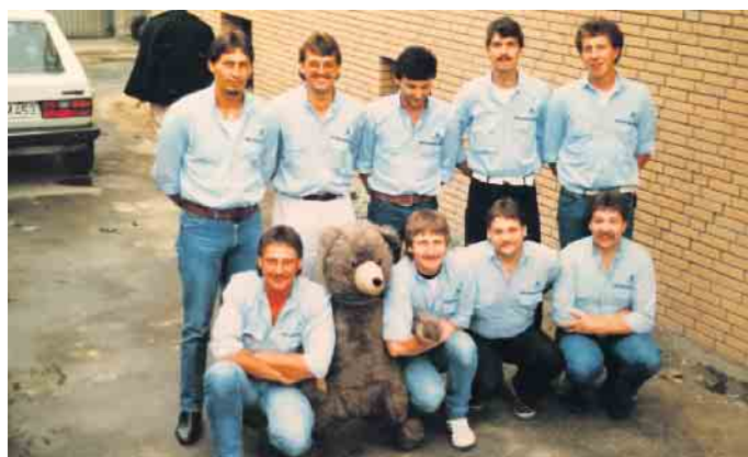
Die Gründungsmitglieder der Wonnebären