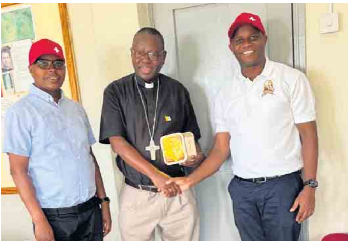
Übergabe der Spendenbox an Bischof Rogard Kimaryo

Am 8. Oktober stand es fest, das WDR 2-Weihnachtswunder 2024 wird in Paderborn stattfinden. Im Rahmen der jährlichen Aktion sammelt der Westdeutsche Rundfunk gemeinsam mit der „Aktion Deutschland Hilft“ u. a. Spenden für die Tafeln in NRW. Unter dem Motto „Altenbeken für das WDR 2-Weihnachtswunder“ fertigte die Schweizer Kompanie insgesamt 14 beleuchtete Spendendosen an und stellte diese in Zusammenarbeit mit dem örtlichen Einzelhandel auf. Am 14. Dezember war es soweit, die WDR 2-Moderatoren zogen in das Glashaus auf dem Paderborner Domplatz, um von hier die nächsten fünf Tage live zu senden. Einen Tag vor dem Finale wurden die Spendendosen eingesammelt und ausgezählt. Nachdem die Spendensumme in Höhe von 1.660 Euro feststand, beschloss der Vorstand, noch am selben Abend nach Paderborn zu fahren, um diese persönlich abzugeben. Auf dem Domplatz angekommen und kurz vor der Live-Schaltung, nutzte Hauptmann Jörg Oel ein kurzes Gespräch mit der WDR 2-Moderatorin Sabine Heinrich, um ihr eine Kompanie-Kappe zu überreichen.