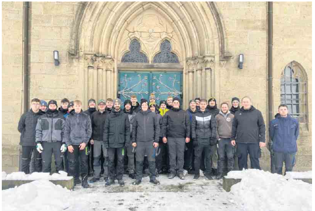
Die Jungschützen vor der Pfarrkirche zur Weihnachtsbaumsammlung.

Am Samstag, 11. Januar, machte sich eine starke Truppe von 30 Mitgliedern der Schwaneyer Jungschützen trotz Schnee und Kälte auf den Weg, um die ausgedienten Weihnachtsbäume im Ort einzusammeln. Dafür konnten sich die Haushalte nicht nur per Telefon, ausgelegten Listen und über E-Mail zur Sammlung anmelden, erstmalig war über QR-Code auch eine Onlineanmeldung möglich. Auch in diesem Jahr war die Weihnachtsbaumsammlung wieder ein voller Erfolg: Insgesamt sammelten die Jungschützen rund 180 Tannenbäume aus 150 Schwaneyer Haushalten ein und konnten so eine stolze Spendensumme von 1.000 Euro erzielen, die in diesem Jahr dem Kinder- und Jugendhospiz - Bethel zugutekommt. Im Anschluss an die Sammelaktion gab es für die fleißigen Helfer noch eine Stärkung in der Gaststätte Lerch, die sie sich nach dem anstrengenden Tag redlich verdient hatten. Max Rehermann