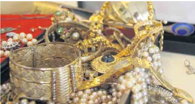
Ansprechpartner für die Wertermittlung von Schmuck, Münzen oder Edelsteinen.