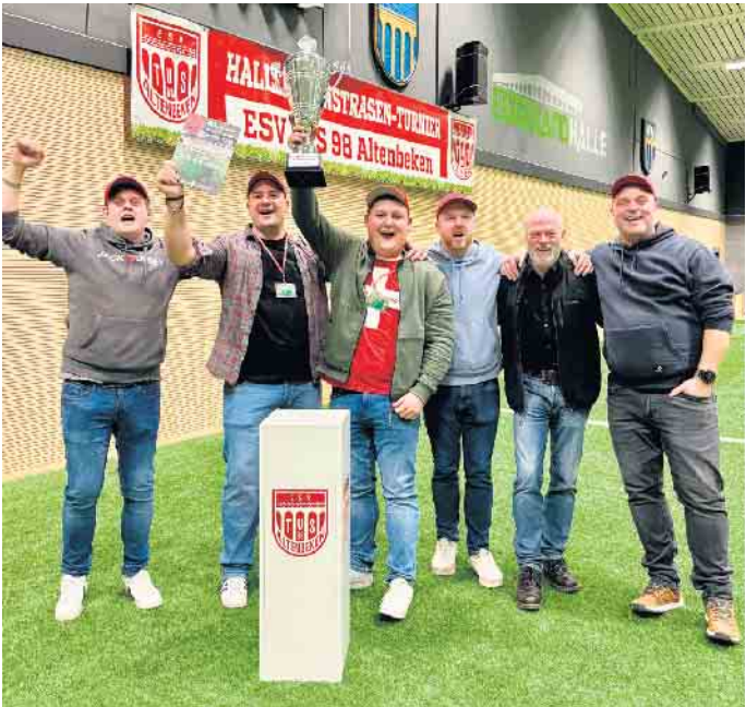
Sieger Schweizer Kompanie Vereinstunier des TUS Altenbeken

Vereine“ des TUS Altenbeken ihr außergewöhnliches, fußballerisches Talent. Mit präzisen Schüssen setzen Sie sich gegen die Konkurrenz durch und holten den Vereinspokal nach Jahren der Abstinenz zurück in die Schweiz.