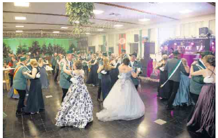
Ehrentanz der Königspaare und Hofstaaten