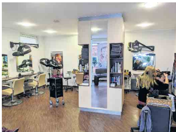
Der Friseurladen ist in einem guten Zustand und auch die Telefonnummer wird beibehalten.

Geöffnet ist „Ihr Haarstudio“ dienstags bis freitags von 8 bis 18 Uhr und samstags von 8 bis 13 Uhr.