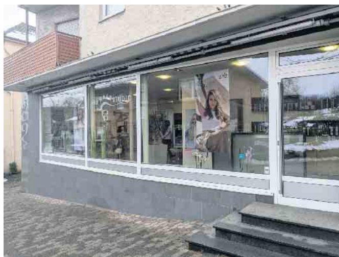
Der Friseurbetrieb „Ihr Haarstudio“ in der Bahnhofstraße 2 wurde vor über 100 Jahren als Salon Lendeckel gegründet.