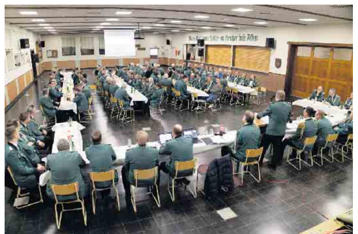
Blick in die Versammlung