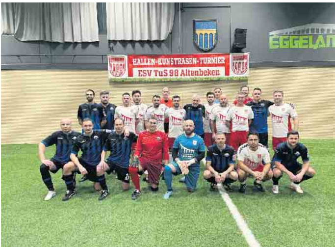
Alte Herrn Ü 40 vor dem Spiel gegen den SCP 07

C-Jugend-Turnieren. Beim zweiten C-Jugend-Turnier konnte sich die JSG Altenbeken-Benhausen-Neuenbeken nach einer starken Leistung mit dem ersten Platz belohnen. Am Nachmittag gab es mit der Premiere der Egge Masters einen perfekten Wochenendausschluss. Das mit zehn Kreisliga-Teams besetzte Turnier hat viele Zuschauer in die Halle gelockt und die bekamen viel geboten. In einem packenden Beke-Derby-Finale gegen den SCV Neuenbeken konnte sich der TuS Altenbeken mit 3:2 durchsetzen und den Titel vor heimischer Kulisse gewinnen. Das letzte Turnierwochenende ist rum und es war nochmal einiges