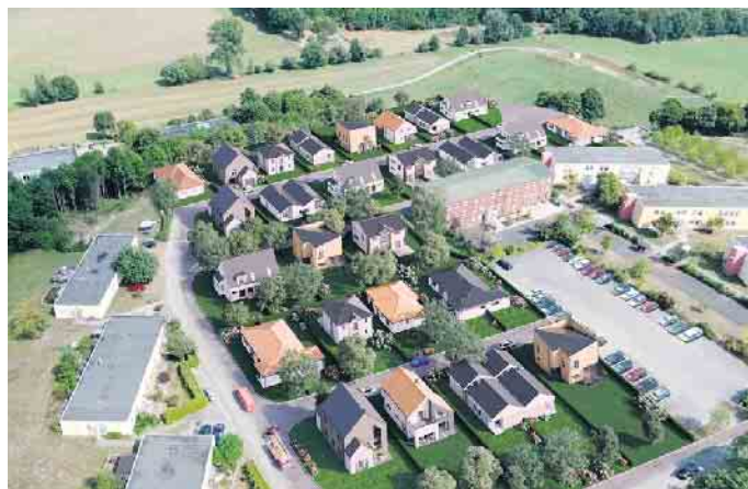
Bebauungsbeispiel für das Neubaugebiet Lütkerlinde

Weitere Informationen und einen Teilungsvorschlag der Grundstücke finden Sie auf der Projektseite unter www.lütkerlinde.de .