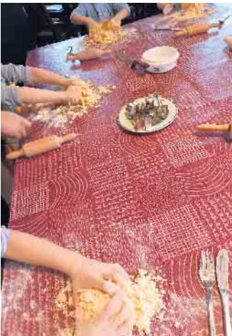
Die Kinder beim Kneten

te keine Grenzen, als sie mit buntem Zuckerguss, Schokolinsen und Streuseln ihre Kekse in wahre Kunstwerke verwandelten. Großes Interesse fand bei den Kindern auch das funktionierende Modell einer Mühle. Solche Veranstaltungen schaffen besondere Erinnerungen. Es war eine gelungene Mischung aus Spaß, traditionellem Handwerk und vorweihnachtlicher Freude, die uns alle daran erinnerte, dass die einfachsten Freuden oft die kostbarsten sind und wie wichtig es ist, die schönsten Traditionen gemeinsam zu pflegen. Wir freuen uns auf weitere Veranstaltungen und wenn es wieder heißt: „In der Weihnachtsbäckerei mit den Schulkindern des Kindergartens“.