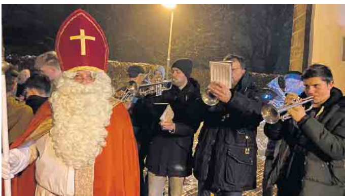
Der Nikolaus in musikalischer Begleitung der Buker Husaren.