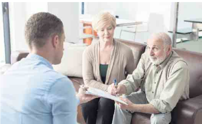
Wenn der Pflegefall eintritt, muss vieles schnell organisiert werden.