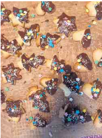
Das Ergebnis aus buntem Zuckerguss, Schokolinsen und Streuseln