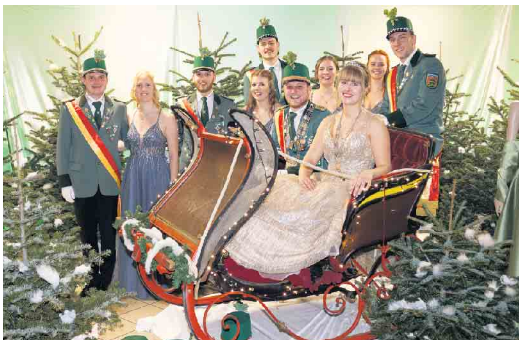
Schwaneyer Königspaar und Hofstaat im Schlitten auf dem Bühnenbild