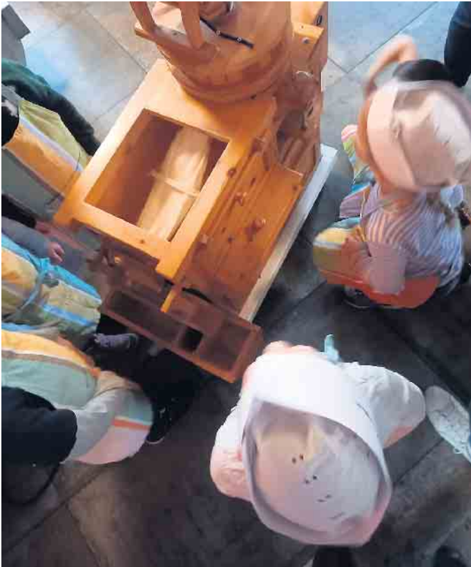
Das funktionierende Mühlenmodell

gesordnung ist dabei die Wahl verschiedener Vorstandsposten. Weiterhin wird der Vorstand über Neuigkeiten aus dem Verein sowie den Stand der Platzrenovierung berichten. Der Vorstand freut sich auf eine rege Teilnahme.