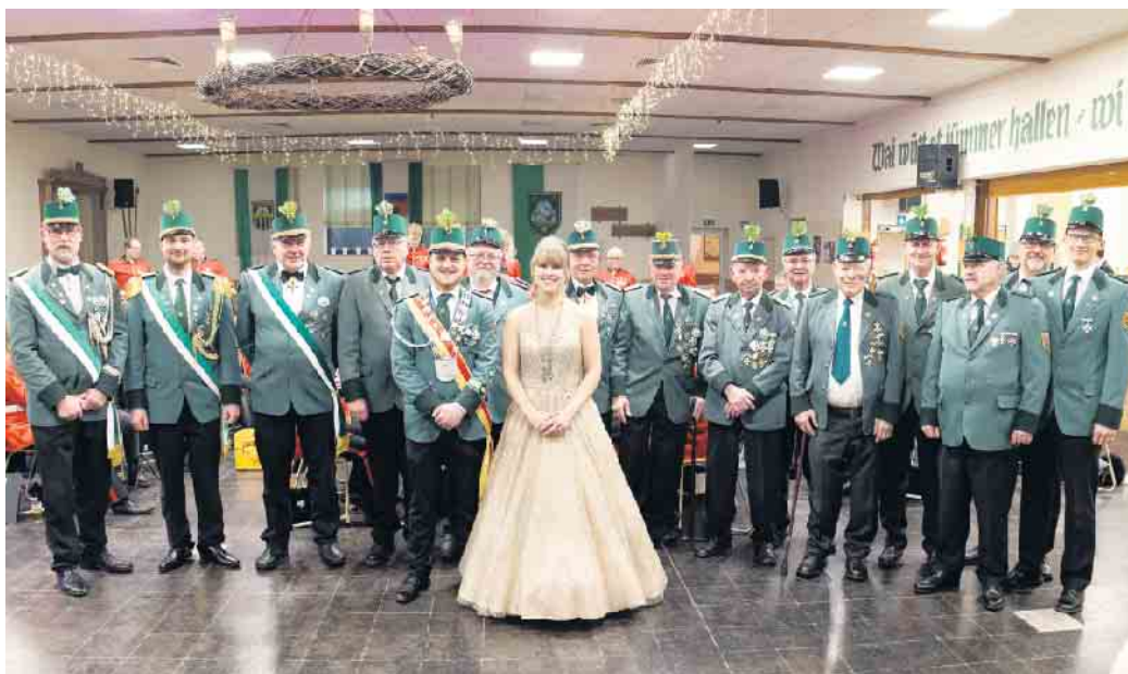
Mit Treueorden für langjährige Mitgliedschaft ausgezeichnete Schützen

Die Partyband „DOLCE VITA“ sorgte mit fetziger Musik und einer bestens aufgelegten Sängerin für tolle Stimmung und so wurde getanzt und gefeiert bis in die frühen Morgenstunden - ein wunderbarer Einstieg in das Schützenjahr 2024.