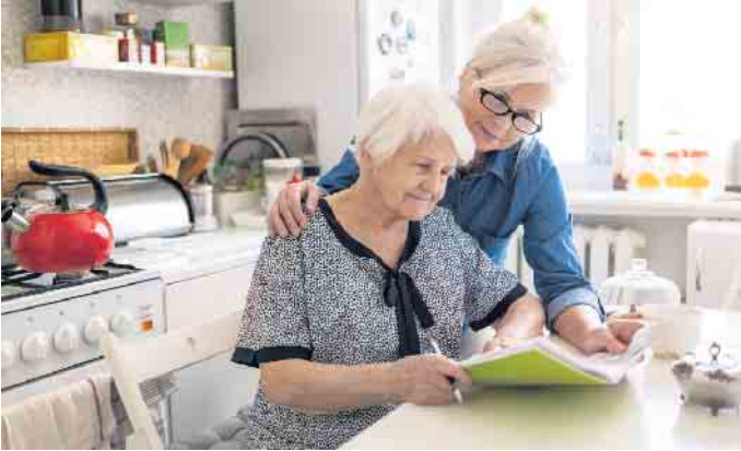
Das Thema Pflege muss kein Buch mit sieben Siegeln bleiben. Dafür sorgen diverse Beratungsangebote.

tungsstelle oder bei der Compass privaten Pflegeberatung informieren. Diese Stellen bieten Rat und Hilfe bei allen Fragen rund um die Organisation der Pflege und um Leistungsansprüche. Getragen werden die Stellen in der Regel von der jeweiligen Kommune oder von Pflegediensten. (djd)