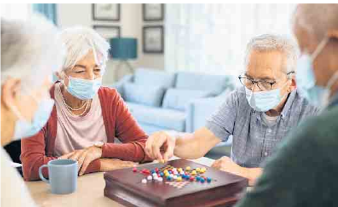
Die Alternative zur häuslichen Betreuung sind Pflegeheime oder zahlreiche Möglichkeiten betreuten Wohnens.