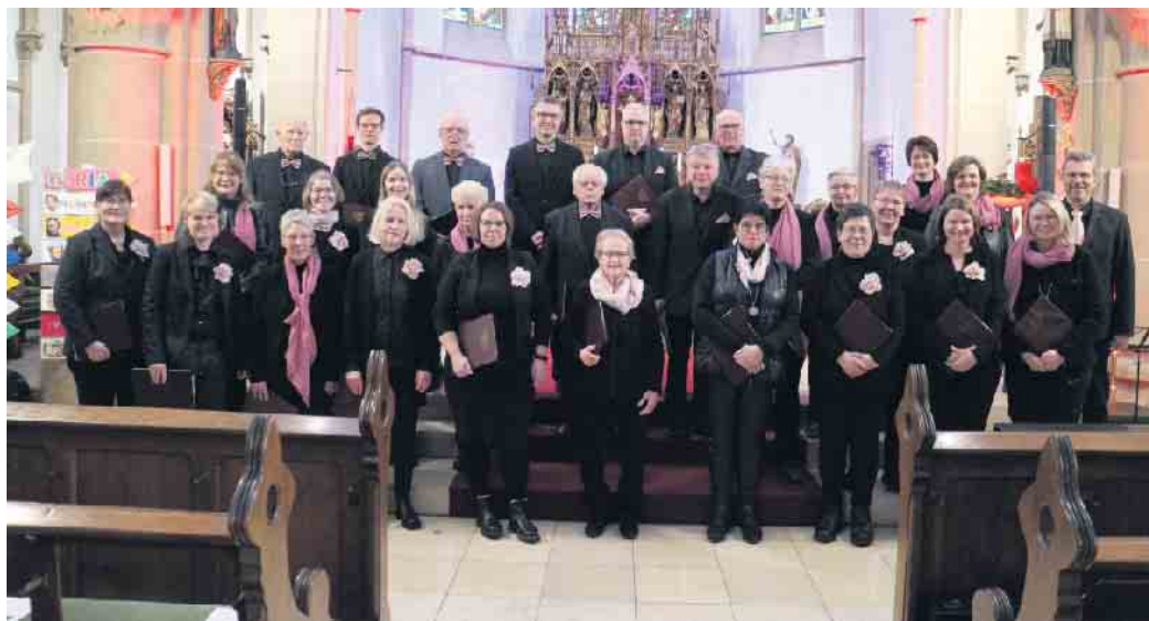
Die Sängerinnen und Sänger der Chorgemeinschaft Cäcilia Schwaney unternahmen eine musikalische Weltreise.

Dieser Betrag ist für das Kinderheim „Star of Hope“ in Kenia bestimmt, das von den Schwestern vom „Kostbaren Blut“ in Neuenbeken betreut wird. Damit leistet die Chorgemeinschaft einen wertvollen Beitrag, um den Kindern in Kenia eine bessere Zukunft zu ermöglichen.