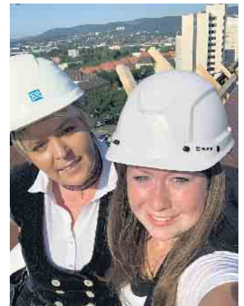
Klimaschutz, keine reine Männersache; es gibt auch Frauen im Dachdeckerhandwerk.

geeignete Maßnahmen wie Wärmedämmung an Wänden, am Dach oder an der oberen Geschossdecke aus, durch die schon viel Energie eingespart werden kann. Dachdecker und Dachdeckerinnen sind wichtige Berater, wenn es darum geht, welche Maßnahmen sinnvoll sind, aber auch, welche Fördergelder infrage kommen. Zum Beispiel lassen sich durch Kredite bei der KfW oder der Nutzung von Steuerermäßigungen für energetische Sanierungen auch im privaten Wohnungsbau deutliche Einspareffekte erzielen. „Dachdecker sind daher ganz wichtige Akteure, wenn es um das Erreichen der Klimaschutzziele geht, denn sie sind Spezialisten, die die notwendigen Sanierungs-Maßnahmen im Gebäudebestand planen und durchführen“, erläutert Claudia Büttner, Pressesprecherin beim Zentralverband des Deutschen Dachdeckerhandwerks (ZVDH). Dachdecker sind Klimaschützer Zunehmend wird es auch wichtig, den bereits deutlich spürbaren Veränderungen durch den Klimawandel zu begegnen, zum Beispiel der Hitzebelastung in Ballungsgebieten. „Dachdecker und Dachdeckerinnen sorgen mit ihrer fundierten Arbeit nicht nur für eine trockene und behagliche Wohnung, sondern tragen als Teil einer klimabewussten Gesellschaft mit ihrer Arbeit dazu bei, dass unsere Welt auch in Zukunft lebenswert bleibt. Denn neben der Sanierung brin-