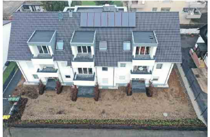
Das Dachdeckerhandwerk, der richtige Ansprechpartner für die Solaranlage auf dem Dach.

sind unzureichende Renovierungsraten. Angestrebt werden müsse mindestens eine Verdoppelung der derzeitigen Rate, die aktuell bei 1 % liegt. Besser noch wäre nach Meinung der Klimaexperten eine Rate von 3,5 %. Hier kommt das Dachdeckerhandwerk ins Spiel: Sie führen