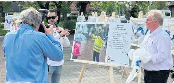
Eröffnung 13. April 2024

Anlässlich seines 50-jährigen Bestehens hatte der Heimat- und Verkehrsverein Alpen e. V. im Rahmen der 950-Jahr-Feiern die Aktion Mensch Alpen ins Leben gerufen und im Ortskern von Alpen Schil-