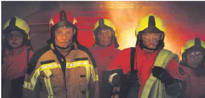
Muster für eine Tafel

dertafeln aufgestellt, auf denen Personen vorgestellt wurden, die mit ihrem Engagement nicht immer in „erster Reihe“ stehen. Aufgrund des anstehenden Winters werden diese Tafeln nun abgebaut und eingela-