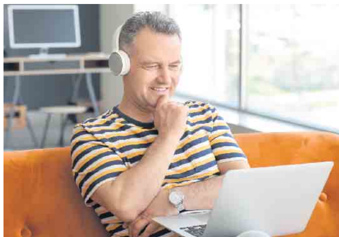
Beim Online-Coaching wird mithilfe erprobter, kreativer Methoden der individuell passende Lösungsweg bei der Jobsuche gefunden.

Ein professionelles Coaching kann beispielsweise mit einem sogenannten „Aktivierungs- und Vermittlungsgutschein“ (AVGS) vom Jobcenter oder von der Agentur für Arbeit finanziert werden. Diesen kann man bei zertifizierten Anbietern einlösen. Voraussetzung dafür ist, dass man arbeitsuchend oder von Arbeitslosigkeit bedroht ist. Das kann zum Beispiel auch Hochschulabsolventen, Berufsrückkehrer und Selbstständige betreffen. (djd)